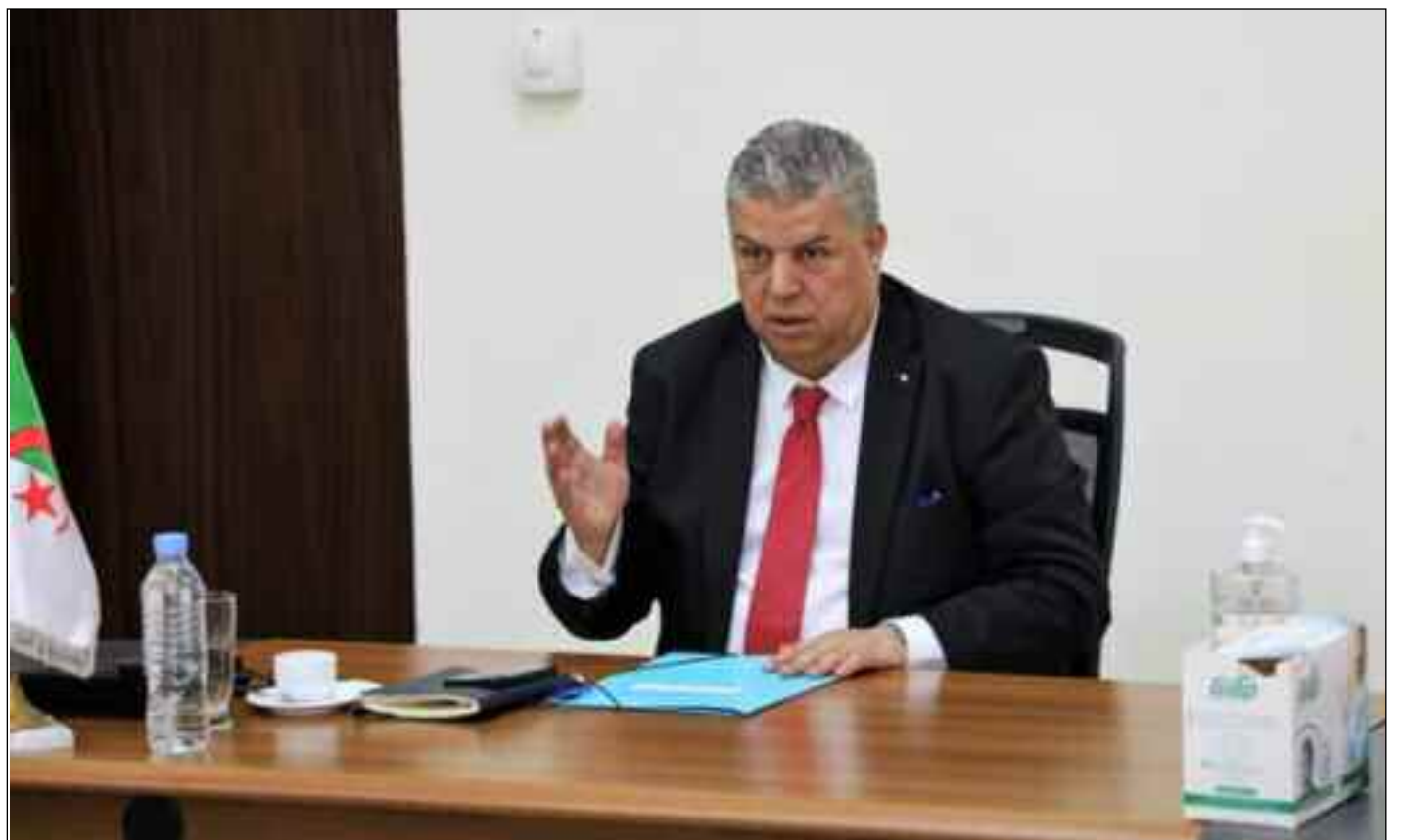
■ La FAF appelle à «plus de fermeté» dans l'organisation des rencontres.

Et dans son élan, il évoque l'impérieuse nécessité de fermer les portes à toute violence, annonce qu'il y aura une sérieuse révision et une réadaptation de l'arsenal réglementaire et juridique pour endiguer la violence, dans et autour des stades de football. Ce recadrage est d'une grande importance, et urgent pour «poursuivre le travail de sensibilisation contre la violence et pour la promotion du fair-play en utilisant tous les moyens dont disposent les acteurs du football et leurs