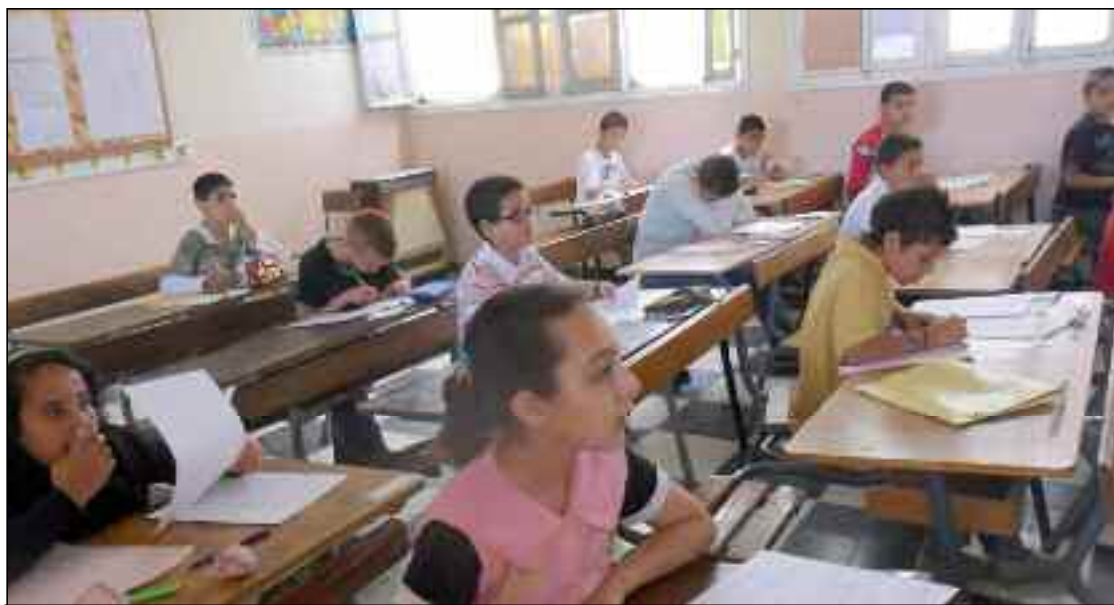
■ Début avril dernier, le ministère de l'Education nationale a assuré qu'aucun retard de plus de deux semaines n'a été enregistré dans toutes les matières et au niveau de tous les établissements éducatifs.

Début avril dernier, le ministère de l'Education nationale a assuré qu'aucun retard de plus de deux semaines n'a été enregistré dans toutes les matières et au niveau de tous les établissements éducatifs, s'agissant de la dispense des cours dans les cycles, primaire et moyen. Ce qui a permis, a indiqué Boubaker Seddik Bouaza, le Secrétaire général du ministère de l'Education nationale, lors d'une conférence de presse animée conjointement avec l'Inspecteur général de l'Education