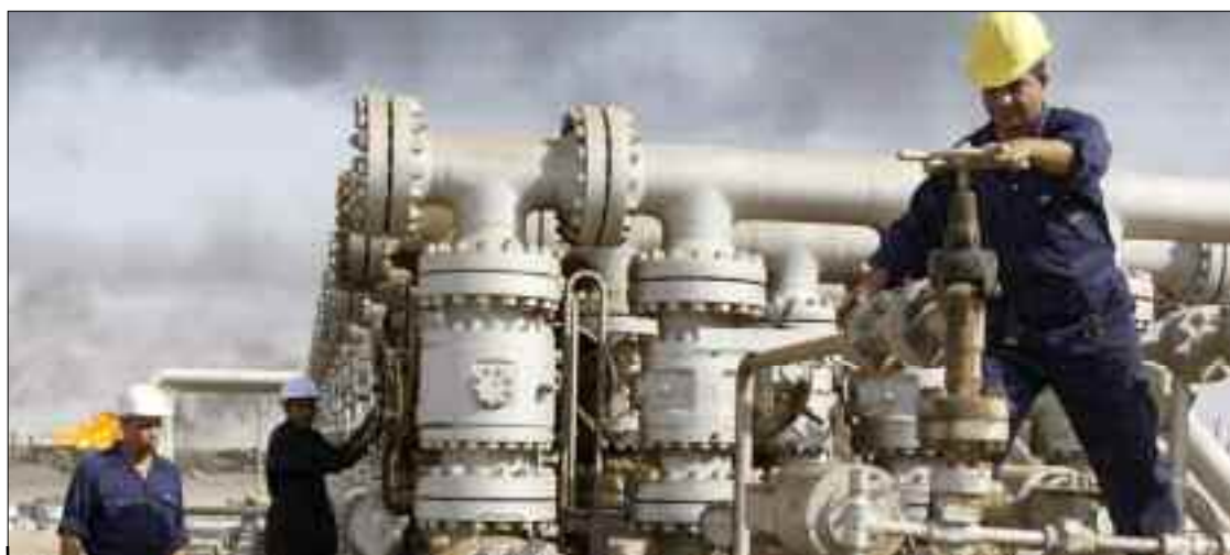
Les pays signataires de la Déclaration de Coopération se montrent prudents et attentifs à l'évolution de la situation sanitaire dans certains pays, à l'instar de l'Inde.

Depuis le début de 2021, la demande se normalise, boostée, particulièrement par la campagne massive de vaccination anti-Covid-19, la levée des restrictions dans plusieurs pays industrialisés du monde et l'amélioration du marché de la pétrochimie. Après des mois incertains, les prix du pétrole finissent proches de l'équilibre et des niveaux de l'avant-crise sanitaire qui a paralysé davantage le marché pétrolier mondial. Avec les signes de la reprise soutenue de la consom-