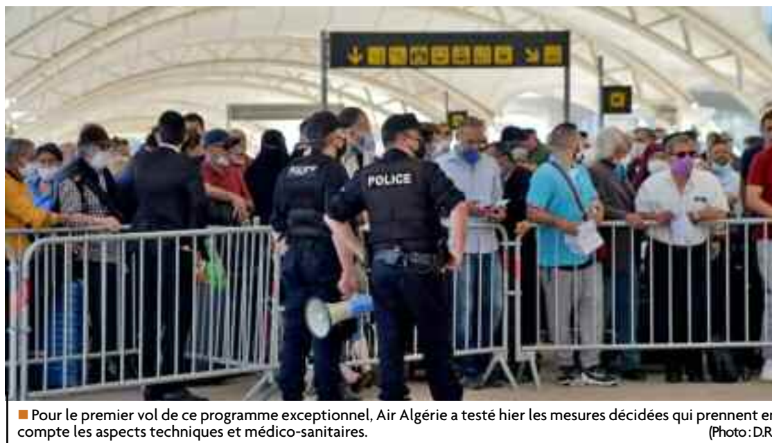
■ Pour le premier vol de ce programme exceptionnel, Air Algérie a testé hier les mesures décidées qui prennent en compte les aspects techniques et médico-sanitaires.

Ainsi, le protocole sanitaire avec marquage au sol et parcours fléché, a été appliqué avec la plus grande rigueur dès l'entrée du hall de l'aéroport jusqu'à la salle d'embarquement avec d'abord le préalable de la prise de température qui constitue un véritable sésame, avant les formalités habituelles de l'enregistrement et du contrôle de police aux frontières, puis le contrôle douanier, l'attente dans la salle d'embarquement, avec en permanence le port du masque et le respect de la distanciation physique, ponctué par l'utilisation du gel hydro alcoolique chaque fois que nécessaire. Les voyageurs sont munis de leur test PCR de moins de 36 heures en plus des documents de voyages. Si les choses se compliquent pour un voyageur au plan sanitaire, un médecin est prêt à intervenir. La plupart des voyageurs se rendant en France ce matin, dans un communiqué à la radio algérienne, se sont déclarés satisfaits de cette décision et des mesures sanitaires imposées au niveau de l'aéroport pour limiter la propagation du virus Corona, en contrepartie,