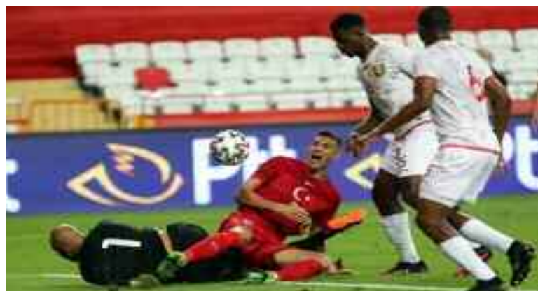
Les Guinéens se sont montrés plus intelligents.

→ Le report au mois de septembre des deux premières journées des éliminatoires du Mondial-2022, donne une occasion aux sélections africaines de programmer des matches amicaux en ce mois de juin 2021. Et sur ces dates FIFA, la Guinée est la première à entrer en duel face à la Turquie ce lundi à Antalya.