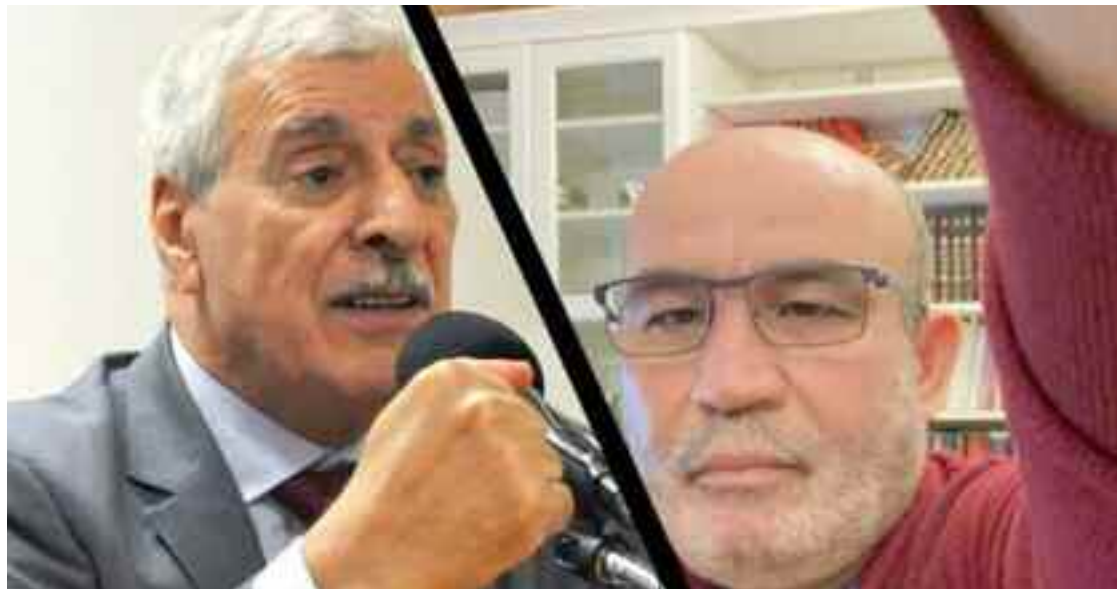
■ La revue El Djeich avait fustigé ces deux mouvements «qui s'allient aux ennemis de l'Algérie pour attenter à sa sécurité et à sa stabilité, en recrutant des mercenaires».

Ils persistent à maintenir une alliance de façade pour déstabiliser l'Algérie et s'entredéchirer ensuite au détriment des Algériens qui seront alors dans une situation dramatique. La tentative de dévoyer le Hirak est clairement annoncée dans les propos des dirigeants de Rachad. Ce documentaire fait suite au classement par l'Algérie de Ra-