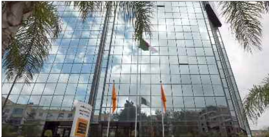
■ «Sonatrach s'engage à intensifier ses efforts pour atténuer les émissions de gaz à effet de serre (GES), à travers l'amélioration de l'efficacité énergétique».

«La Sonatrach ne ménagera aucun effort pour s'attaquer aux autres problèmes environnementaux afin de protéger la biodiversité du patrimoine naturel national, préserver la qualité et la disponibilité des ressources hydriques du pays, garantir la qualité de l'air et utiliser efficacement les ressources naturelles», a assuré, hier, le Président-directeur général de Sonatrach.