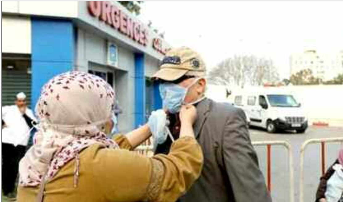
■ Dr. Yousfi: «On ne le répétera jamais assez. L'urgence, aujourd'hui, ce sont les mesures barrières à respecter en attendant d'avancer dans la vaccination»

Pour sa part, le chef de service réanimation du CHU Saadna Abdenour de Sétif a fait état de la saturation, depuis une semaine, soit depuis le début du mois en cours, des services Covid-19 et ceux des urgences. Une saturation, dit-il sur les ondes de la Chaîne III de la radio algérienne,