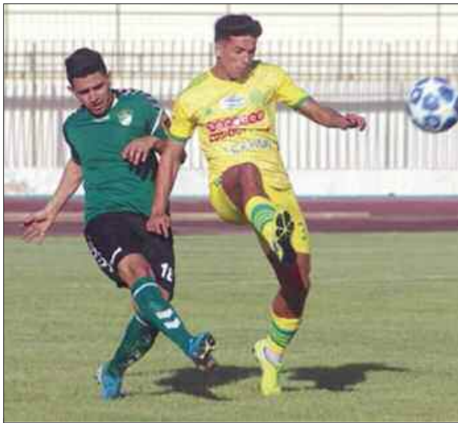
■ La JSK coule des jours heureux.

Contre toute attente, Saoura n'a pas pu confirmer sa puissance de frappe puisqu'elle s'est faite éliminée. On dira que ce jour, la JSS a évolué avec plusieurs absences dont leur buteur Messaouden. Elle était partie offrir du beau spectacle et laisser le temps au jeu pour sanctionner la mauvaise équipe. Et en bout de course, les locaux plus engagés parviennent par l'intermédiaire de Bouchouareb à couper le but inaugural dès la 20'. Le temps de jeu qui restait pour boucler la première tranche du match, les Magris ont su, d'une manière tout à fait logique, maintenir le rythme de jeu et préserver cet avantage de (1-0). La seconde mi-temps a mis beaucoup de temps pour reprendre, un invité surprise fait son entrée dans les vestiaires puis sur le terrain, en l'occurrence la violence. L'origine des échauffourées qui ont pris feu dans les vestiaires serait le fruit d'une accusation de la JSS portée contre leurs homologues du NCM sur un sujet que nous ignorons. Forcément cette accusation fut vite rejetée par la seconde partie, via la personne du président de Magra. Cette étincelle déclencha une vive réaction à l'extérieur des vestiaires. «Il aura fallu l'intervention du service de sécurité et de plusieurs personnes pour éviter que les choses s'enveniment d'avantage». Ce dérapage gâcha la partie jusqu'à cette décision de la Saoura de ne pas reprendre le jeu, ce qui causera une perte de temps estimée à plusieurs minutes. Les joueurs finirent par rentrer sur le terrain et pour-