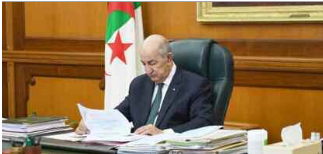
■ Tebboune a plaidé pour la poursuite des négociations au niveau de la convention-cadre sur le changement climatique qui est le seul forum capable de trouver les solutions idoines.

Il a souligné dans son discours, l'obligation de «se conformer de manière juste et équilibrée» aux