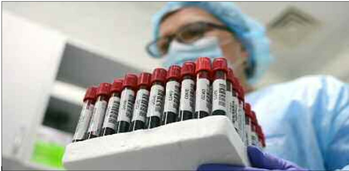
■ «Malgré le faible élan de solidarité en matière de vaccination, l'Algérie a réussi à assurer suffisamment de doses grâce au dispositif Covax et aux accords avec des producteurs».

L'Algérie a commandé 30 millions de doses de vaccins contre le Coronavirus (Covid-19) dans le cadre d'un achat bilatéral, a révélé, hier mercredi le ministre de la Santé, de la Population et de la Réforme hospitalière, Pr. Abderrahmane Benbouzid. «Deux commandes de 15 millions de doses chacune ont été passées avec plusieurs fournisseurs, soit 30 millions de doses qui nous seront livrées», a-t-il indiqué dans un entretien paru hier mercredi dans le journal Liberté.