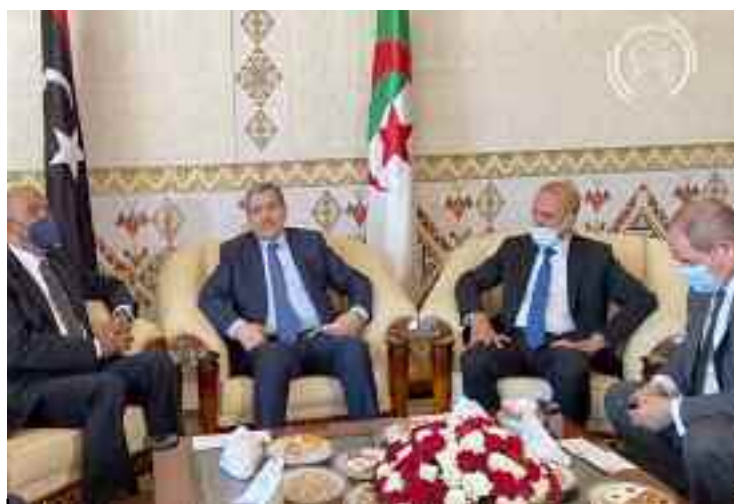
Les autorités de transition libyenne se tournent vers leur fidèle allié historique, l'Algérie, le premier pays visité par le Chef du Gouvernement d'Union en Libye.

Lors de cette rencontre, le chef de l'Etat algérien, Abdelmadjid Tebboune avait exprimé l'engagement de l'Algérie d'œuvrer conjointement avec les autorités de transition libyennes pour «renforcer sa légitimité» pour affronter