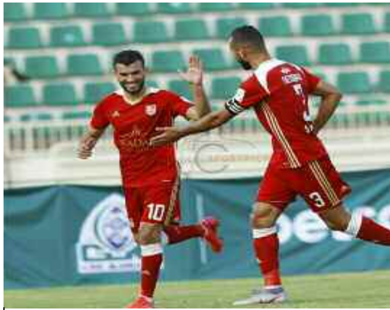
Le CRB (43 pts) revient à un point du MC Oran.

→ Le CR Belouizdad, large vainqueur, mardi, devant la JSM Skikda (6-0) pour le compte de la mise à jour du calendrier du championnat de Ligue 1 de football, se hisse à la 4 e place du classement, alors que le MC Alger et l'O Médéa ont fait match nul (0-0) et restent dans le ventre mou du classement.