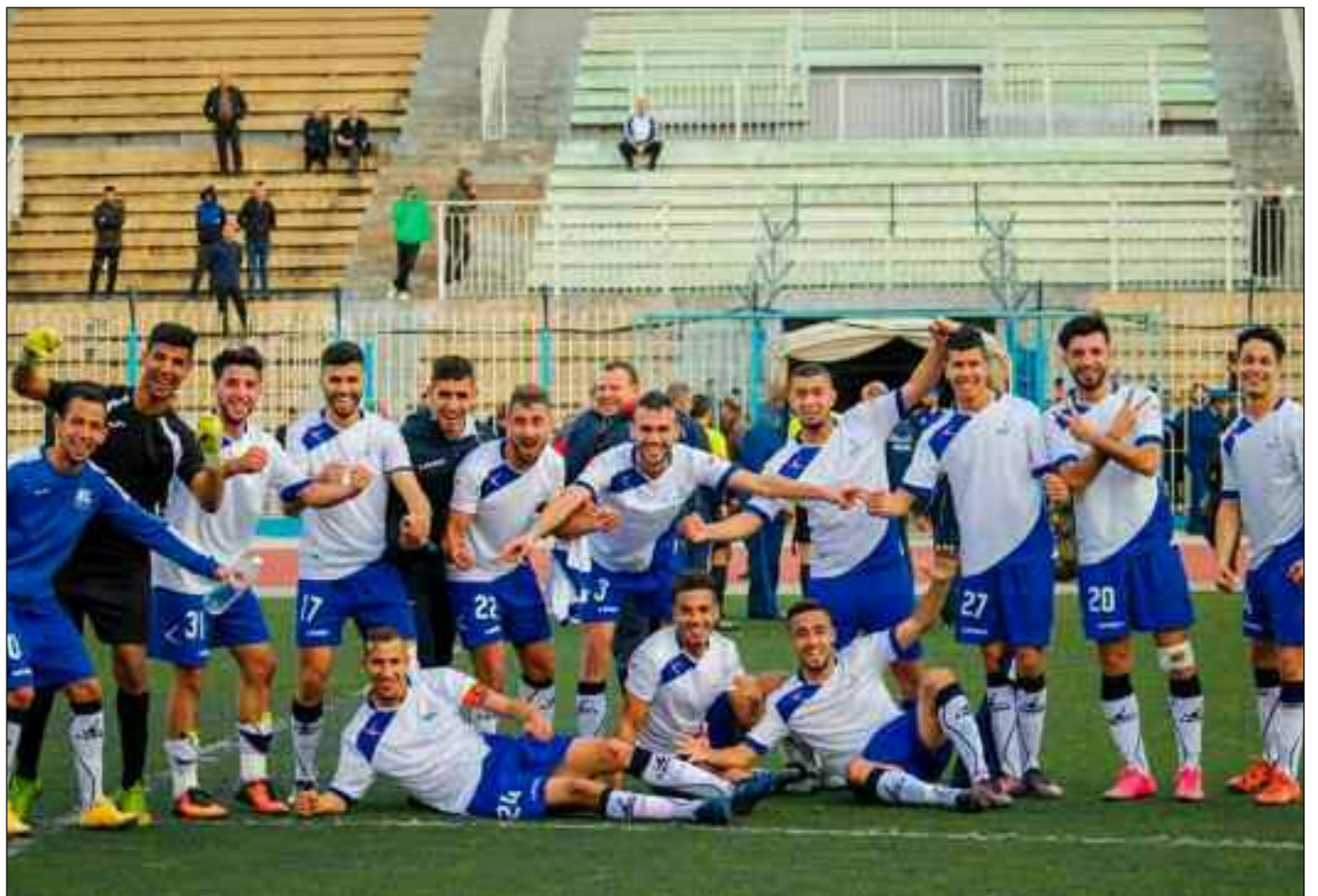
■ Le NCM heureux de se trouver en finale.

Enfin, il y a ce jeu caractérisé par certains comportements que des joueurs ont malheureusement pris un peu trop l'habitude d'enlever le maillot, d'effectuer le tour du stade après avoir inscrit le but, accompagné par des personnes qui n'ont rien à voir sur le terrain ou sur la main