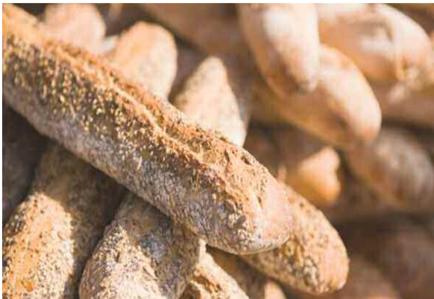
Longtemps concurrencée par la galette souvent préparée par des mains habiles, le pain n'a jamais pu être détrôné pour sa valeur alimentaire et sa saveur irremplaçable.

Les gens croyaient que le pain n'existait que sous ce format. Plus tard, avec l'évolution, l'influence des voyages, on se mit à faire des baguettes au grand étonnement des consommateurs qui les trouvèrent bonnes pour le goût et la saveur. Les boulangers eurent l'idée géniales de façonner puis de mettre en vente ce qu'il y a de plus fin et de bon surtout pendant le mois de ramadhan, on les a appelées les ficelles pour lesquelles on eut un certain engouement. Auparavant, il y a eu l'invention de la