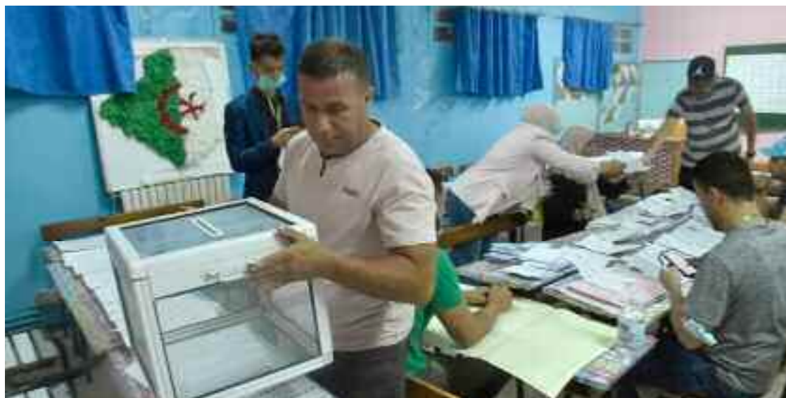
■ «Ce nouveau mode de scrutin requiert un dépouillement plus affiné avec deux comptages, d'abord pour déterminer les listes gagnantes puis pour identifier les personnes qui totalisent le plus grand nombre de voix».

«Ce nouveau mode de scrutin requiert un dépouillement plus affiné avec deux comptages, d'abord pour déterminer les listes gagnantes puis pour identifier les personnes qui totalisent le plus grand nombre de voix». Il fait remarquer que «ce nouveau mode de scrutin requiert un dépouillement plus affiné avec deux comptages, d'abord pour déterminer les listes gagnantes puis pour identifier les personnes qui totalisent le plus grand nombre de voix».