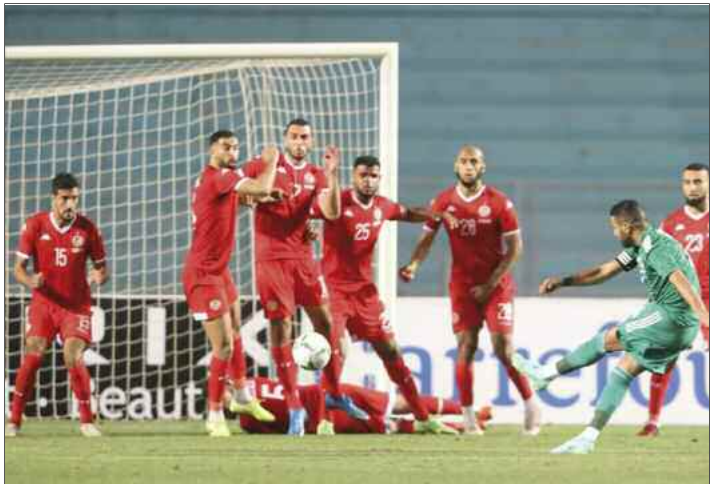
■ Mahrez, un joueur de classe mondiale.

En fait, n'était-il pas en train de massacrer l'image du football africain ? La distribution des cartons jaune pour les uns et un rouge pour Guedioura à la limite de la fin de la partie ne pouvait cacher cette envie de «casser» les Verts, et c'est justement cette manière de faire qui mobilisera davantage le clan de Belmadi, à muscler le jeu, à resserrer les rangs et mieux atta-