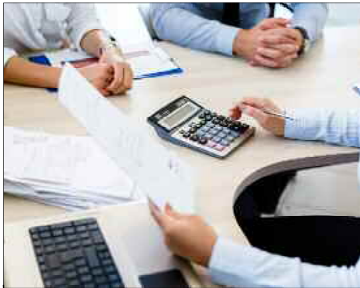
■ Désormais, tous les opérateurs économiques sont tenus d'offrir et de développer leur service après-vente.

Désormais, tous les opérateurs économiques sont tenus d'offrir et de développer leur service après-vente. Dans cet objectif et pour une gestion optimale des périodes de garanties et de service après-vente, le législateur a promulgué un nouveau décret qui «s'applique aux biens destinés au consommateur après expiration de la période de garantie ou dans les cas où la garantie ne peut jouer, précisant que le service après-vente peut être assuré par une autre personne physique ou morale à laquelle le fabricant et/ou l'importateur font appel pour la réalisation du service après-vente», stipule le décret exécutif fixant les conditions et les modalités de mise en œuvre du service après-vente des biens, publié au Journal officiel n° 45. Ce dernier est destiné à «fabriquer et/ou l'importateur de biens qui doit assurer le service après-vente du bien mis sur le marché