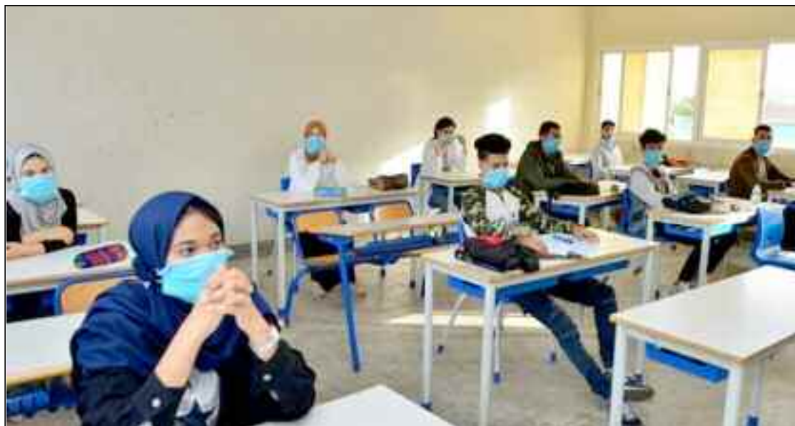
■ Pour cet examen du BEM, le Commandement de la Gendarmerie nationale a prévu un dispositif sécuritaire spécial à travers le territoire national pour accompagner le déroulement des épreuves.

Tous les moyens, humains et matériels, ont été mobilisés pour mener à bien le déroulement de cet examen, important, selon le ministre de l'Éducation nationale, Ouadjaout qui avait rassuré quant à la disponibilité des moyens sanitaires et préventifs de lutte contre l'épidémie du Coronavirus (Covid-19), y compris la prise en charge psychologique