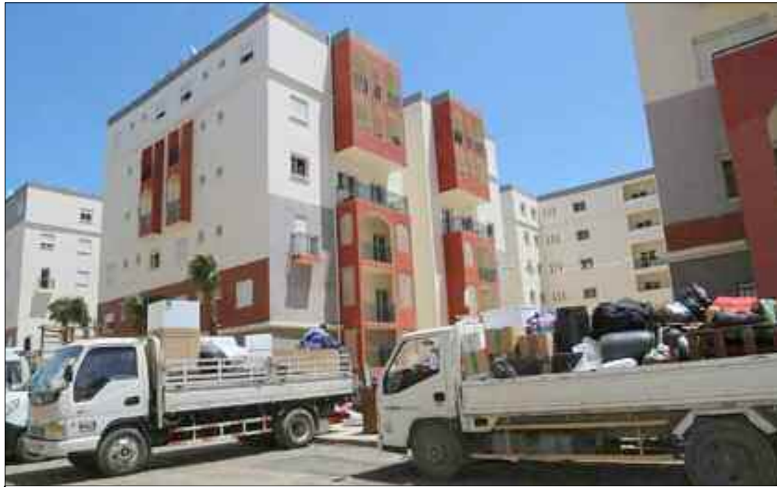
■ Les capacités des démunies ne sont pas seulement sous-estimées, elles sont étouffées par la réglementation à l'origine de la sous-estimation et le manque de terres constructibles.

Il a été également question de parcelles de taille suffisante pour les investissements afin de minimiser les risques d'incendie. Les mêmes intervenants ont souligné la nécessité d'octroi aux nouveaux propriétaires de parcelles de terrains aux investisseurs devant bénéficier d'une assurance