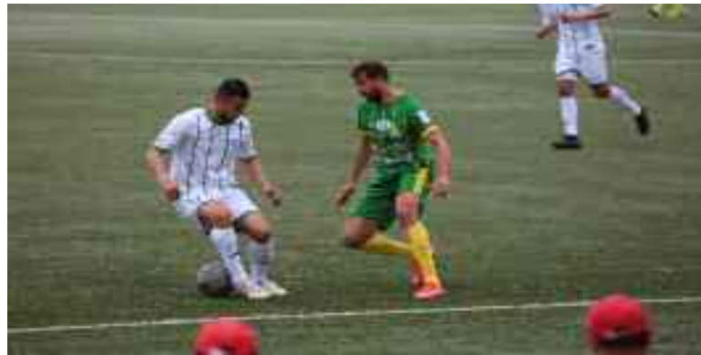
La JSK stoppée nette par Biskra.

Dans la capitale du «Titteri», le NC Magra, auréolé de sa qualification en finale de la Coupe de la Ligue 1, aux dépens de l'USM