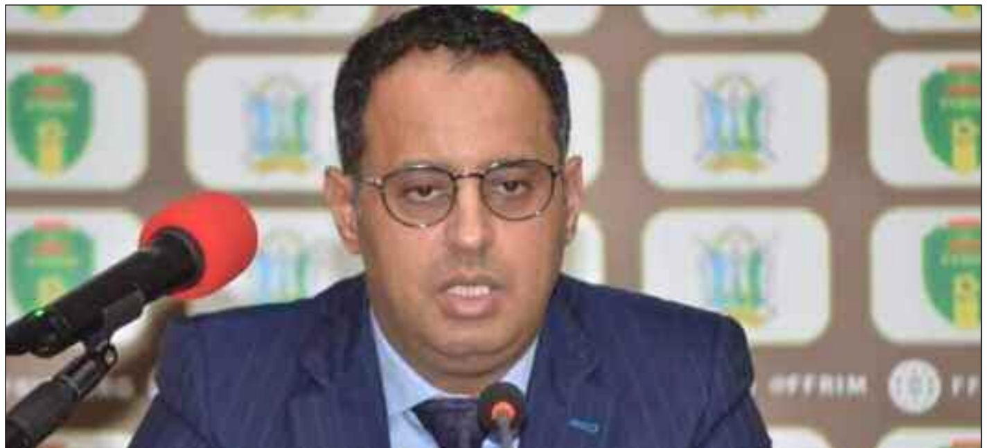
■ Ahmed Yahya, 2 e vice-président de la CAF.

→ C'est la thématique qui vient de réunir autour d'une table ronde virtuelle à l'initiative de la CAF, les experts de la FIFA, l'AFC, l'UEFA, l'OFC et de la Concaf et avec la participation des associations membres de la Confédération africaine de football.