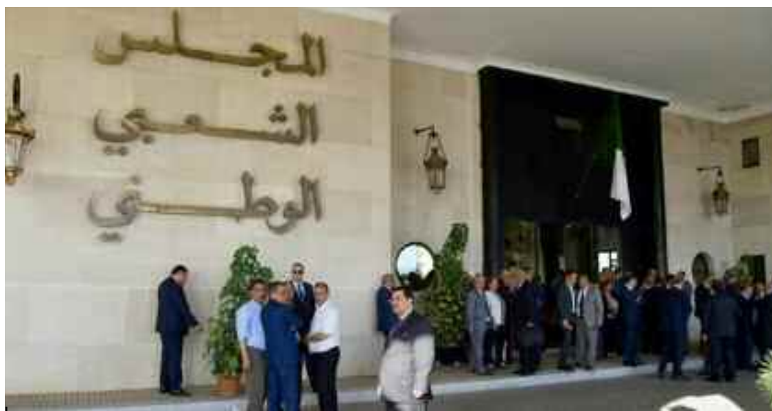
■ Il restera à l'APN, élue dans un scrutin incontestablement régulier, sans bavures, à conforter sa légitimité en étant réellement au service des électeurs et de la population.