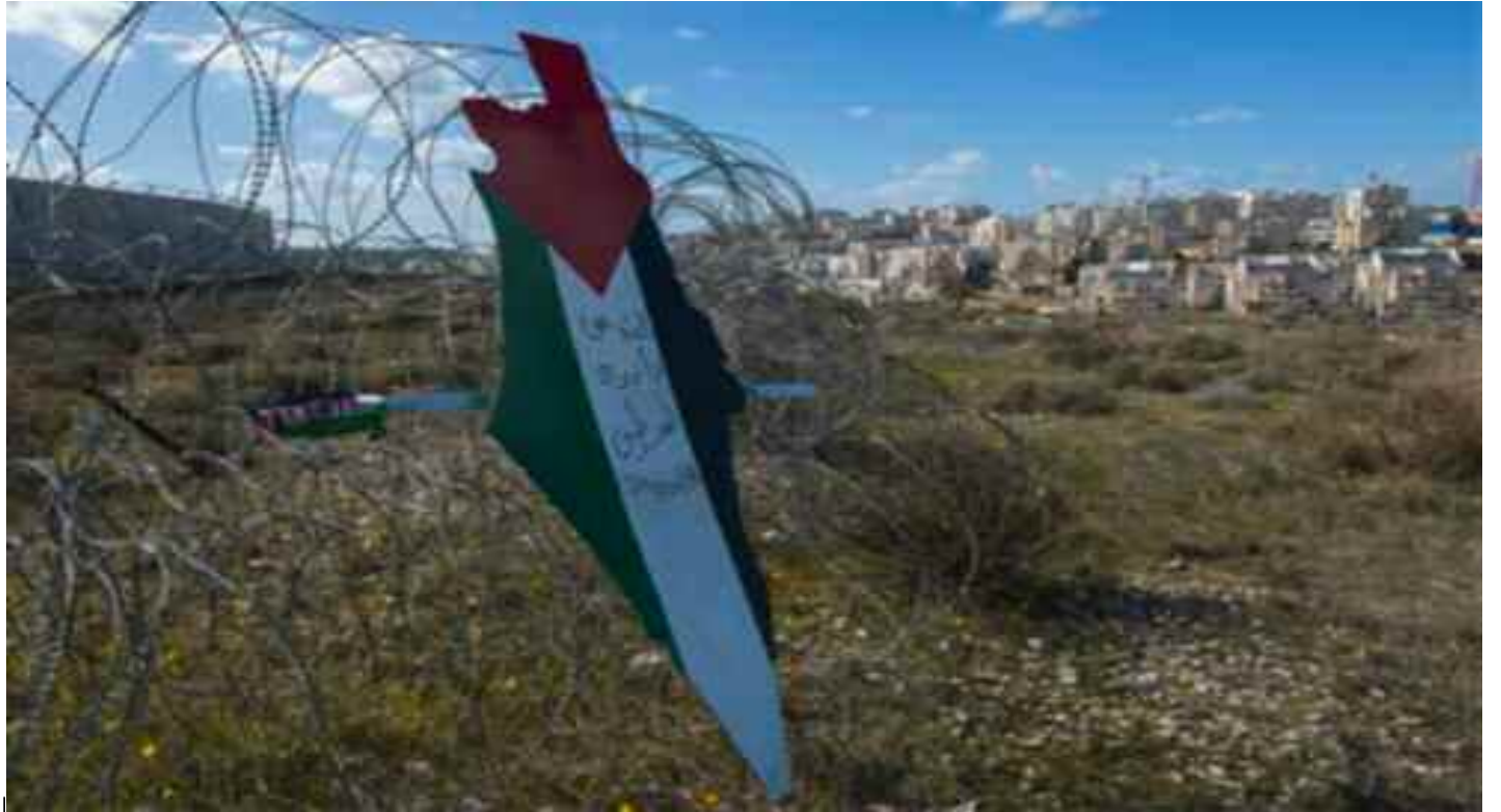
■ M. Aboul-Gheit a exprimé son espoir de voir une «position européenne plus unie et plus cohérente concernant les droits des Palestiniens».

Ces bombardements menés par les avions de guerre de l'occupant sioniste sur la bande de Ghaza sont les pre-