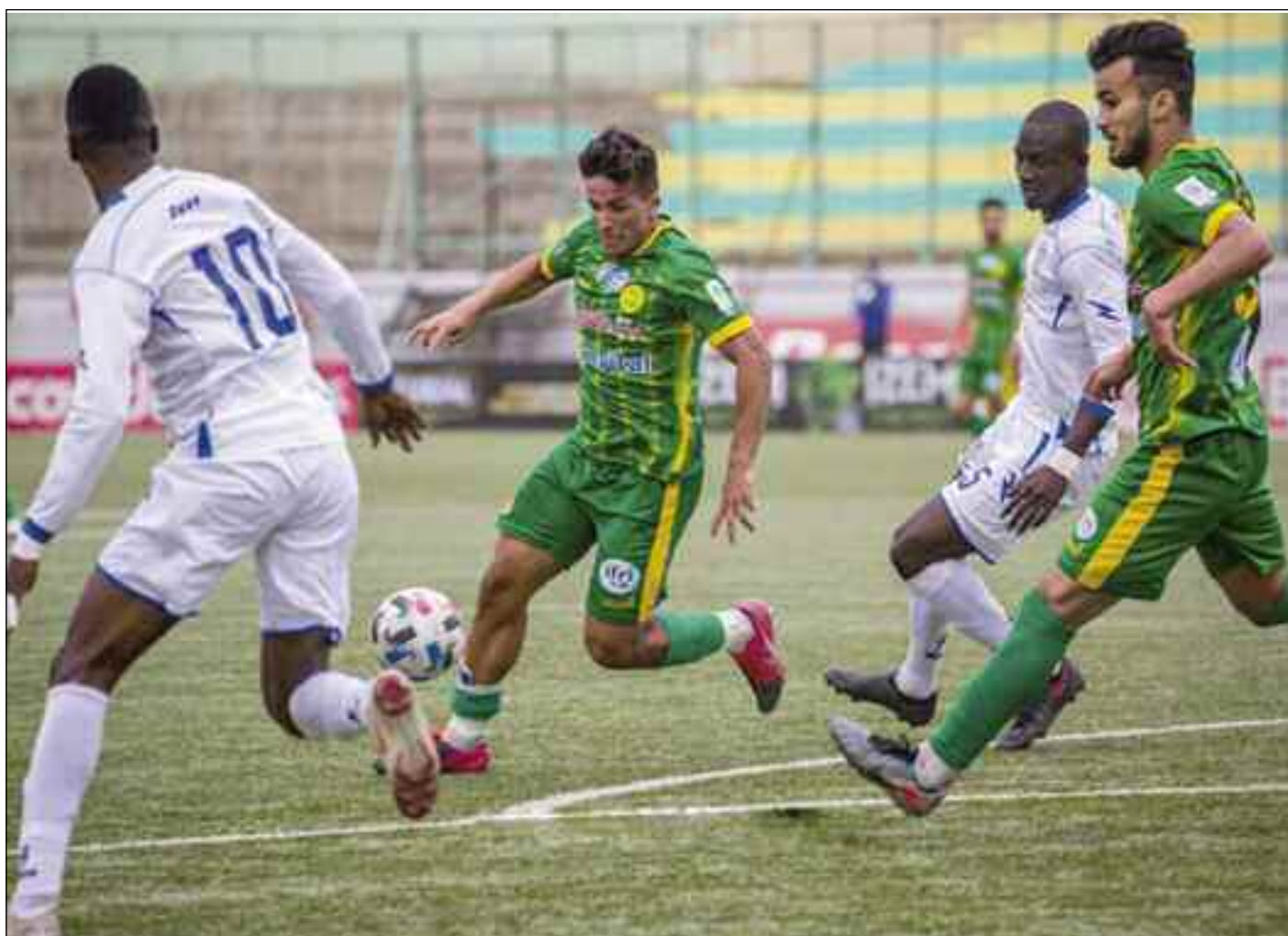
■ La JSK bien partie pour jouer la finale.

La JSK, la seule et unique rescapée des compétitions africaines, continue de s'accrocher et est rentrée ce dimanche du Cameroun avec une belle récolte 2-1. Une semaine avant le match retour, c'est un résultat qui permet à la JSK de mettre un pied en finale de la Coupe de la CAF. Pas question de lâcher toutes les cartes en sa possession qui lui donneraient le droit de jouer sa première finale continentale depuis 2002. Les joueurs savent comme tous les acteurs professionnels qu'une demi-finale est presque une finale avant l'heure, débiter surtout une compétition de cette envergure, entrer dans le tournoi d'une manière différente que celle des championnats est déterminante pour la suite. Ce sont plusieurs émotions qui se croisent en même temps, d'abord pour les joueurs qui n'ont jamais vécu de pareilles confrontations, et ensuite pour les fans, veiller surtout à leur livrer une meilleure prestation et surtout marquer des buts. Peut-être aussi de leur avoir imposé le statut de favoris... une occasion de se mettre en valeur, la victoire est indispensable, une victoire puisque promise avant le coup d'envoi. Dans ce type de match, prendre un but c'est courir automatiquement vers une égalisation tout en veillant à ne pas en prendre un second qui serait fatale pour la suite de la partie. Le but situé à la 30' inscrit par Araina était un but qui était, il faut le dire, positif pour la suite de la partie puisqu'il a permis aux acteurs du sélectionneur français de corriger la stra-