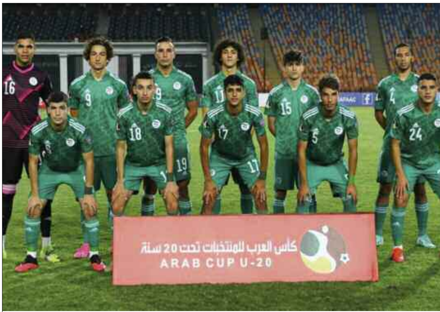
■ Les Algériens euphoriques face aux Marocains.

C'était un match très animé, où chacune des équipes voulaient faire chavirer l'autre. Cela n'est étranger pour personne puisque dans les annales de l'histoire du football maghrébin, il est connu que les derbys entre le Maroc et l'Algérie ne laissent personne indifférent. Ils ont de tout temps suscité un intérêt exceptionnel, puisque souvent des rencontres, qui fonctionnent bien, produisent du spectacle, du suspens mais aussi de la concurrence entre les internationaux qui restent des stars que tout le monde aimerait voir. Mais ce mardi, c'est un autre spectacle où il fallait s'accrocher pour avoir son billet aux quarts de finale chez les moins de 20 ans. Les Algériens étaient dominés sans pour autant se laisser abattre grâce au collectif qui a dominé l'individualité. Le but était en somme une provocation qui mit le feu chez les Verts qui n'avaient