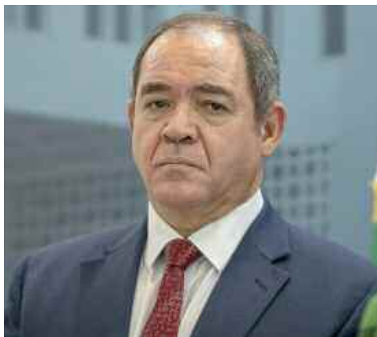
■ Les membres du G20 doivent adhérer à l'ouverture et à l'inclusivité, viser une coopération gagnant-gagnant et s'opposer aux jeux à somme nulle.

De son côté, le Conseiller d'Etat et ministre des Affaires étrangères de la Chine, Wang Yi, a appelé mardi, par liaison vidéo à Beijing,