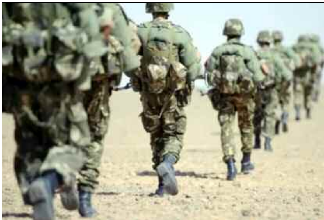
■ Malgré les efforts de nos forces de sécurité, le peuple doit également apporter son concours afin d'annihiler toute tentative de ses hordes sauvages de nuire à la sérénité et la sécurité du pays.

Si la menace venant de nos frontières demeure toujours inquiétante, les sanguinaires pourraient frapper à n'importe quel moment et à n'importe quel endroit à l'in-