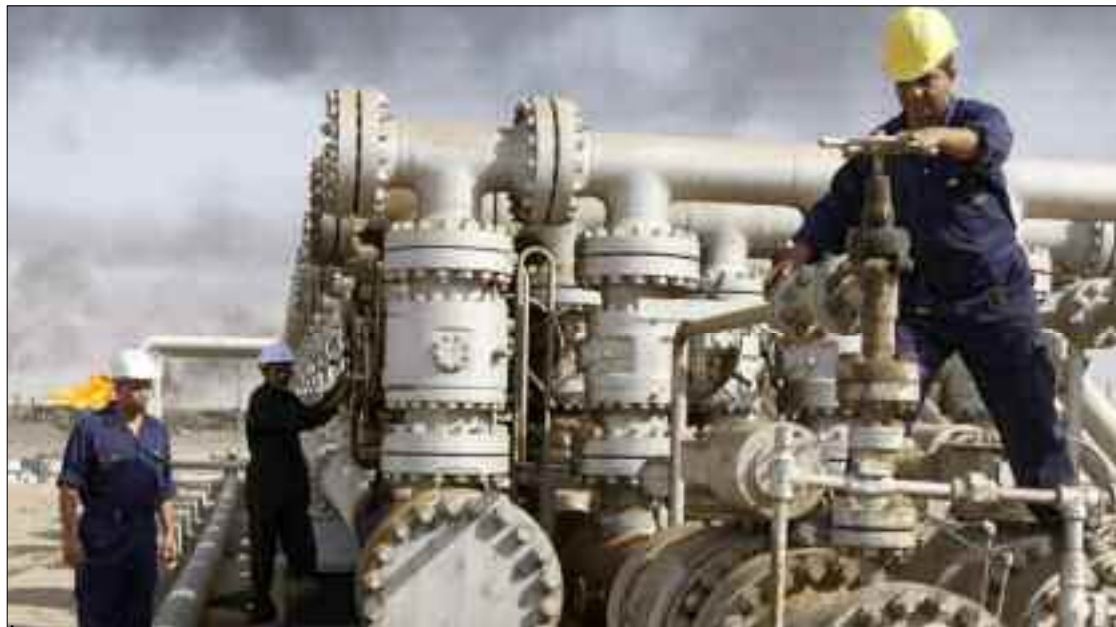
■ En dépit de l'impact négatif de la crise sanitaire, «les efforts déployés par Sonatrach ont permis d'atteindre des résultats positifs».

L'investissement de Sonatrach a atteint 5,7 milliards de dollars équivalents, en baisse de 30% par rapport à 2019. La fiscalité versée à l'Etat s'est élevée, quant à elle, à 1.853 milliards DA, en baisse de 31% par rapport à 2019. En dépit de l'impact négatif de la