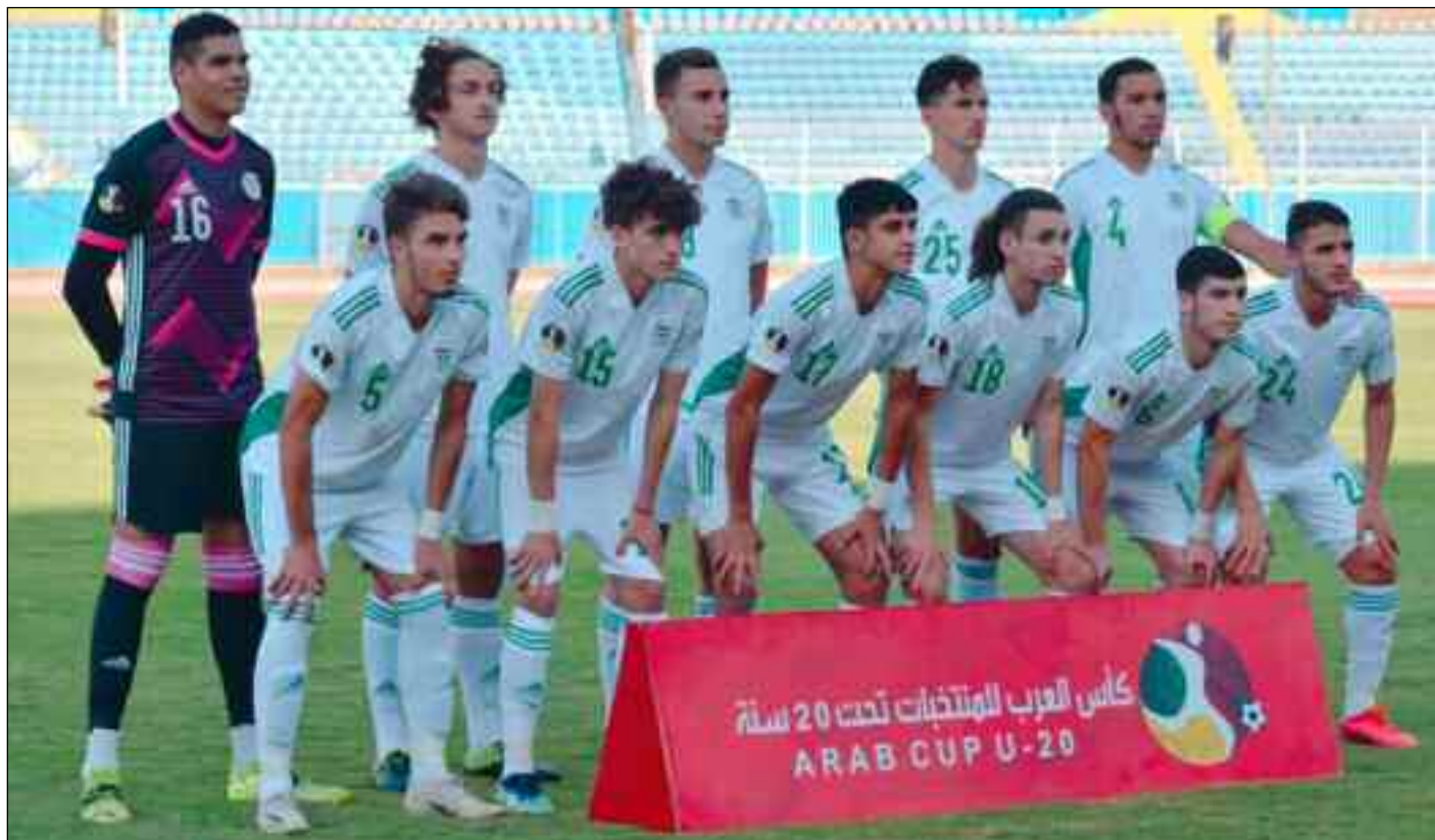
■ Les Verts s'inclinent, la tête haute.

Les hommes de Lacette, sélectionneur des Verts, savaient qu'ils avaient affaire à une équipe solide, l'Arabie Saoudite. Une coriace équipe qui a éliminé l'Égypte, un des favoris de l'épreuve. C'est une formation très technique qui a beaucoup de caractère et habituée aux grandes chaleurs. Malgré ces conditions, ils avaient la possibilité de plier le match et de remporter le trophée, si ce n'est l'excès de précipitation et la désorganisation de la défense qui n'arrivait pas à se re-