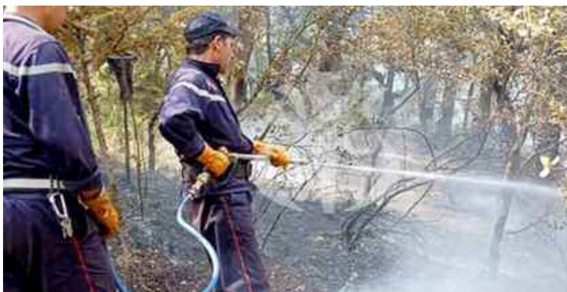
La Gendarmerie nationale est toujours sur les lieux des incendies afin de poursuivre les investigations et les recherches, en vue de déterminer leurs causes exactes et arrêter les suspects impliqués dans cet acte criminel.

Tous les moyens logistiques et humains nécessaires, a poursuivi Ali Mahmoudi, étaient mobilisés. «La Conservation des forêts de Khenchela est renforcée par cinq colonnes mobiles des wilayas voisines avec un total de plus de 200 agents dotés de 90 véhicules et de camions-citernes, et qui contribuent aux côtés des agents de la Protection civile, des travailleurs