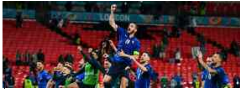
■ Les Italiens rêvent d'un second titre, après 1968...

Par Federico Chiesa en première lame (60'), puis via un arrêt de son immense gardien Gianligi Donnarumma, devant Alvaro Morata au bout d'une séance de