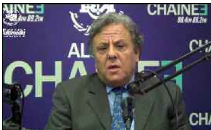
«Si le vaccin peut causer des effets secondaires plus ou moins gênants, ces derniers ne menacent pas votre vie, la contraction du virus tue».

Le variant Delta du Coronavirus est bel et bien installé dans notre pays et promet le pire des scénarios si le relâchement persiste. En effet, ce sont plus d'une trentaine de cas confirmés du nouveau variant qui se sont enregistrés à Alger cette semaine. Le nombre de contaminations en général s'approche d'une moyenne journalière de 500 cas et dix décès, toutes tranches d'âge confondues. Le personnel du secteur de la santé ne cesse de lancer des appels de détresse en direction des autorités compétentes pour le retour aux mesures «sérieuses» pour freiner la chaîne de contamination et éviter un désastre. Il s'agit, entre autres, de revoir la décision de réouverture des frontières, le