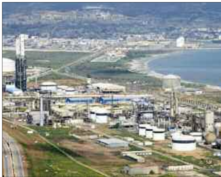
Il est également question de finalisation des travaux de l'unité de production d'azote, d'un coût de 5 millions USD.

Pour cette année 2021, Sorfert projette ainsi dépasser le chiffre d'affaires des années précédentes, situé entre 450 et 500 millions USD, tablant sur une recette d'exportations se situant entre 550 et 600 millions USD. Au programme de ces projets liés au développement de la Pétrochimie, il est envisagé des négociations avec des sociétés étrangères pour le lancement de mégaprojets. Ce qui confirme l'information que la