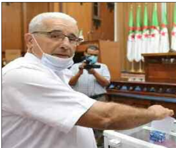
■ Sur les 24,4 millions d'inscrits sur le fichier électoral, seulement 5,6 millions ont voté dont plus de 1 million de bulletins nuls et 4,6 millions de voix exprimées.

Brahim Boughali est né le 3 mars 1963 A Beni Yezguene dans la wilaya de Ghardaïa, marié et père de 4 enfants. Il est titulaire d'une licence en science politiques et relations internationales à l'Université d'Alger promotion 1986. Considéré comme l'un des artisans de la réconciliation durant les événements de Ghardaïa, le nouveau président de l'APN a occupé plusieurs postes dont le dernier en date, juillet 2020, prési-