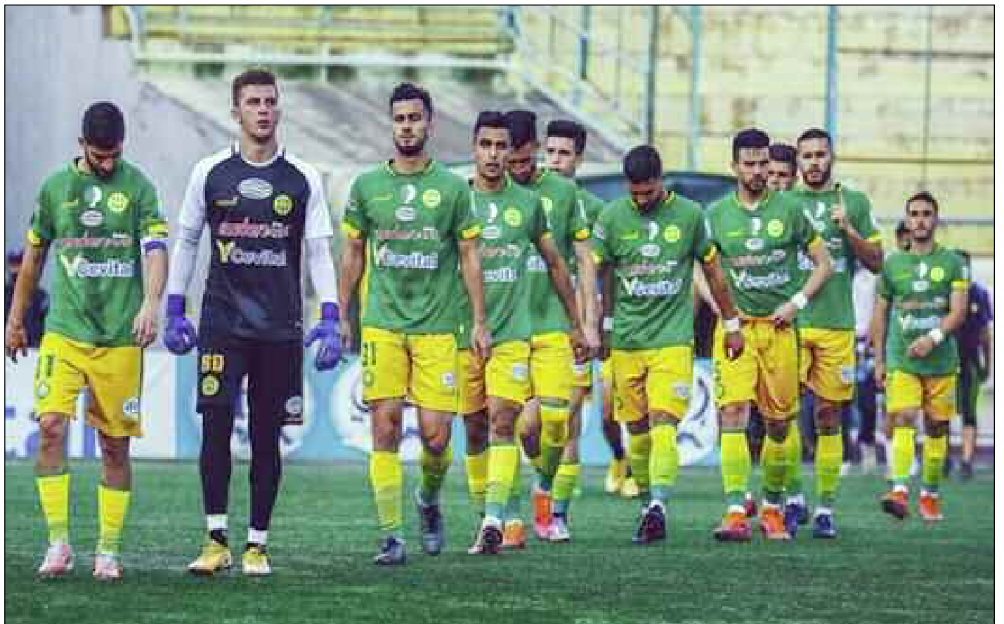
■ Les Canaris veulent revenir avec le trophée.

Pour le porte-parole de la JSK Mouloud Iboud : «C'est le moment de vivre notre