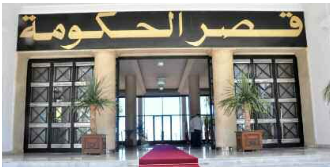
Les partis politiques qui ont eu le plus de sièges aux élections du 12 juin dernier ainsi que les indépendants ont leurs représentants dans ce Gouvernement.

pour affiner encore plus la composition de ce Gouvernement. Le Président Tebboune a chargé Aymene Benabderrahmane du secteur des Finances, ce qui constitue une marque évidente de confiance dans le Premier ministre et une indication sur le souci d'une gestion rigoureuse des finances du pays dominant