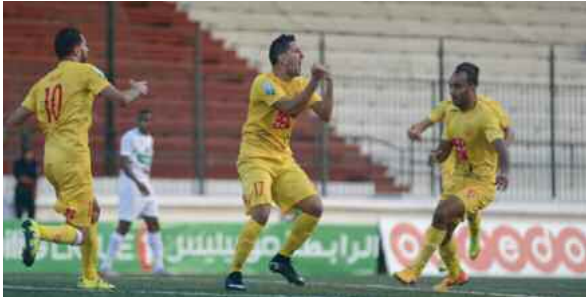
Le NAHD et le RCR ont réussi à s'extirper de la zone de relégation.

Même score de parité (1-1), dans l'opposition entre le troisième du classement, la JS Saoura (54 pts) et le quatrième le MC Oran (50 pts). La JSS a ouvert le score en fin de première mi-