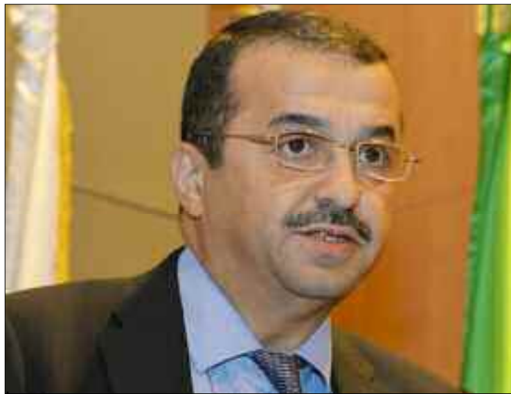
■ Le ministre de l'Énergie et des Mines, Mohamed Arkab ne cesse de réitérer depuis des mois l'impératif de relancer et de développer l'industrie pétrolière.

Ainsi faire face aux priorités du développement pour améliorer la durabilité et l'efficacité énergétique, ce qui requiert une bonne gouvernance et coordination entre les différents secteurs et leurs départements. C'est l'objectif du ministère de tutelle qui s'emploie depuis des mois à la mise en œuvre d'une gestion efficiente des ressources énergétiques, foncières, et des dépenses à travers la mutualisation des moyens afin de créer des partenariats plus novateurs et nécessaires pour accélérer la transition énergétique. C'est surtout une urgence économique pour faire face aux effets de la crise sanitaire et pétrolière qui s'annonce. Le ministre de l'Énergie et des Mines, Mohamed Arkab ne cesse de réitérer depuis des mois l'impératif de relancer et de développer l'industrie pétrolière, en l'occurrence, pétrochimique indispensable pour diversifier les ressources financières, mais surtout libérer le pays de sa dépendance à l'importation, entre autres, des carburants. Quelques jours seulement après sa reconduction à la tête de ce ministère par le nouveau Premier ministre, Aymene Benabderrahmane, Mohamed Arkab s'est réuni avec les cadres du secteur pour évaluer la situation actuelle de son secteur et discuter des défis énergétiques à relever, selon un communiqué de son département, publié jeudi dernier.