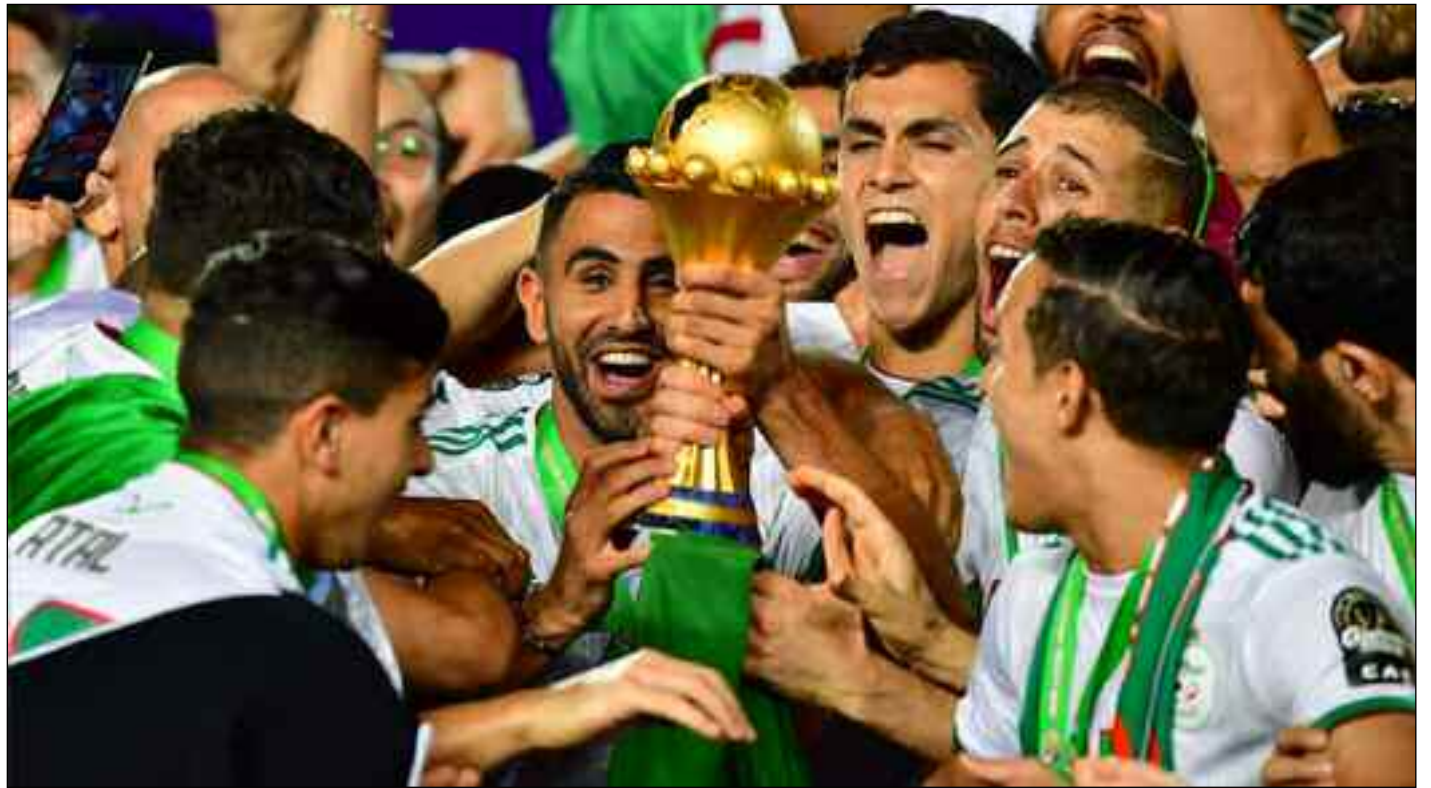
■ Difficile de battre les champions d'Afrique 2019.

→ Inchavirable depuis près de trois ans, l'Italie a regimé à toutes les stratégies adverses. Elle n'a perdu aucun de ses 34 derniers matches qu'elle a disputés. La sélection, tout juste championne d'Europe, pourrait rapidement égaler puis transcender le record ultime de matches d'affilée sans revers, co-détenu par l'Espagne et le Brésil.