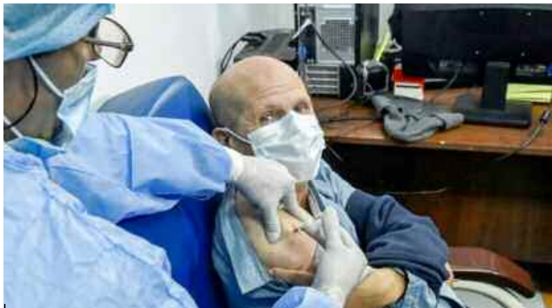
Le ministère de l'Industrie pharmaceutique a mis en place un Comité de veille et de suivi de la disponibilité de l'oxygène médical et l'approvisionnement des établissements hospitaliers, en coordination avec les secteurs concernés.