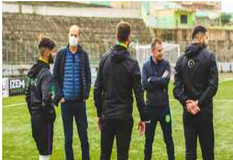
La JSK et Lavagne veulent le trophée.