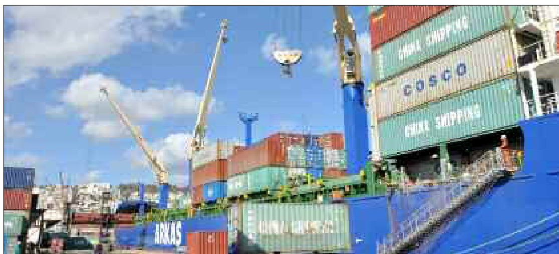
■ Réussir la transition économique sans le progrès numérique et la restructuration des administrations et entreprises économiques est quasi-impossible.

L'Etat veut désormais asseoir une économie solidaire, inclusive et résiliente, ce qui nécessite une véritable planification stratégique et l'initiation de réformes pro-