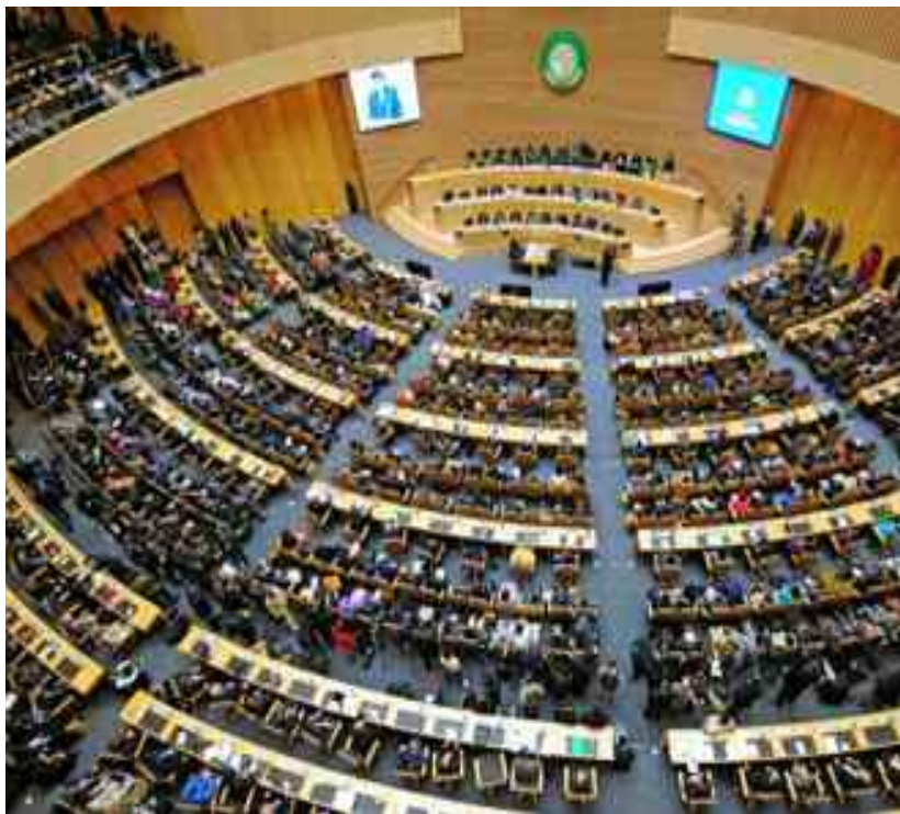
■ L'Union africaine accorde à l'entité sioniste le statut d'observateur.

tervient après celle exprimée, mercredi, par l'Afrique du Sud dont le gouvernement s'est dit «consterné» par la décision de la Commission de l'Union africaine d'accorder à l'entité sioniste le statut d'observateur au-