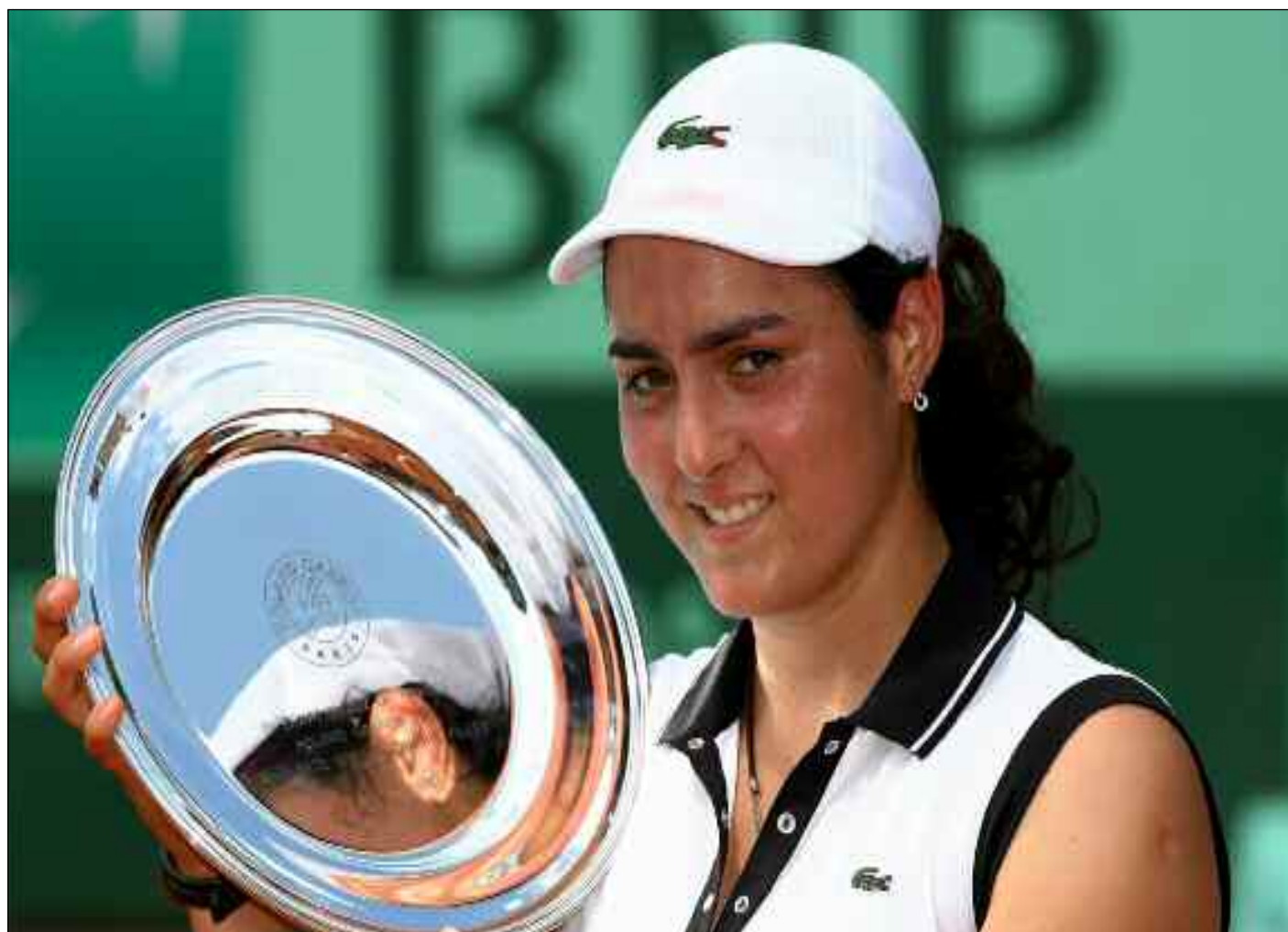
■ La Tunisienne Jabeur, première joueuse africaine à gagner un tournoi du Grand Chelem.

Il est connu que tous les records du monde de course en 5 000, 10 000 et 20 000 mètres féminins et masculins sont détenus par des Éthiopiens et ceux des ma-