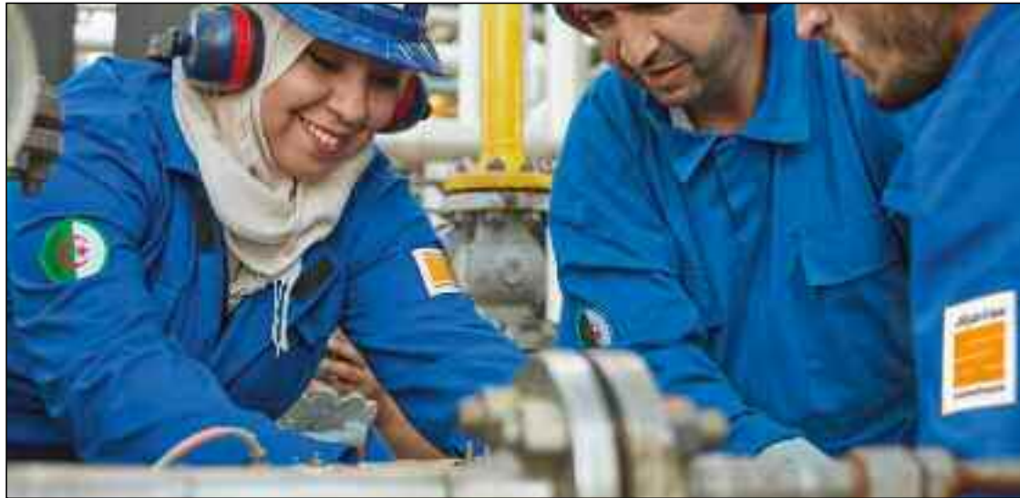
■ L'aggravation du stress hydrique, surtout cette année, tend vers la construction de nouvelles unités de dessalement d'eau de mer pour sécuriser l'approvisionnement des populations.

Sur les treize grandes stations projetées, seulement onze seront réalisées. Les partenaires étrangers seront propriétaires d'au moins la moitié des parts des stations construites. Un peu plus de trois milliards de dollars seront mobilisés pour financer la construction de ces stations dotées d'une capacité de production de 2,1 millions de m 3 d'eau potable, soit près de 750 millions de m 3 annuellement. De quoi répondre aux besoins d'une population de huit millions d'habitants. Treize ans après la mise en service de la première station, celle du Hamma à Alger, le bilan est tout de même mitigé. La plus grande station au monde, celle d'El-Mactaa à Oran, dotée d'une capacité de 500.000 m 3 d'eau, ne fonctionne actuellement qu'à 50% de ses capacités.