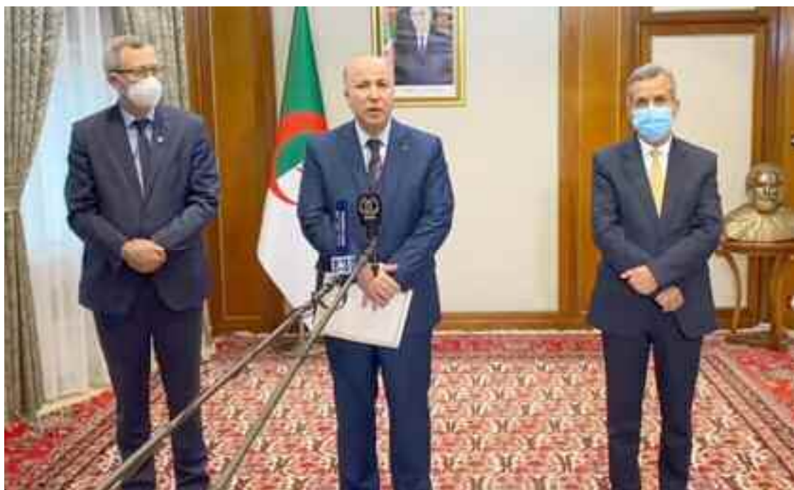
■ Affectation des structures hôtelières à la lutte anti-Covid-19 en leur fournissant les quantités d'oxygène nécessaires, afin de mieux prendre en charge les malades.

30.000 et 40.000 litres à répartir sur les grands établissements hospitaliers, ce qui permettra