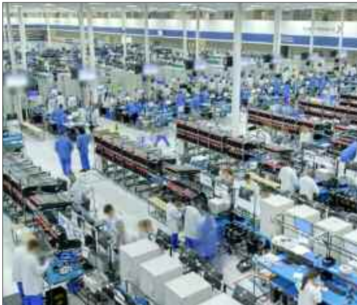
Le ministre de l'Industrie a promis d'accompagner ces entreprises dans l'exécution de leur nouvelle stratégie de sortie de crise.

Au cours de la semaine écoulée, le ministre de l'Industrie, Ahmed Zeghdar, s'est entretenu à Alger avec plusieurs responsables de groupes industriels publics en vue d'examiner et mesurer l'ampleur des déséquilibres structurels et financiers qui menacent leur pérennité et par conséquent l'intégrité du marché local faisant planer une profonde incertitude sur une éventuelle crise sociale majeure. Lors de ces rencontres exceptionnelles, le ministre a évoqué «la situation des Groupes industriels publics et les problèmes rencontrés par certaines filiales», selon le communiqué du ministère. L'essentiel de ces rencontres était la mise en place d'un plan de secours adéquat avec la situation de chaque entreprise. Écouter,