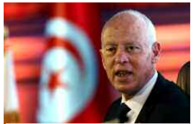
■ Le Président tunisien Kaïs Saïed en lutte contre les élites.