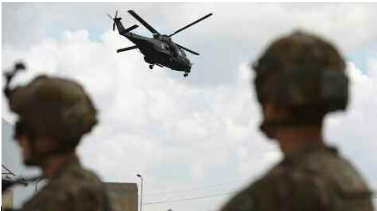
■ L'accord Bagdad-Washington prévoit de restreindre le rôle des Etats-Unis à des missions de consultation et d'entraînement.