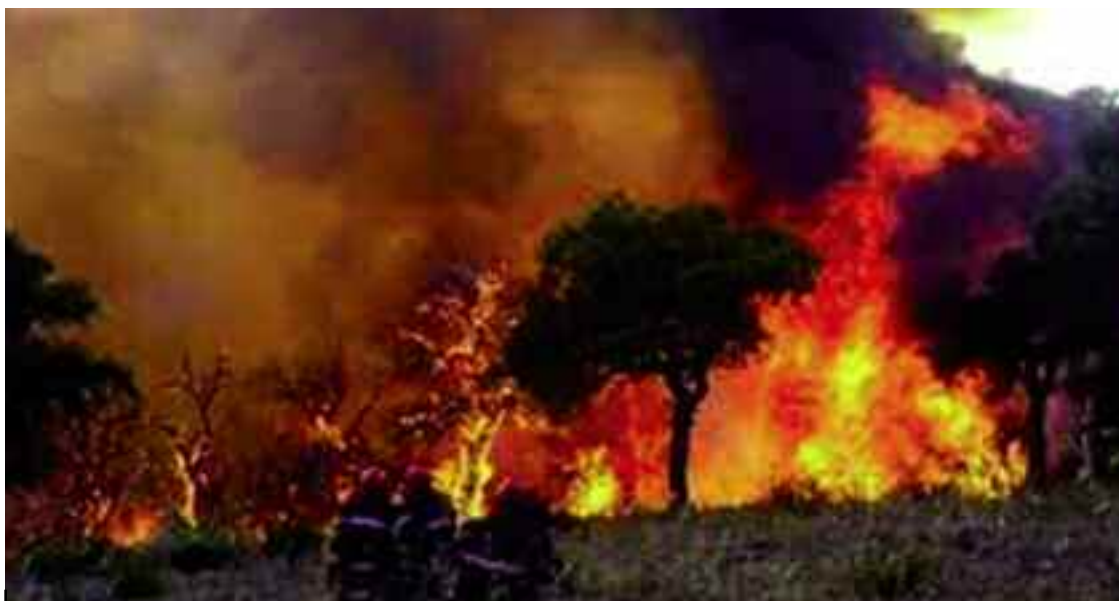
■ Une grande panique s'est emparée de nombreux citoyens à cause des flammes qui ont cerné leurs villages, et le spectacle terrifiant des gigantesques colonnes de feux et de fumées montant vers le ciel.