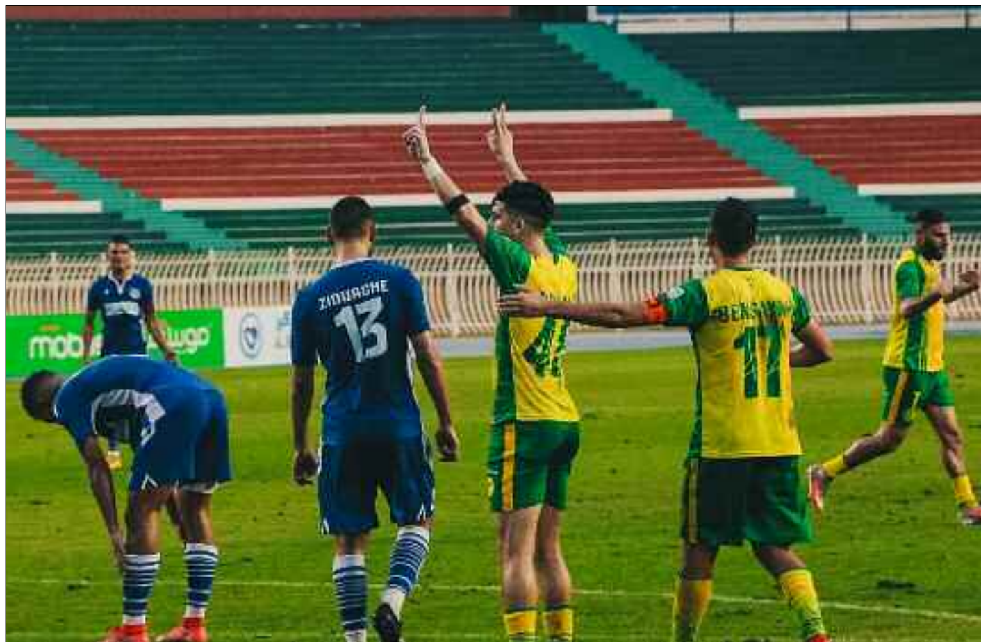
■ La JSK renoue avec les trophées.

Le moral au football n'est pas au beau fixe, mais il fallait que cette coupe, tant attendue, se joue à huis clos, pas que, mais également sans aucune retransmission de la rencontre. «Non, nous n'avons pas le cœur à suivre cette rencontre... que la JSK gagne ou perde, je m'en F... Ce qui me préoccupe, ce sont d'abord nos vies, nos maisons, nos biens... Tout est partie en fumée. La Kabylie est en feux». Un autre supporter de la JSK, «non, s'il vous plaît, ce qui se passe est criminel, c'est bien programmé et nous n'avons hélas pas le cœur à suivre la rencontre, dommage, mais hélas il y a ce qui passe bien avant le football» Un chauffeur de camion-citerne «je me dirige vers Béjaïa où yemma Gouraya est en feux. Je ne sais pas si