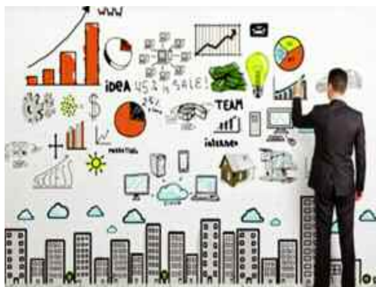
■ En 2020, l'Algérie a créé un Fonds de financement des Start-ups qui «repose sur l'investissement dans le capital et non sur les mécanismes de financement classiques basés sur le crédit»

L'écosystème entrepreneurial algérien est encore fragile, mais il est sur la bonne voie. Il se compose, particulièrement, de startups, de porteurs de projets et d'incubateurs que les pouvoirs publics tentent de renforcer à travers la création de nouvelles structures innovantes dédiées aux start-up.