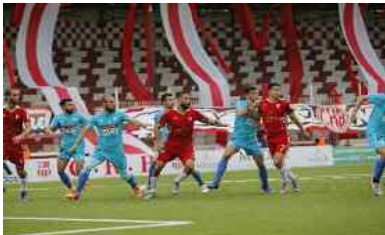
Le CRB et l'ESS termineront sur le podium.