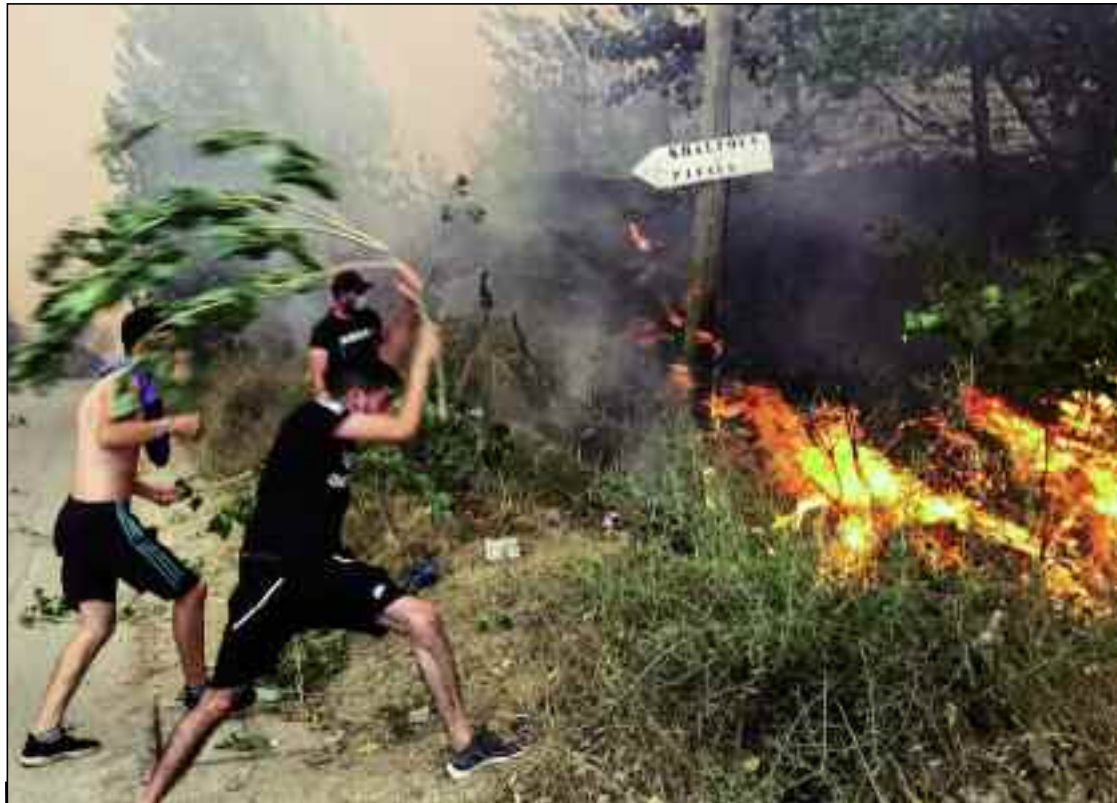
■ Ces deux à trois dernières années, l'Algérie fait face à de violents incendies durant la saison estivale. Ce phénomène ne touche pas seulement notre pays.

Tous les moyens de la Protection civile de toutes les wilayas du Centre du pays, y compris de la capitale, ne peuvent venir rapidement à bout d'un tel nombre d'incendies dans une vaste région montagneuse et de surcroît, très peuplée. D'où l'intervention de l'Armée nationale populaire. Les militaires ne sont pas entraînés, à l'exemple de la Protection civile et des Gardes-forestiers à éteindre