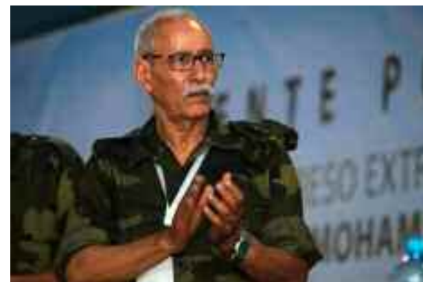
■ Brahim Ghali, président de la RASD.