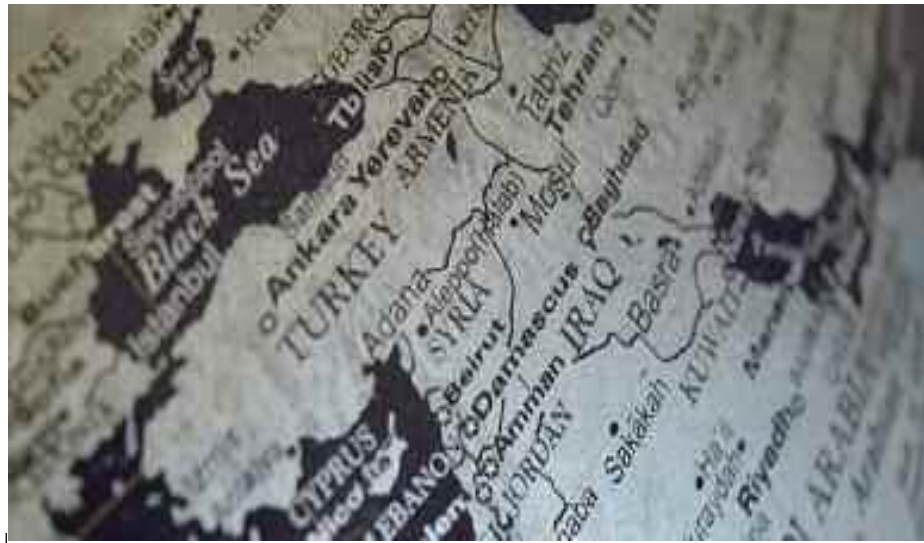
Les services de renseignement occidentaux ont formé les leaders de l'opposition syrienne.

Des services de renseignement occidentaux, financés par les gouvernements, ont formé des leaders de l'opposition syrienne, publié des articles dans des médias allant de la BBC à Al Jazeera et dirigé un groupe de journalistes. Une foule de documents ont été divulgués, révélant ce réseau de propagande. Des documents ayant fait l'objet d'une fuite montrent comment des sous-traitants du gouvernement britannique ont développé une infrastructure de propagande avancée pour assurer le soutien de l'Occident à l'opposition politique et armée de la Syrie.