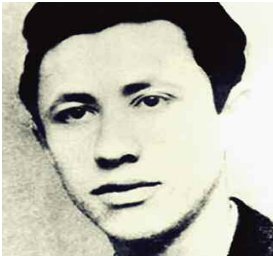
■ Le Chahid Mohamed Belouizdad.

Les médias de la France coloniale, en Algérie et en ladite «métropole», la presse internationale témoignent, en ce 1er novembre 1954 de l'écho assourdissant de ces actions. Des actions armées étonnamment osées contre une puissance qui vient certes de subir le cuisant Dien Bien Phu, mais qui, de ce fait se promet de prendre sa revanche en ne se laissant plus faire dans la défense de la Grande France dont la République impériale l'a chargée... Les journaux colonialistes, cartes à l'appui, font le bilan de leur «nuit de la Toussaint» : des actions limitées, et «sporadiques», pas de quoi fouetter un chat, mais quand même un «crime odieux», dans les Aurès, commis par des bandits contre la Culture, contre un instituteur qui rejoignait avec sa femme son poste d'instituteur à Arris ! Cependant, une appréciation plus proche de la réalité du bilan de l'ennemi