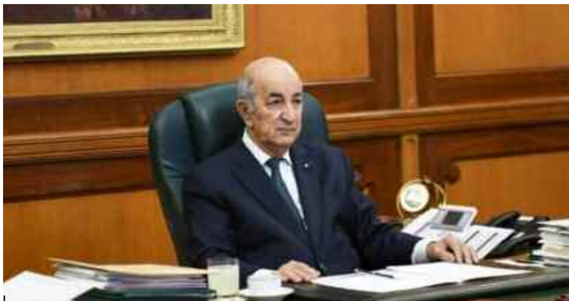
■ Pour maîtriser ces flammes «que le pays n'a pas connus depuis des décennies», des moyens matériels et humains ainsi que des engins de transport et d'extinction colossaux ont été mobilisés au niveau de plusieurs wilayas.

Dans son allocution adressée jeudi soir au peuple algérien, dans le contexte marqué par les circonstances rudes et tragiques du fait des feux dévastateurs déclenchés simultanément dans 17 wilayas du pays, et qui touchent particulièrement la wilaya de Tizi Ouzou, le Président Abdelmadjid Tebboune a appelé à éviter de tomber dans le piège de deux organisations terroristes qui tentent de porter atteinte à l'unité nationale, faisant allusion directement au MAK et à Rachad qui entretiennent au sein de la population un climat de haine, sur la base d'idéologies identitaires.