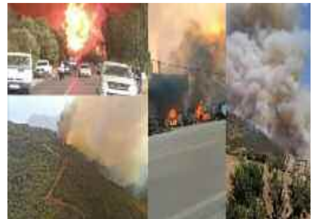
■ Le bilan des feux de forêts s'alourdit à 65 morts en Algérie.