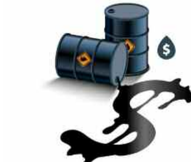
■ Avant le léger rebond des cours jeudi dernier, le baril de Brent a perdu 6% et jusqu'à près de 8%, la semaine dernière.

Au lendemain de cet avertissement de Washington sur l'impact de l'offre limitée sur la reprise économique, l'Agence internationale de l'Energie (AIE) a revu ses prévisions de la demande pour cette année à la baisse estimant que «les perspectives de la demande de pétrole sont mitigées». De leur côté, des analystes européens prévoient une hausse de la demande face à une offre très limitée, sans pour autant recommander une augmentation de la