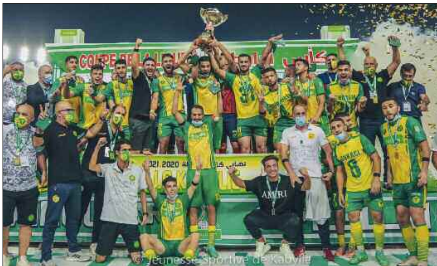
■ Un trophée dans la douleur.

→ A l'issue de la 35 e journée du championnat de Ligue 1, le CR Belouizdad et l'Entente de Sétif s'embarquent pour la nouvelle édition de la Ligue des Champions africaine de football, la JS Saoura, quant à elle, décroche un des deux billets qualificatifs pour la coupe de la Confédération et tout comme la JS Kabylie estampille son deuxième ticket qualificatif.