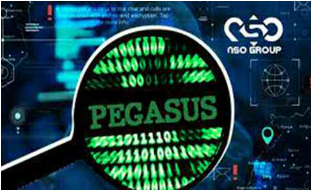
■ L'ONU réclame une réglementation internationale plus stricte des technologies de surveillance de masse.

A la mi-juillet, une enquête, publiée par un consortium de 17 médias internationaux, a révélé que le logiciel Pegasus, conçu par l'entreprise israélienne NSO Group et utilisé par le Maroc qui est fortement impliqué dans cette affaire, aurait permis d'espionner les numéros d'au moins 180 journalistes, 600 hommes et femmes politiques, 85 militants des droits humains ou encore 65 chefs d'entreprise de différents pays.