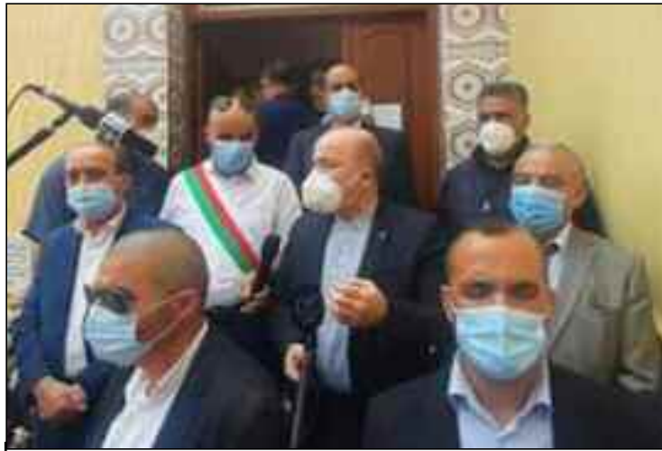
■ Benabderahmane: «Le fonds spécial qui a été créé devra prendre en charge toutes les victimes et garantir leurs droits».

S'exprimant lors d'une visite à Tizi Ouzou, le Premier ministre, accompagné d'une importante délégation, pour s'enquérir de la situation dans cette wilaya en proie depuis lundi dernier à des incendies ravageurs, ayant fait 69 morts, entre civils et militaires, a assuré que les indemnités concerneront toutes les régions sinistrées, région par région. «Le fonds spécial qui a été créé devra prendre en charge toutes les victimes et garantir leurs droits», a-