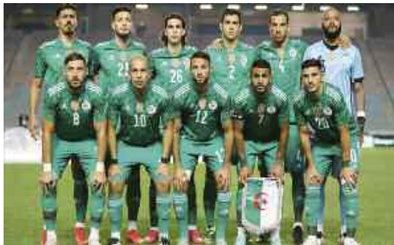
Les Verts reprendront l'aventure à Marrakech.

Cette rencontre a été délocalisée en raison de la suspension par la Confédération africaine de football (CAF) du stade 4-Août de Ouagadougou pour «non-conformité». Les «Verts» entameront ces éliminatoires à domicile, en affrontant Djibouti le jeudi 2 septembre au stade Mustapha-Tchaker de Blida, précise la même source. Le Niger est l'autre