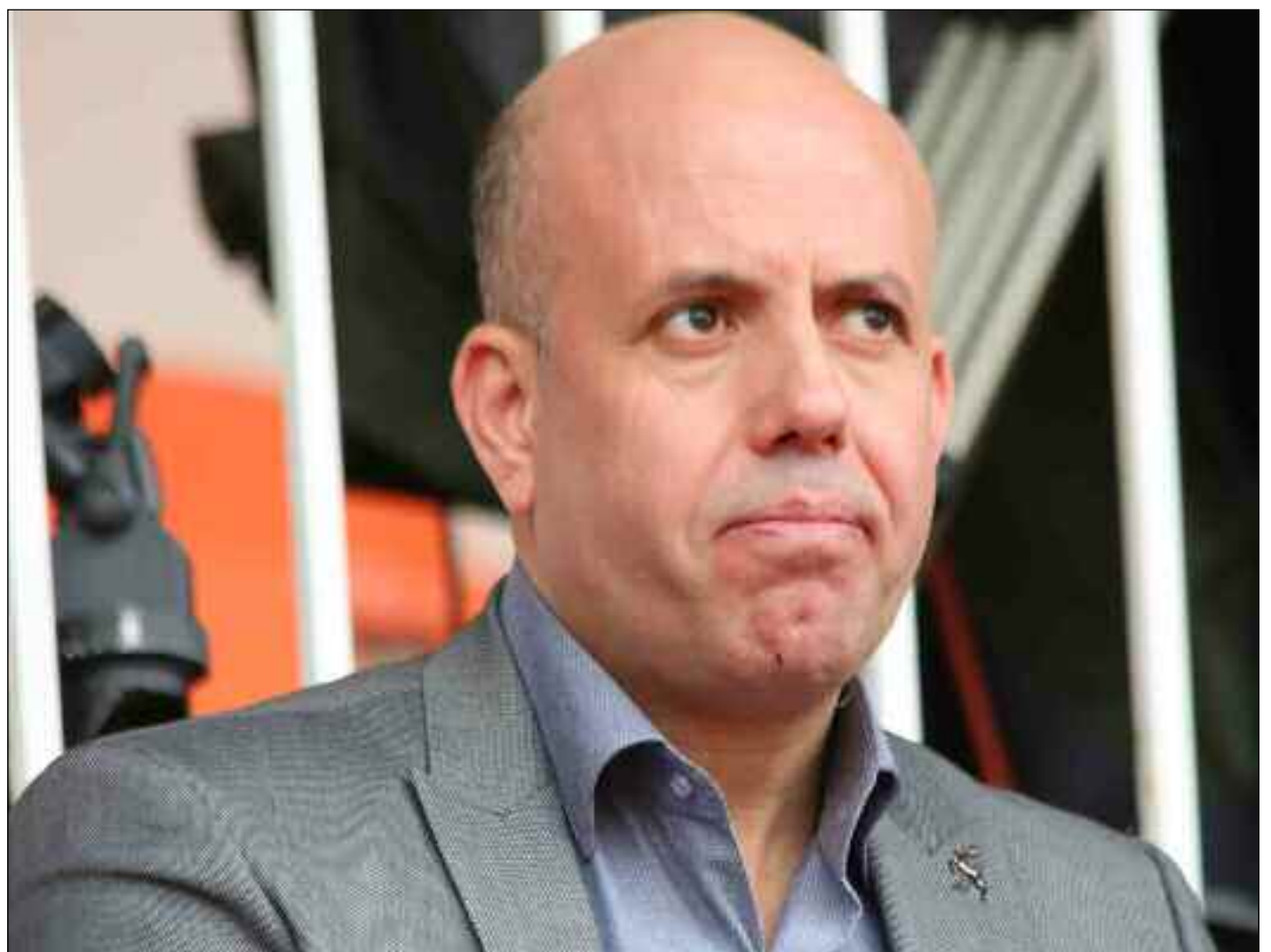
■ Mellal sûr de lui.

S'agissant de la pétition qui a fait le tour des espaces publiques, Mellal explique