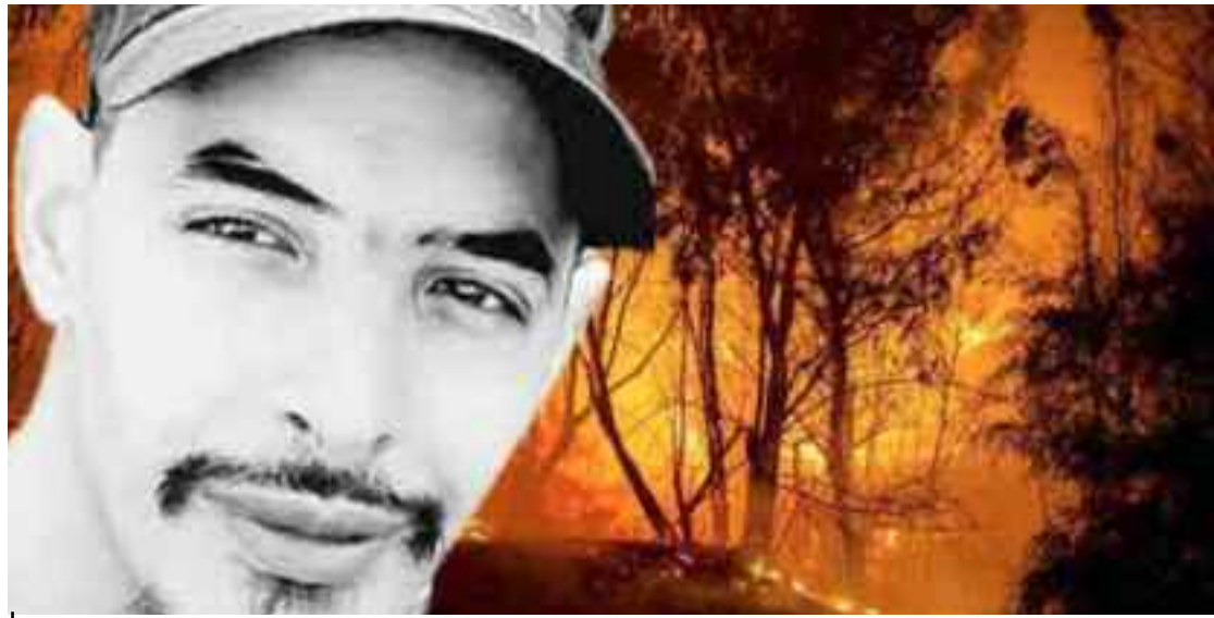
■ Tebboune a lancé un sérieux avertissement à quiconque tenterait d'attenter à l'unité nationale, il «paiera le prix très cher, l'unité nationale étant une chose sacrée pour laquelle un million et demi d'Algériens sont morts».

Il a fait remarquer que «les victimes qui sont décédées en martyrs sont issues des différentes régions du pays». Il a mis en garde contre les parties qui «profitent de l'occasion pour semer la discorde», et réaffirmé que «l'Etat algérien est un Etat indivisible, et le peuple est uni de Tizi Ouzou à Tamanrasset, et de Tébessa à Tlemcen. Ces questions sont tranchées et nous utiliserons tous les moyens offerts pour barrer la route à ces personnes qui veulent attenter à l'unité nationale». Le Président Tebboune a fait observer que «ce sont les citoyens honorables qui ont soutenu les services de sécurité pour mettre la main sur des suspects», rendant vaines les tentatives «des parties qui profitent de cette pénible épreuve pour envenimer la situation et tenter de créer la discorde entre l'Armée et le peuple, et entre le peuple et l'Etat». Le Président Tebboune a lancé un sérieux avertissement à quiconque tenterait d'attenter à l'unité nationale, il «paiera le prix très cher, l'unité nationale étant une chose sacrée pour laquelle un million et demi d'Algériens