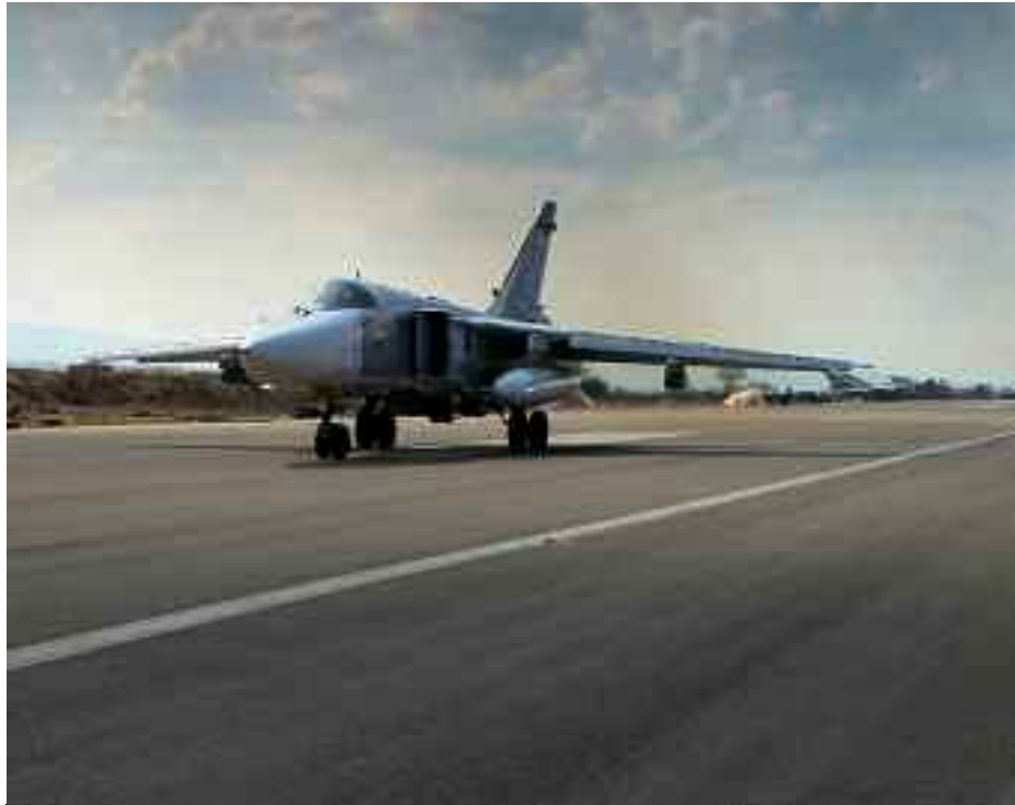
■ L'alliance militaire de la Russie a sauvé la Syrie de la défaite.

Les dirigeants russes ne se faisaient aucune illusion. Le président Vladimir Poutine et le Kremlin savaient ce qui était en jeu. Les puissances occidentales essayaient de transformer la Syrie en un État en faillite, de briser la nation avec une attaque brutale par des mandataires macabres, et