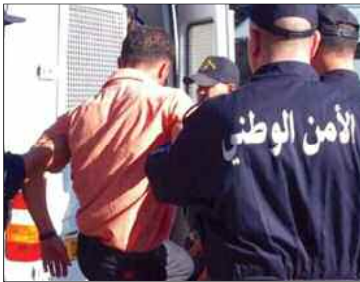
«Parmi ces individus arrêtés figurent la femme qui appelait à décapiter la dépouille, arrêtée alors qu'elle tentait de fuir vers le Maroc».