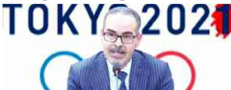
Le ministre de la Jeunesse et des Sports, Abderezak Sebkak.

La délégation algérienne des Paralympiques se rendra à la capitale japonaise le 19 août pour prendre part aux Jeux paralympiques de Tokyo 2020, avec 57 athlètes représentant cinq disciplines sportives, outre le staff technique et médical ainsi que dirigeants composés de près de 30 membre. Dans une allocution, le ministre a déclaré : «Je rends hommage aux efforts et à la discipline de nos sportifs paralympiques, des efforts ayant été sanctionnés