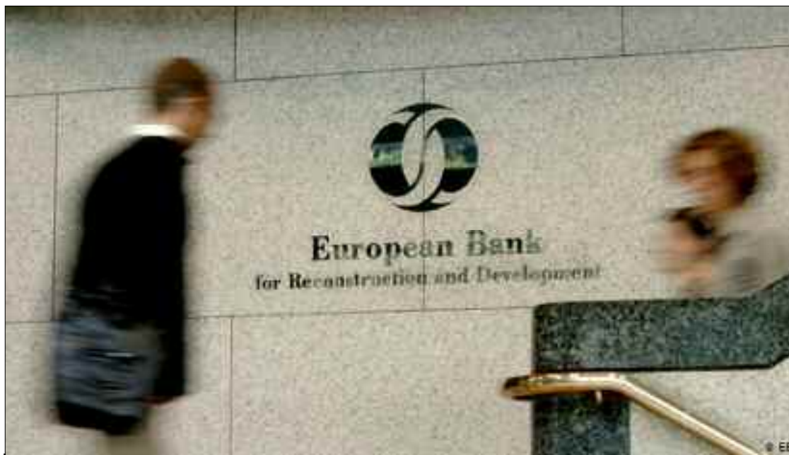
■ La faible marge de manœuvre budgétaire pousse l'Etat à chercher des alternatives de financement de son programme d'investissement national pour éviter d'entrer à nouveau dans la récession.

Le pays se heurte ces deux dernières années particulièrement à de réelles difficultés d'accès au financement en raison du faible revenu des exportations hydrocarbures comparés à une hausse importante des dépenses publiques. La faible marge de manœuvre