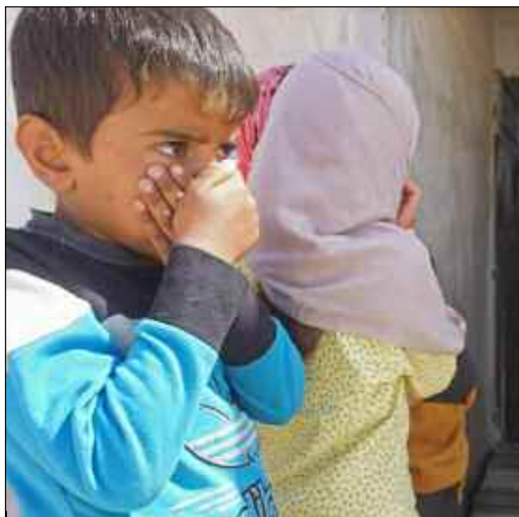
«On ne sait pas encore qui est en vie et qui est mort».