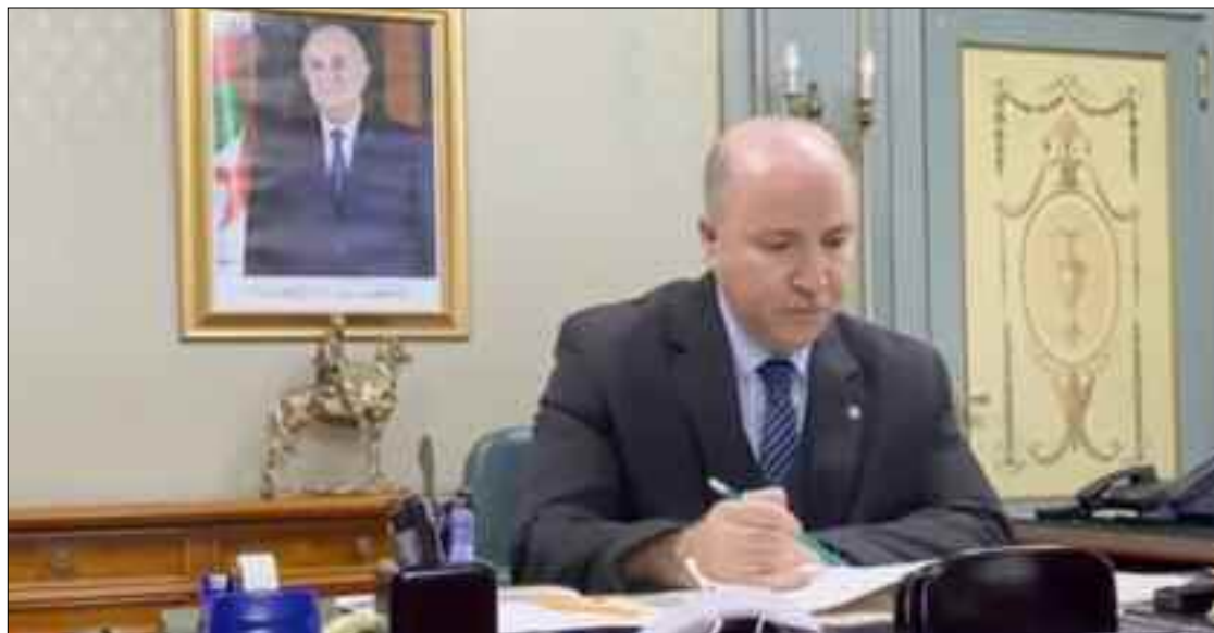
■ Le Premier ministre veut de la rigueur dans l'exécution du Plan de la relance économique et de son prochain Plan d'Action pour atteindre ses objectifs, que ce soit dans le domaine économique ou social.

Depuis deux ans, la conjoncture sanitaire et financière du pays laisse une faible marge de manœuvre à l'Etat qui a déjà mis en œuvre sa politique de relance à travers la prise d'une série de mesures budgétaires, réglementaires et monétaires pour encourager la croissance et lutter contre l'inflation. Parmi ces mesures, la hausse des dépenses publiques (LFC 2021), révisions de certaines taxes (TVA, TAP) ainsi que le salaire minimal, le refinancement des banques et la baisse du taux d'intérêt de la banque d'Algérie et la dévaluation volontaire du dinar, entre autres. Ces actions s'inscrivent dans le cadre de la relance économique à long terme. Par conséquent, l'augmentation des dépenses publiques et le déficit de la balance commerciale et des comptes courants a creusé le déséquilibre financier. Ce qui ressort de la politique bud-