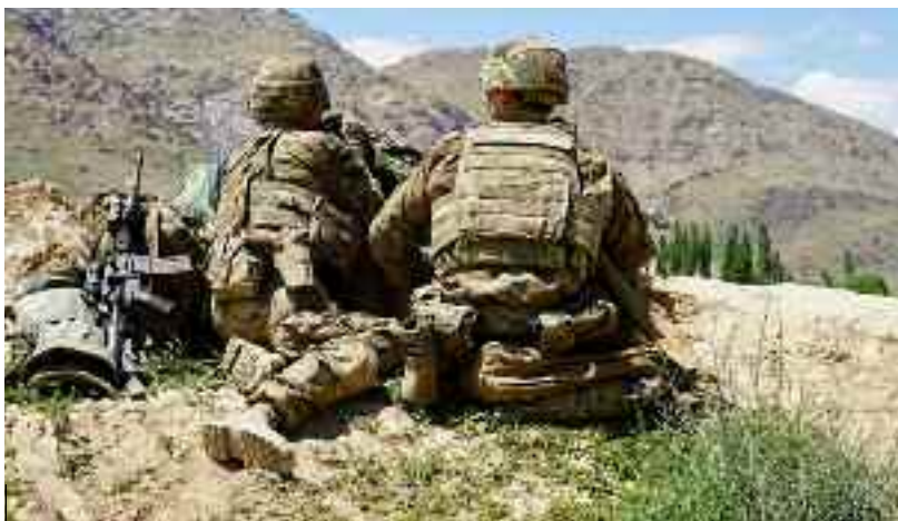
■ L'opération d'exfiltration Apagan se poursuit à Kaboul.

→ L'Allemagne va envoyer des centaines de soldats à Kaboul pour évacuer 10.000 civils afghans. Dix jours seulement après avoir conquis leur première capitale provinciale, les talibans sont désormais les maîtres de Kaboul, alors que le président afghan, Ashraf Ghani, en fuite, probablement au Tadjikistan, a admis sa défaite et justifié son départ en disant avoir voulu éviter un bain de sang.