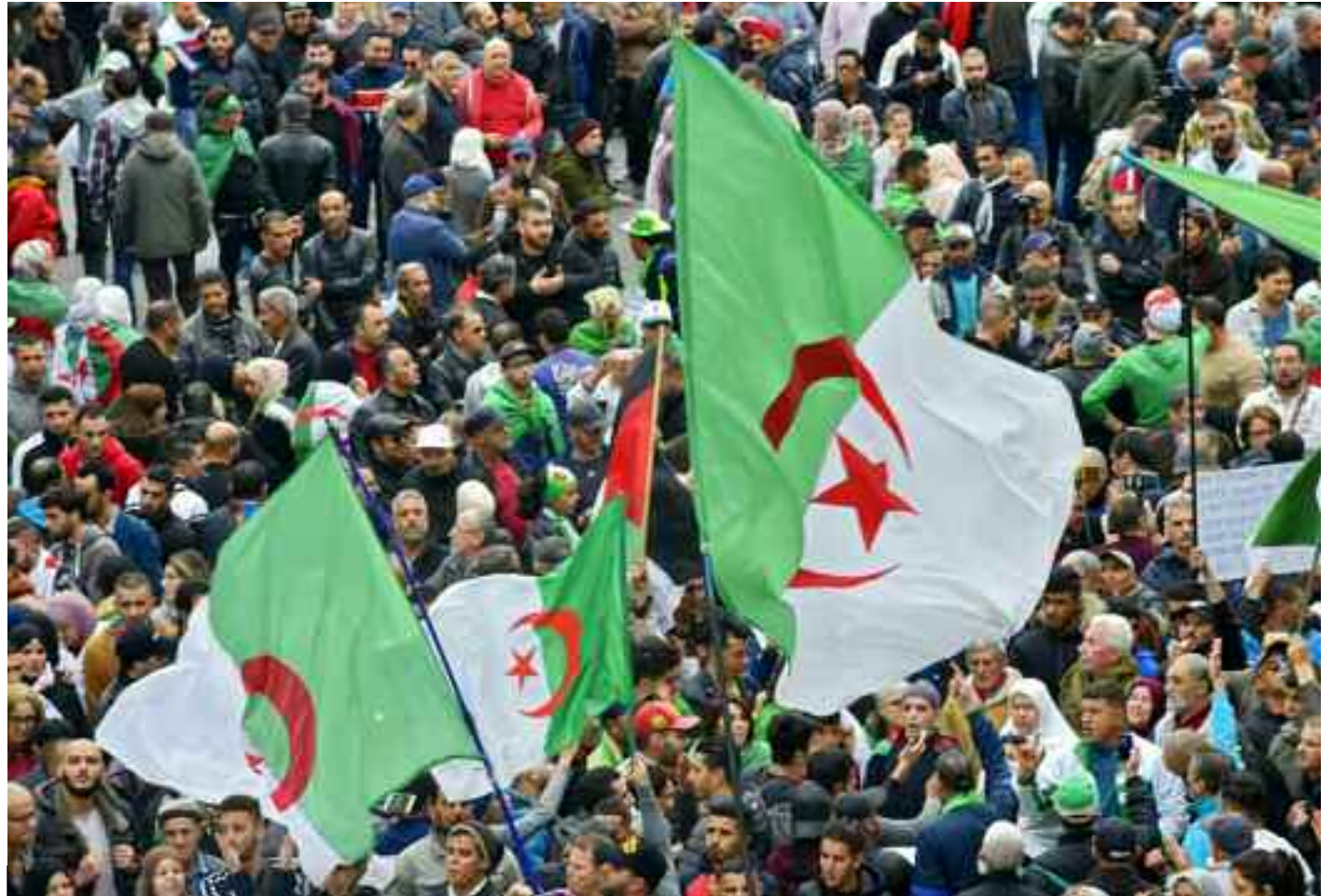
■ Manifestations populaires du «Hirak» historique du 22 février 2019.

Dans cette modeste contribution, sur la base d'une tentative d'approche marxiste-léniniste (1) de l'histoire immédiate, sur le «Hirak» ou soulèvement populaire, je m'appuierai sur une reconstitution chronologique approximative des divers faits marquants amassés dans les sources journalistiques et orales de première main, en plus de certains échanges avec des camarades et ami(e)s, d'internet (avec la nécessaire prudence exigée à cause de la propagande perfide – fake news – des protagonistes), et de l'observation directe de l'événement à Oran pendant plusieurs semaines et Alger pendant le 8 novembre 2019 et les 21 /22 février 2020.