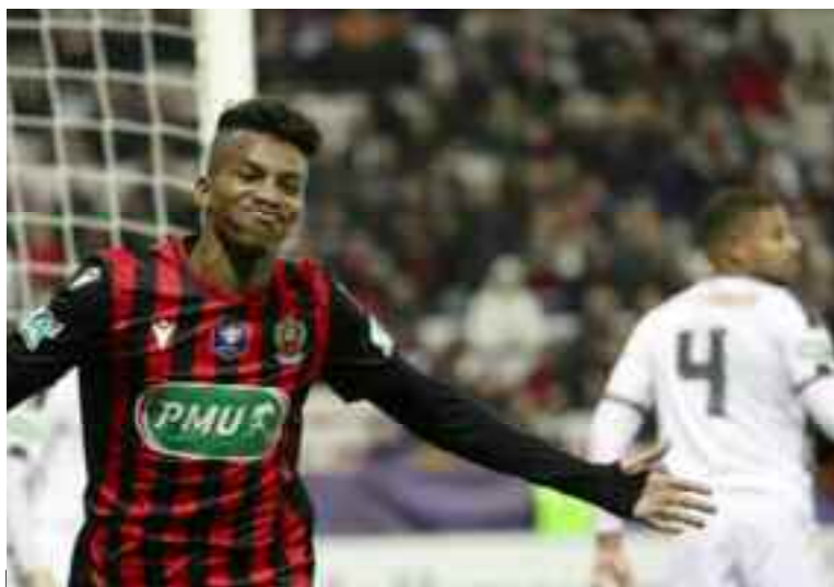
■ L'international algérien de Nice, Hicham Boudaoui.

Il n'a que 22 ans, né à Madrid, titulaire d'une double nationalité (Espagnole et Marocaine), son CV renseigne le monde sportif sur son potentiel. Le même journal dessine son itinéraire. Un itinéraire qui prend pli au Real, là où il a été formé par un géant du football, en l'occurrence Zinedine Zidane, c'est aussi lui qui lui a ouvert les portes en Liga en octobre 2017. Achraf Hakimi dont son jeu séduit plus d'un, a été prêté au Borussia Dortmund, «un des meilleurs clubs allemands (2018-2020), puis transféré à l'Inter Milan en juillet 2020 pour 40 millions d'euros». Celui qui a été titularisé ce vendredi par l'entraîneur du PSG, contre Brest. Malgré un titre de champion d'Italie, l'international marocain a accepté de rejoindre le Paris-Saint-Germain (PSG), qui n'a pas hésité à verser 60 millions d'euros hors bonus (11 millions d'euros) pour s'attacher les services du Lion de l'Atlas. Ses premières prestations avec le PSG se sont révélées concluantes.