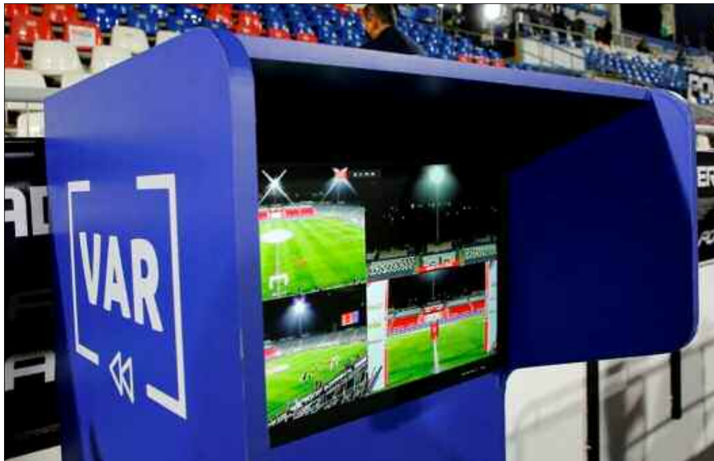
■ La VAR sera d'une aide appréciable.

«Dans cet élan de proposer un football plus juste, on teste en 2016 l'assistance d'arbitres en dehors du terrain scrutant toutes les caméras autour du match. La Coupe du monde 2018 masculine et celle