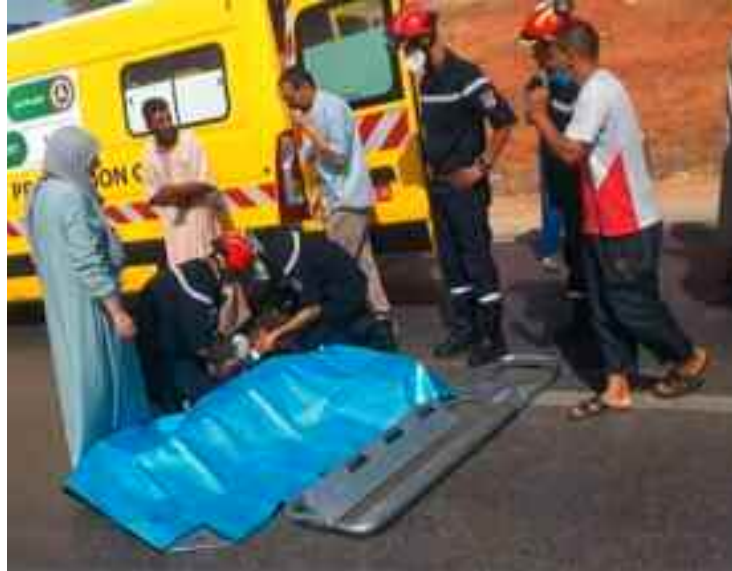
Le corps de la victime a été transféré par ambulance au service de conservation des cadavres (la morgue) de l'Établissement public hospitalier de la commune de Sobha relevant de la wilaya de Chlef. Abdenour

L'accident a entraîné la mort sur le coup de la vieille dame. Son corps a été transféré par ambulance au service de conser-