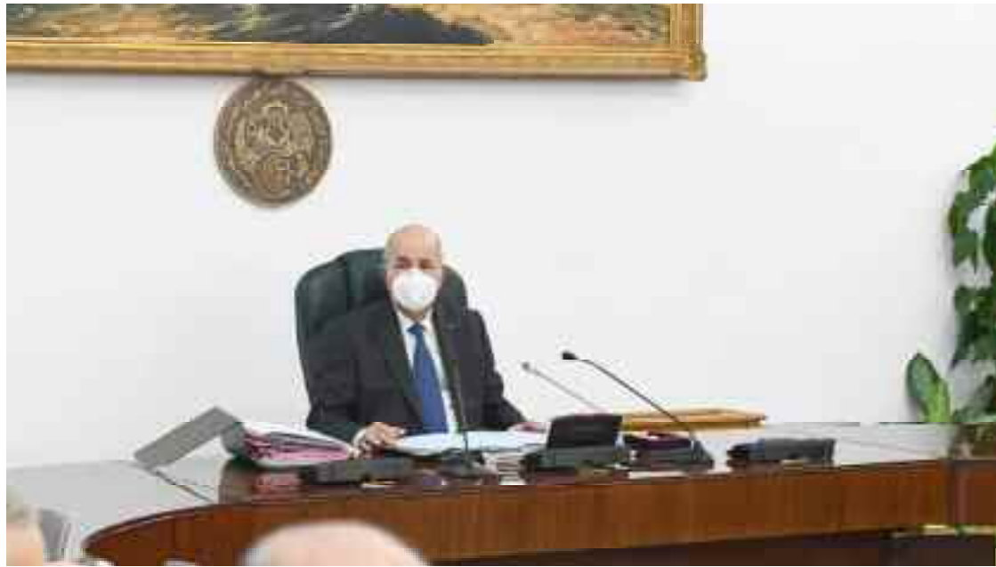
■ La réunion du Conseil des ministres s'est tenu dans un contexte de mobilisation des Algériens, à l'intérieur du pays et au sein de la diaspora, dans un mouvement de solidarité exemplaire.

Le Conseil des ministres a apprécié la mise en place du pôle spécialisé en cybercriminalité, comme un gain pour le secteur de la justice, similaire au pôle spécialisé en délits économiques, en mettant l'accent sur l'accélération de la mise en place du nouveau pôle et la lutte