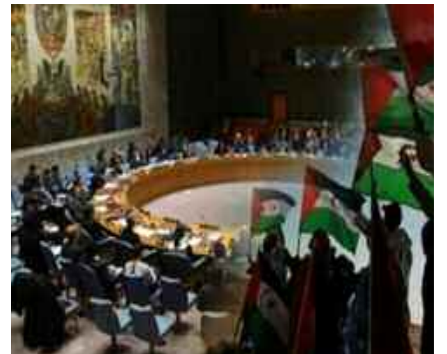
■ Regain de tension à Dakhla au Sahara occidental occupé.