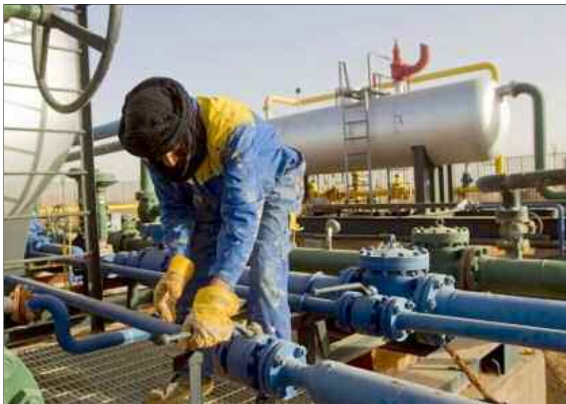
■ Le GME était censé consolider les relations de bon voisinage entre l'Algérie et le Maroc, presque cinq ans après la signature de l'accord de cessez le feu entre le Polisario et le Maroc en 1991.

Moins de vingt-quatre heures après le communiqué de la Présidence algérienne, la directrice générale de l'Office marocain des hydrocarbures et des mines annonçait «la volonté du Maroc de maintenir cette voie (le gazoduc Maghreb Europe) d'exportation qui a été clairement affirmée de manière constante, à tout les ni-