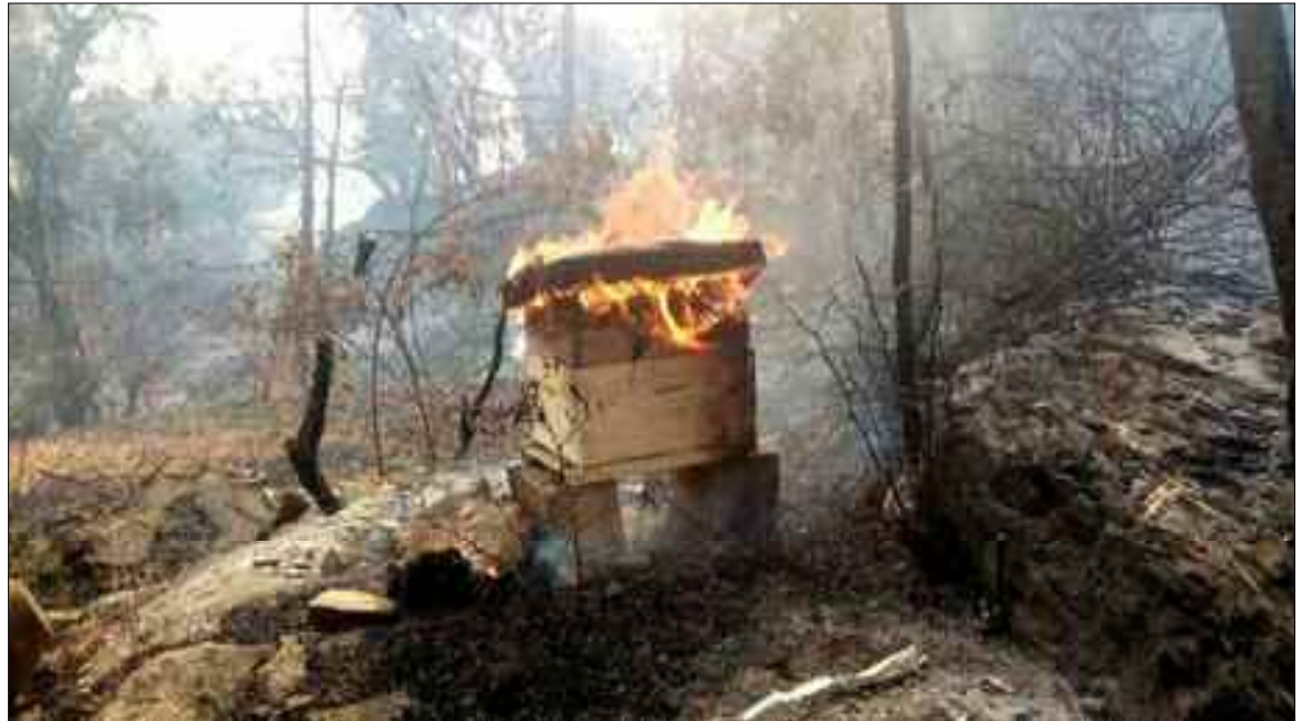
■ Cette catastrophe restera à jamais gravée dans notre mémoire.

A cela s'ajoute la destruction par les flammes de 8.110 ruches pleines et de 3.101 ruches vides ainsi que 429 équins et espèces asines (ânes, mulets et chevaux) Les mêmes équipes ont également recensé plusieurs infrastructures agricoles brûlées, dont 103 étables, 100 bergeries, 40 chèvreries, 26 poulaillers en