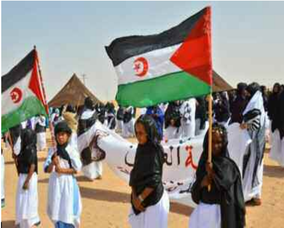
■ Le conflit au Sahara occidental s'est rallumé après des décennies de calme précaire.

«Le roi du Maroc doit regarder la vérité en face et comprendre que tous les problèmes de son régime aux niveaux régional et international, y compris avec certains Etats européens, découlent de sa politique expansionniste au Sahara occidental», a-t-il dit. Pour le diplomate sahraoui, «permettre au peuple sahraoui de se