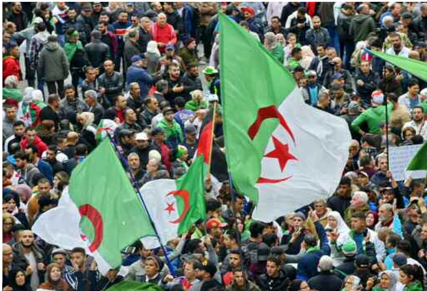
■ Manifestations populaires du «Hirak» historique du 22 février 2019.

Dans cette modeste contribution, sur la base d'une tentative d'approche marxiste-léniniste (1) de l'histoire immédiate, sur le «Hirak» ou soulèvement populaire, je m'appuierai sur une reconstitution chronologique approximative des divers faits marquants amassés dans les sources journalistiques et orales de première main, en plus de certains échanges avec des camarades et ami(e)s, d'internet (avec la nécessaire prudence exigée à cause de la propagande perfide – fake news – des protagonistes), et de l'observation directe de l'événement à Oran pendant plusieurs semaines et Alger pendant le 8 novembre 2019 et les 21 /22 février 2020.