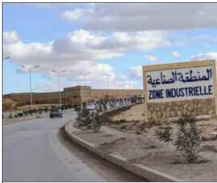
■ Zeghdar promet de réorganiser le processus de l'investissement dans le pays et de soutenir les entreprises nationales.

Depuis des semaines, il prend le pouls des entreprises industrielles publiques, et ce, avant de mettre en œuvre sa vision stratégique visant à reconstruire collectivement le secteur industriel national et doper l'investissement. Impliquer tous les acteurs du secteur pour examiner les principaux leviers déterminant l'investissement industriel local. Plusieurs rencontres de travail et de consultation ont été organisées dans ce cadre entre le ministre et des représentants et cadres des groupes industriels publics et de différents organismes de soutien à l'investissement (Aniref, Andi, Fni). L'objectif est d'éliminer les obstacles (financiers, gouvernance, foncier et réglementaire) qui entravent l'élan de l'investissement dans le pays. Ce dernier est au cœur de la politique du ministre qui compte explorer toutes les pistes économiques pour doper l'investissement local.