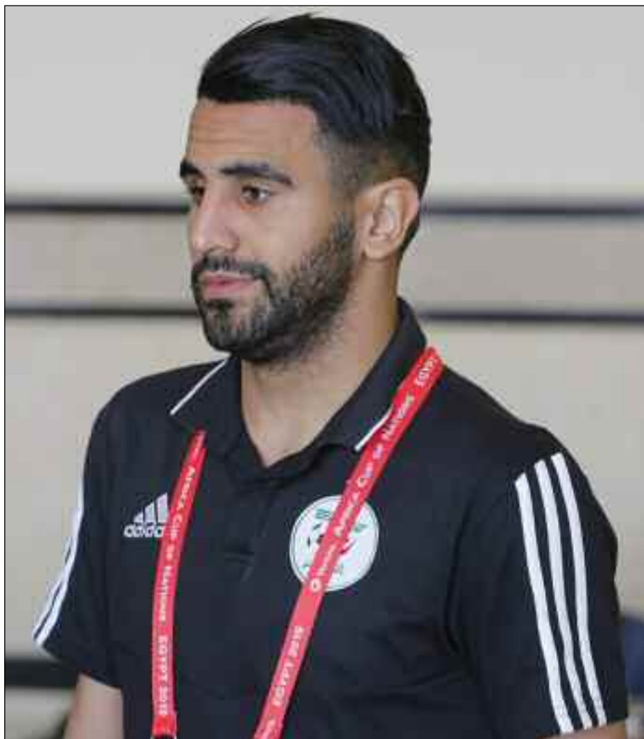
■ Mahrez risque de rater les matches face au Djibouti et au Burkina Faso.

Manchester City et West Ham United, clubs où évoluent Ryad Mahrez et Said Benrahma risqueraient d'emboîter le