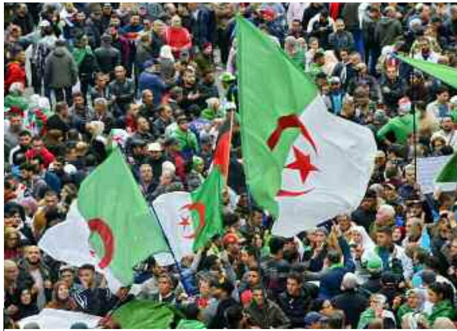
■ Manifestations populaires du «Hirak» historique du 22 février 2019.

Dans cette modeste contribution, sur la base d'une tentative d'approche marxiste-léniniste (1) de l'histoire immédiate, sur le «Hirak» ou soulèvement populaire, je m'appuierai sur une reconstitution chronologique approximative des divers faits marquants amassés dans les sources journalistiques et orales de première main, en plus de certains échanges avec des camarades et ami(e)s, d'internet (avec la nécessaire prudence exigée à cause de la propagande perfide – fake news – des protagonistes), et de l'observation directe de l'événement à Oran pendant plusieurs semaines et Alger pendant le 8 novembre 2019 et les 21 /22 février 2020.