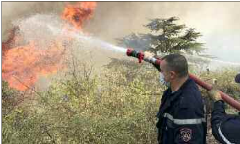
Les volontaires qui ont animé le mouvement de solidarité avec les sinistrés, et ceux qui ont été aux côtés des éléments de la DGF devraient participer à l'élaboration de la politique de prévention.

Par le passé, l'incendie volontaire d'une forêt en Algérie était motivé par des considérations économiques (défrichage pour les activités agricoles, pacage, charbon de bois...), ou alors, quand il était involontaire, partait d'ordures incinérées ou de gestes d'incivilité. C'est ainsi qu'en 1983, près de 222.000 ha ont brûlé ; entre 1990 et 2000, décennie marquée par le terrorisme, les incendies ont dévasté plus de 500.000 ha, dont 280.000 ha pour la seule année 1994 ; en 2012, 99.000 ha brûlés et, derniers incendies en date, en 2017, près de 54.000 ha partis en fumée. Entre 2008 et 2017, plus de 320.000 ha (dont près de la moitié en superficies forestières) ont été incendiés. Tizi Ouzou et Béjaïa étaient en tête de la liste des 10 wilayas les plus touchées.