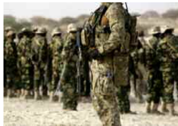
Redéploiement des troupes armées tchadiennes au Sahel.