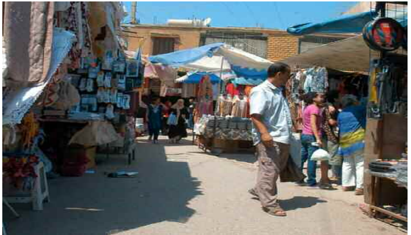
■ Une enveloppe de 12 milliards de DA a été réservée pour la réalisation de 784 marchés de proximité.