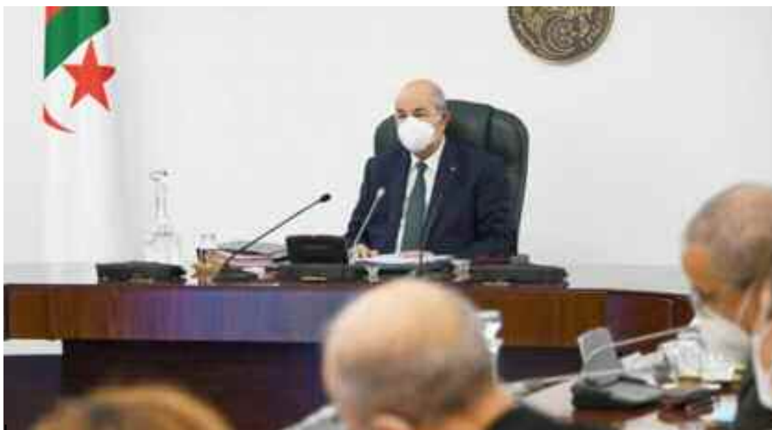
Le président de la République a souligné l'importance du Plan d'action dans la concrétisation des engagements qu'il a pris envers le peuple algérien.

tème de santé, améliorer la qualité de l'éducation, assurer la qualité de l'enseignement supérieur et de la formation professionnelle et les adapter aux exigences du marché du travail ; augmenter et