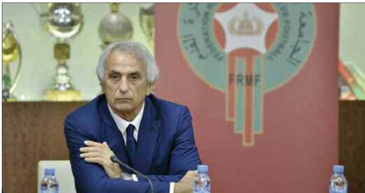
■ Vahid Halilhodzic n'est pas facile à manier.

→ A quelques jours du coup d'envoi des éliminatoires de la Coupe du monde 2022, alors que les Lions de l'Atlas se préparent à entamer leurs premiers duels face au Soudan et à la Guinée, voilà que la relation entre le sélectionneur Vahid Halilhodzic et son employeur, en l'occurrence la Fédération royale marocaine de football se détériore fragilisant ainsi au passage la préparation des prochains matches.