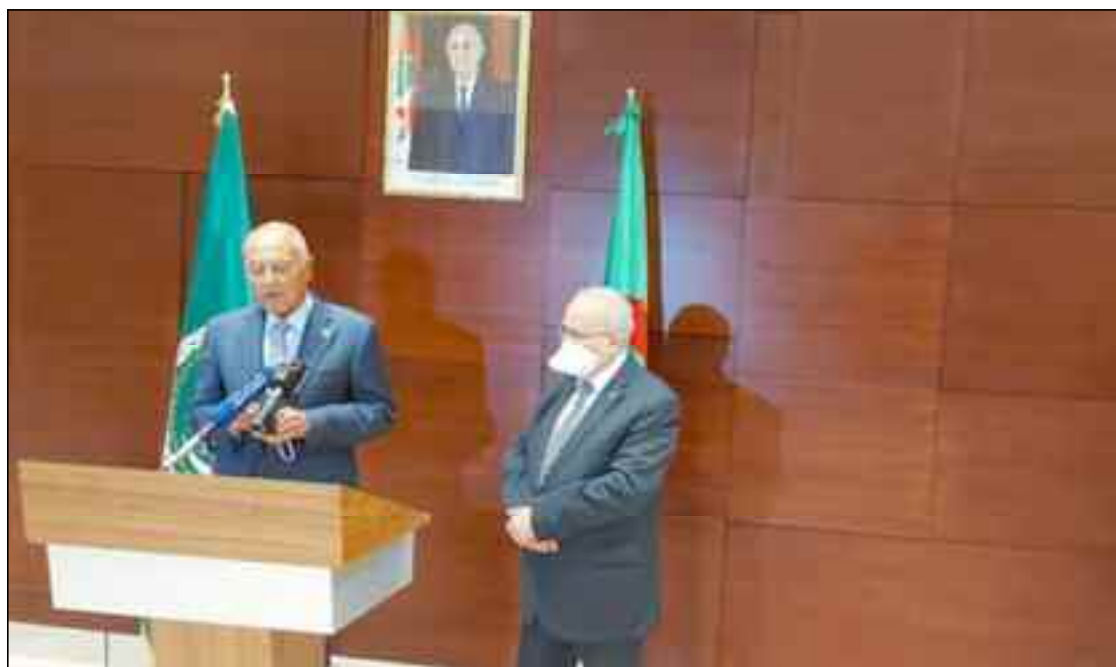
■ Lamamra a jugé indispensable que les pays limitrophes de la Libye puissent se réunir pour aider les Libyens à parachever le processus politique de la réconciliation nationale menée sous l'égide des Nations unies.

Durant cette réunion des pays voisins de la Libye, il est attendu que l'émissaire onusien fasse une présentation sur les récents développements en Libye et le processus de la mise en œuvre des recommandations de la Conférence de Berlin 2. Tandis que l'allocution de M. Lamamra sera suivie d'un exposé de la cheffe de la diplomatie libyenne, Najla Al-Manqoush sur les préparatifs des élections, espérées en décembre. La réunion discutera d'une feuille de route pour la tenue des pro-