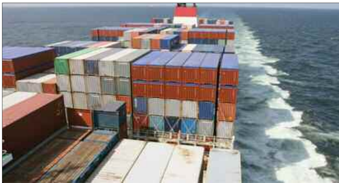
■ Pour que l'activité portuaire puisse intégrer la chaîne internationale de transport maritime et devenir compétitif, il faudra résoudre ses difficultés multiples qui endiguent son développement intégré.

Lors d'une nouvelle rencontre de concertation et de travail, organisée au siège de son département,