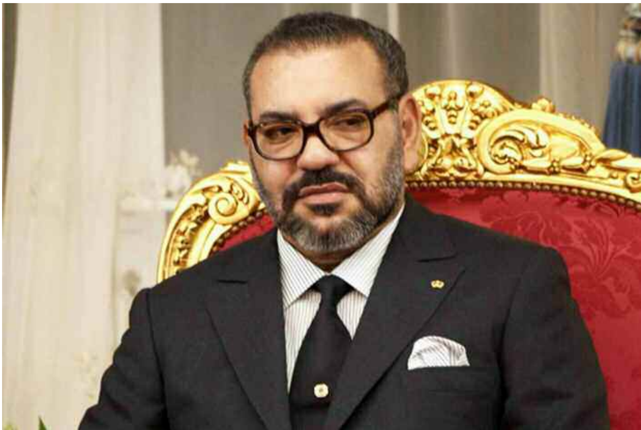
■ Les forces d'occupation marocaines ciblent désormais les civils sahraouis et les commerçants algériens.