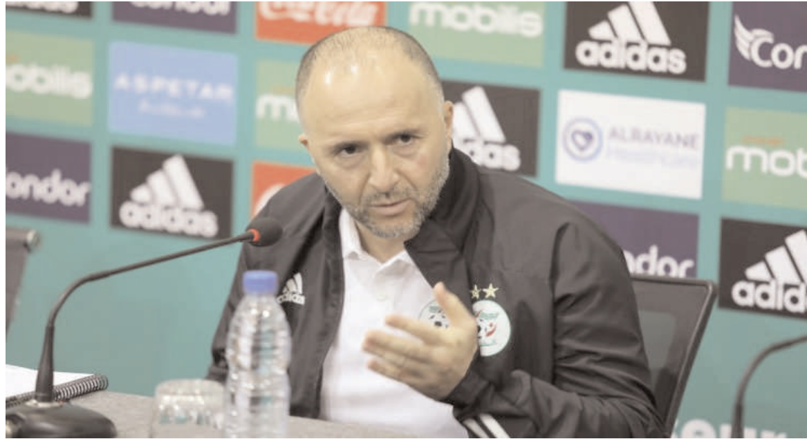
Belmadi a affirmé que l'Algérie a fait un parcours quasiment sans faute.

Le technicien algérien estime qu'il s'agit d'une qualification en bar-