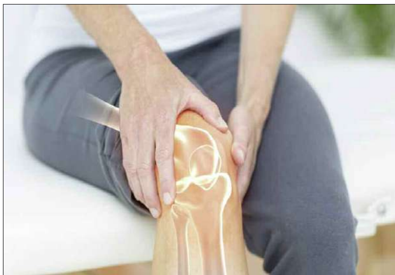
■ Arthrose du genou.

→ L'arthrose est une dégénérescence du cartilage des articulations sans infection ni inflammation particulière. Cependant, il existe des formes avec une composante inflammatoire et beaucoup de patients présentent des poussées d'inflammation sporadiques.