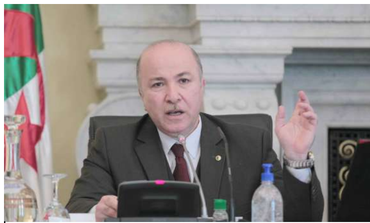
Benabderrahmane a mis en avant les défis que le Gouvernement devra relever de développement des ressources financières, de l'investissement et de l'exportation.

«L'Algérie, en quête d'efficacité et d'efficacité de ses politiques liées à la gestion des finances publiques, s'apprete à mettre en place un nouveau cadre pour les PPP, repensé sous l'angle de la bonne gouvernance, de la transparence et du partage des risques et des gains entre le secteur public et le secteur privé», a déclaré le Premier ministre, lors de son intervention à la 6 ème Réunion du Forum annuel des Finances publiques.