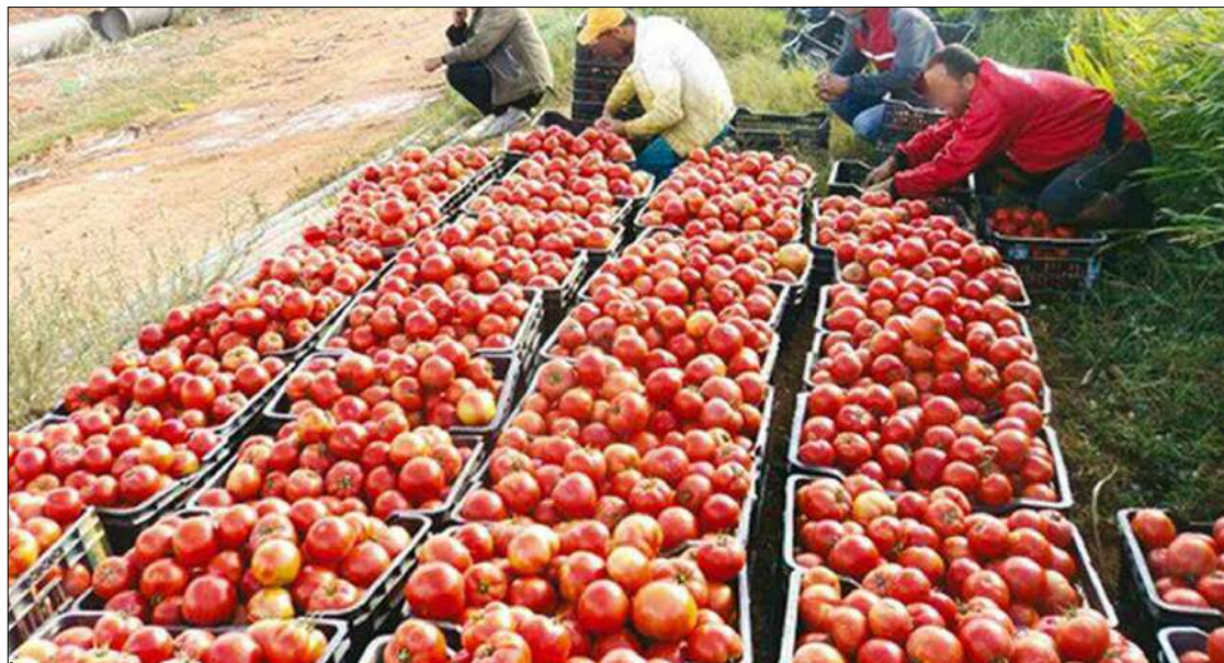
■ Grâce à l'augmentation de la production de la tomate industrielle, l'Algérie a réussi à atteindre «une autosuffisance» en matière de double et de triple concentré de tomate.