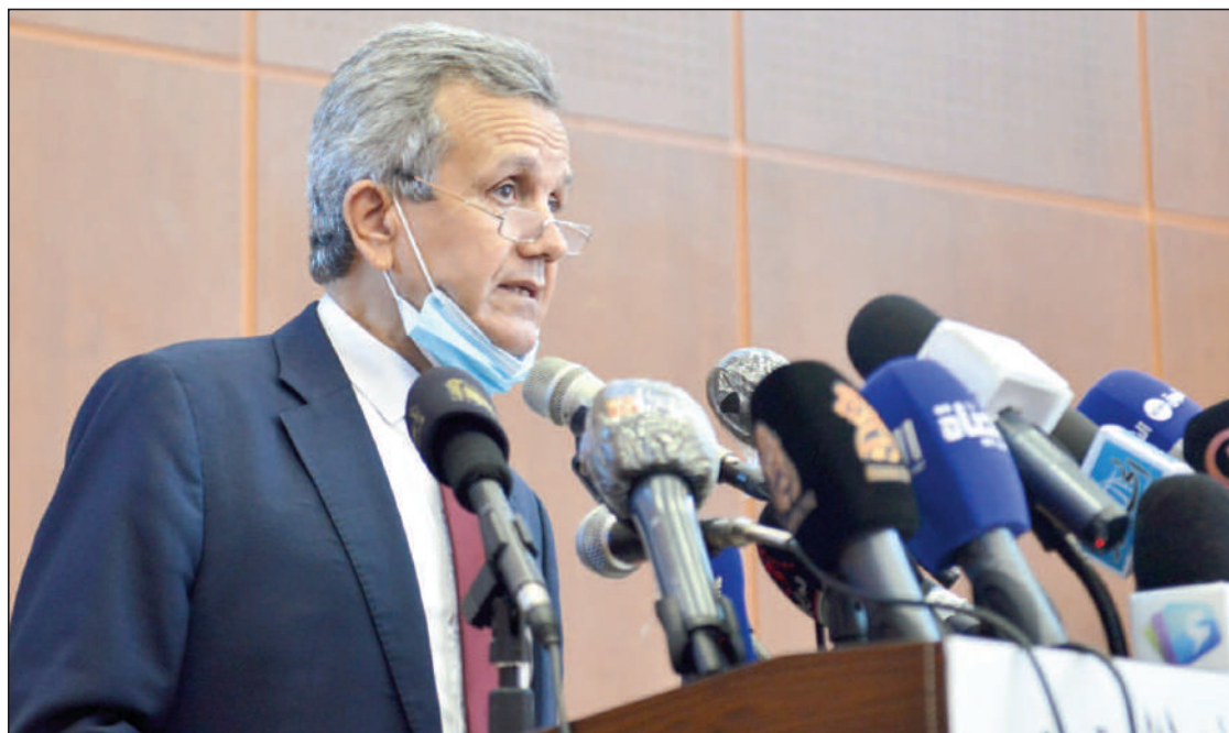
■ Evoquant l'épidémie du Coronavirus et l'évolution de la situation sanitaire, Benbouzid a fait savoir que son département ministériel enregistre actuellement une stabilité des cas de la Covid-19.

Evoquant l'épidémie du Coronavirus (Covid-19) et l'évolution de la situation sanitaire, le ministre de la Santé a fait savoir que son département ministériel enregistre actuellement une stabilité des cas de la Covid-19, faisant remarquer qu'à l'heure actuelle, seules 5 millions de personnes ont reçu les deux doses du vaccin anti-Covid-19. Un nombre, a-t-il