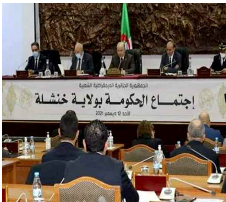
Les ministres ont intervenu sur les programmes de leurs secteurs consacrés au développement de la wilaya de Khenchela.

présenté l'ordre du jour des travaux portant sur le seul point relatif à la mise en œuvre du programme complémentaire de développement de la wilaya de Khenchela en exécution des dé-