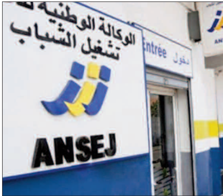
■ Une opportunité à saisir par les jeunes promoteurs et les pouvoirs publics pour reconstruire un réseau de jeunes entrepreneurs solidaires et dynamiques.