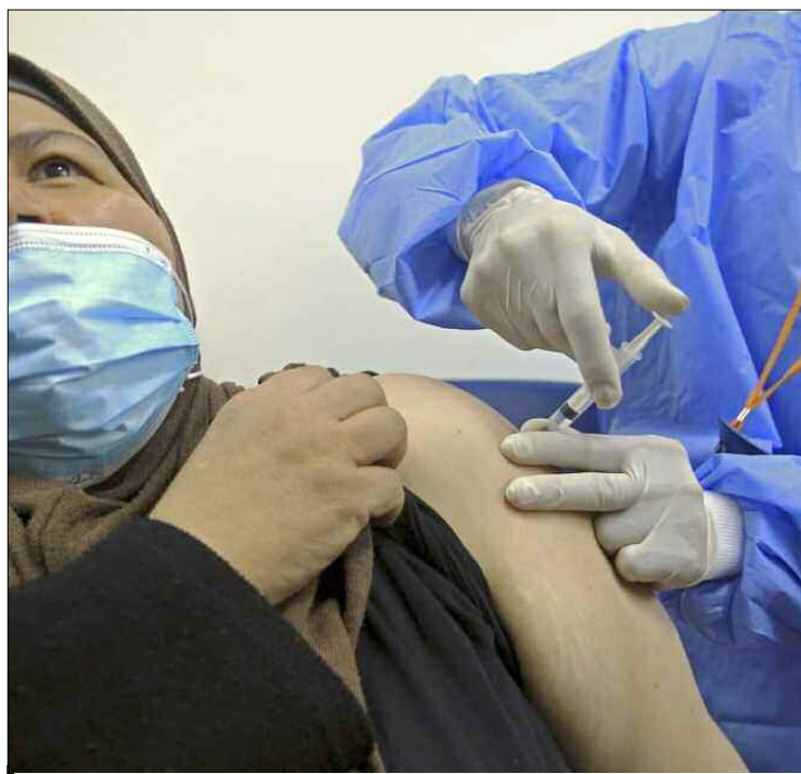
■ Cette campagne nationale de vaccination a concerné l'ensemble des enseignants et personnels administratifs relevant du secteur de l'Éducation nationale.

Cette deuxième campagne de vaccination des personnels du secteur de l'Éducation nationale qui a débuté hier et qui prendra fin le 16 décembre prochain et ce, au ni-