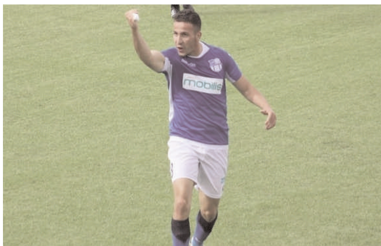
■ C'est la victoire du NCM sur le NAHD qui a fait sensation.

→ Le NC Magra a réalisé un authentique exploit en battant à Alger, le NA Hussein-Dey (1-0), lors de la 2 e partie du Championnat de Ligue 1 algérienne de football, disputée samedi, au moment où l'ES Sétif s'est imposée difficilement à domicile face au WA Tlemcen (1-0) pour le compte de la 7 e journée de la compétition entamée vendredi à l'issue de laquelle l'US Biskra s'est maintenue en tête du Championnat.