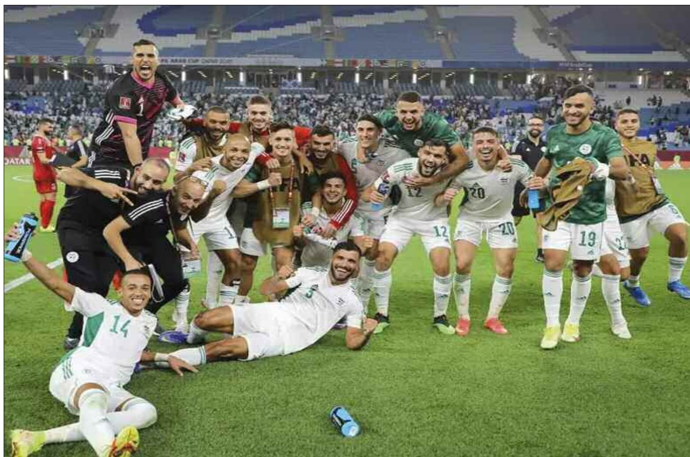
■ Les Verts ont été héroïques face au Maroc.

Au terme d'un match fou, le meilleur a gagné, et c'est l'Algérie qui élimine le Maroc aux tirs au but (2-2, 5-3 tab) en quart de finale de la Coupe arabe de la FIFA, et ce, dans une ambiance exceptionnelle au Al Thumama Stadium de Doha où ses 40 000 places, se sont écoulées en quelques heures, le match s'est joué à guichets fermés ! Au final, l'Algérie a démontré qu'elle a un effectif qui n'a