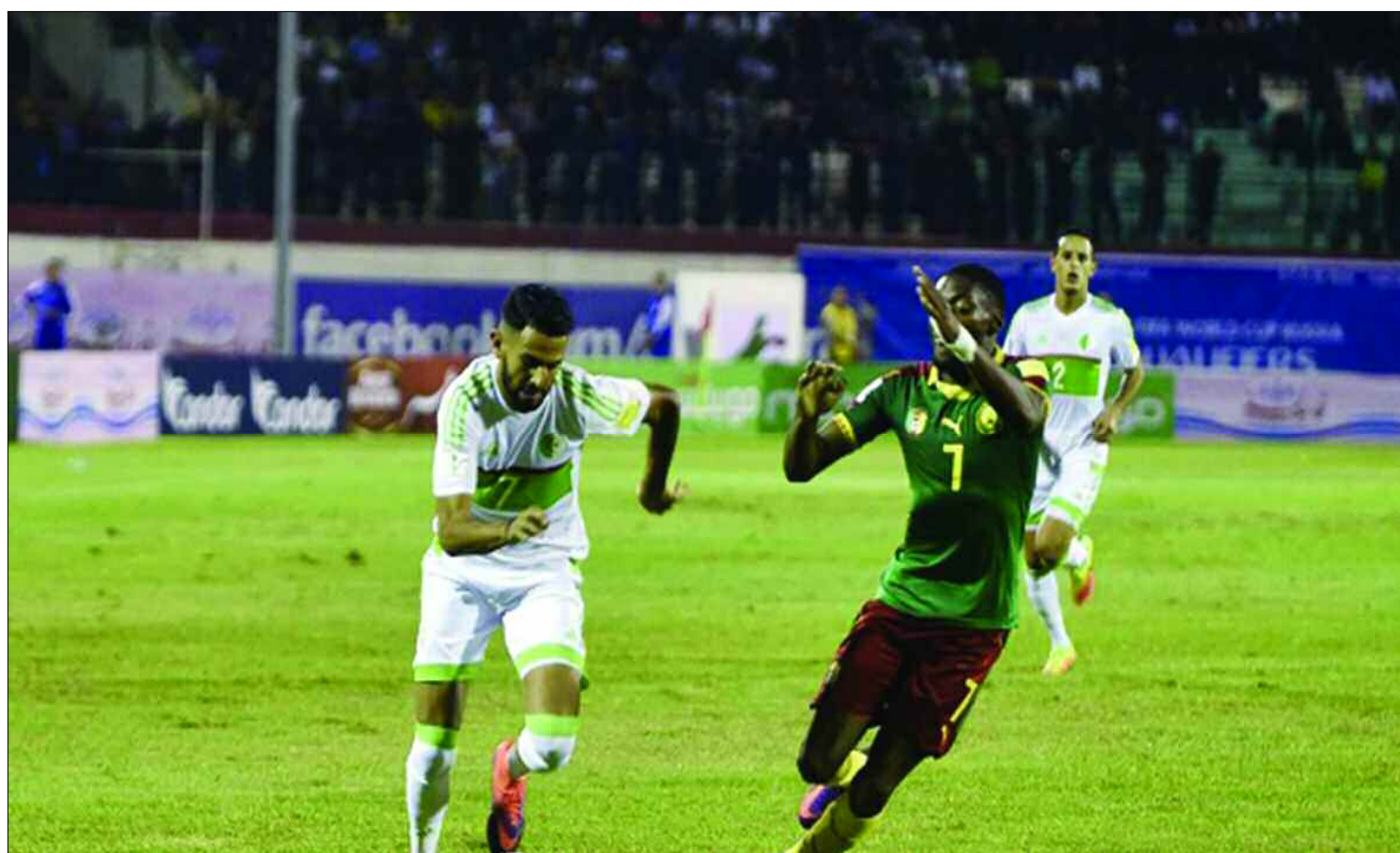
■ Un dur morceau pour les Verts.