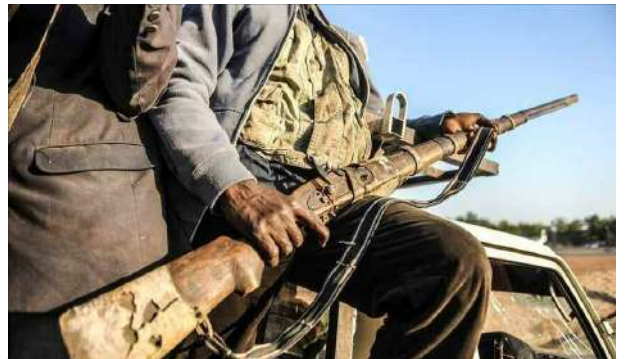
■ Les victimes auraient été assassinées par l'armée malienne.

Sept Mauritaniens ont été tués sur le territoire malien, jeudi, a annoncé le président mauritanien Mohamed Ould Cheikh El-Ghazouani, note Anadolu. « Suite au douloureux incident qui a coûté la vie à sept de nos concitoyens innocents sur le territoire malien, Son Excellence le Président de la République, Monsieur Mohamed Ould Cheikh El-Ghazouani, exprime aux familles des victimes de ce drame, aux habitants de la zone, et à l'ensemble du peuple mauritanien, les sentiments les plus sincères de compassion et les plus franches condoléances », a indiqué la présidence mauritanienne dans un communiqué.