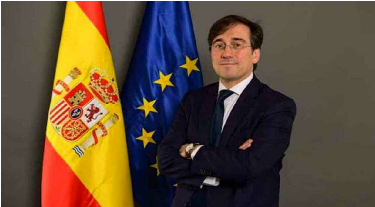
■ Le ministre espagnol des Affaires étrangères, José Manuel Albares.

Le ministre espagnol des Affaires étrangères, José Manuel Albares, a réitéré vendredi à Staffan de Mistura, «la nécessité de trouver une solution politique pour le conflit au Sahara occidental, dans le cadre de l'ONU», soulignant qu'«il s'agit d'un impératif de résoudre ce conflit oublié».