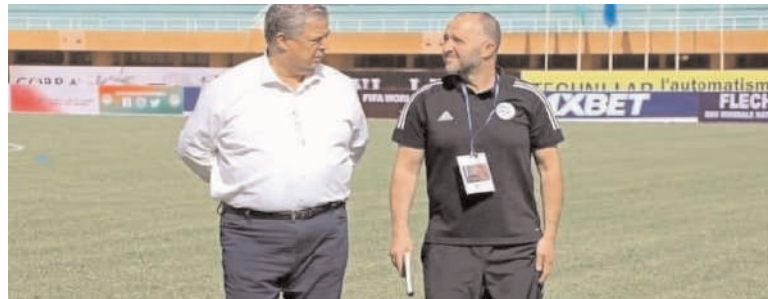
Le président de la FAF confiant.

Outre le choc Cameroun- Algérie, le tirage au sort a donné lieu à d'autres belles affiches : Egypte – Sénégal, Ghana – Nigeria, RD Congo- Maroc, et