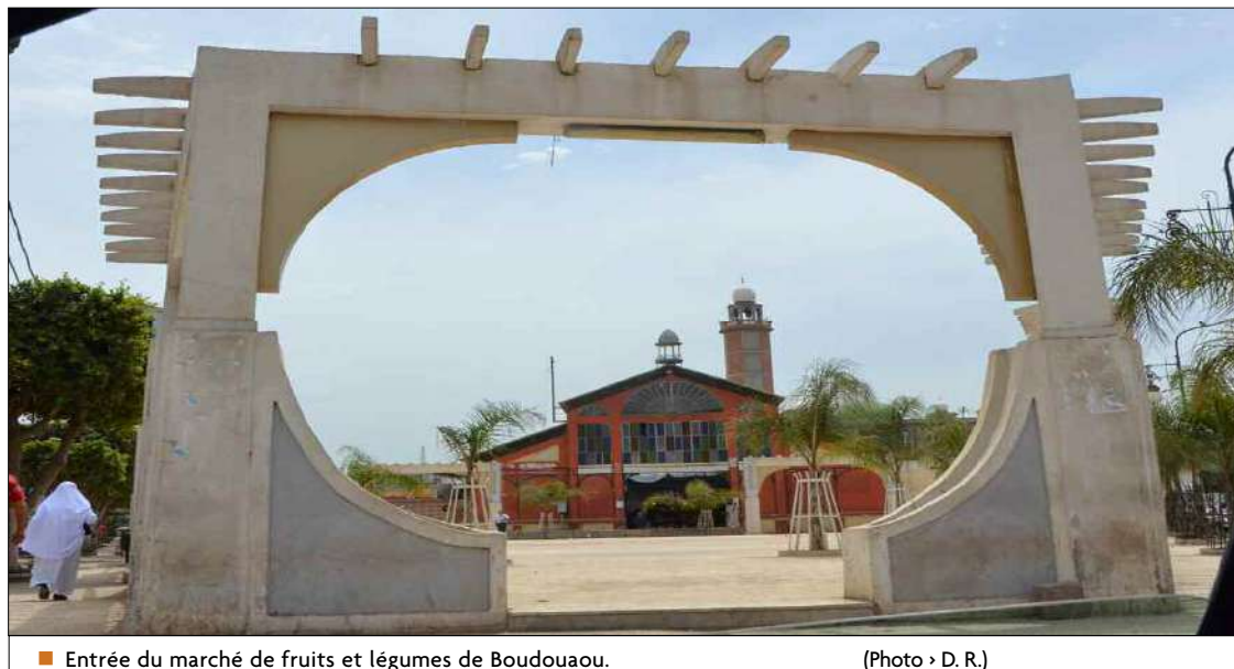
■ Entrée du marché de fruits et légumes de Boudouaou.

Boudouaou est une ville coloniale, et pour s'en rendre compte, il faudrait faire une virée au centre-ville pour découvrir de beaux restes des vestiges nous rappelant la colonisation française. Dans le bon vieux temps, et tout juste après l'indépendance de l'Algérie, il était difficile et même très pénible de se rendre à Alger, à cause de l'embouteillage qui y régnait dans les centres-ville de Bordj-Menaïel, les Issers, Si Mustapha, Thénia, mais le plus pénible était celui de l'agglomération de Boudouaou, situation héritée de l'ère coloniale. Il fallait démarrer de très bonne heure pour éviter les encombrements, maintenant tout a changé avec la réalisation des évitements des villes, cependant rien n'a changé dans nos soit-disant autoroutes, car il suffit d'un simple obstacle (accident, travaux ou autres) pour se voir passer des heures à attendre la libre circulation. Boudouaou (Alma pendant la colonisation française) est une commune de la wilaya de Boumerdès, elle est située à trente-cinq kilomètres d'Alger dont elle dépendait autrefois et à onze kilomètres au sud-est de la wilaya de Boumerdès dont elle dépend actuellement suite