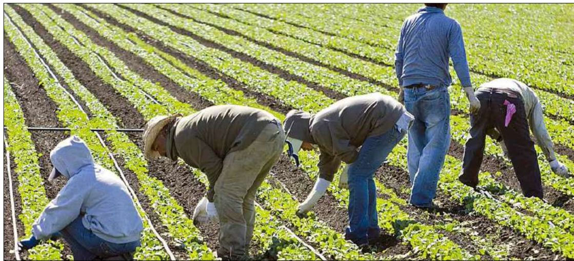
■ Henni : «Le Gouvernement s'est penché de manière précise, comptent parmi les filières jugées stratégiques, car destinées à des produits de large consommation».

Le ministre de l'Agriculture et du Développement rural, Mohamed Abdelhafid Henni a salué, hier dimanche à Alger, la décision du Gouvernement d'augmenter le prix d'achat, par l'Etat, à 6.000 DA le quintal de blé dur, jusque-là fixé à 4.500 DA, de la production nationale de blé. «Il s'agit d'une enveloppe financière supplémentaire de 30 milliards de DA consacrée par l'Etat. Une très bonne nouvelle pour les agriculteurs», a-t-il indiqué.