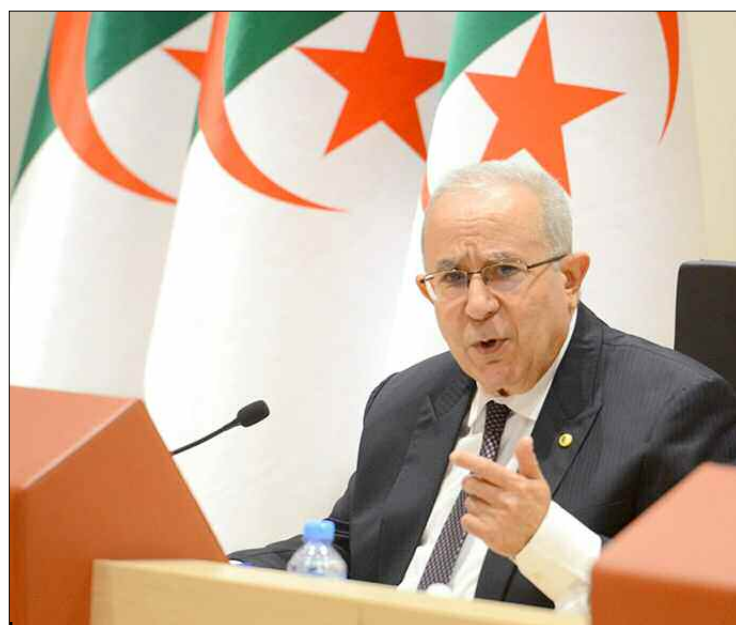
■ Lamamra a évoqué «la situation arabe actuelle et l'ampleur des défis qui s'imposent aux sociétés arabes».

Aujourd'hui, il y a un retournement de situation favorable à la Syrie et aux pays arabes mais des efforts sont exigés pour faire sau-