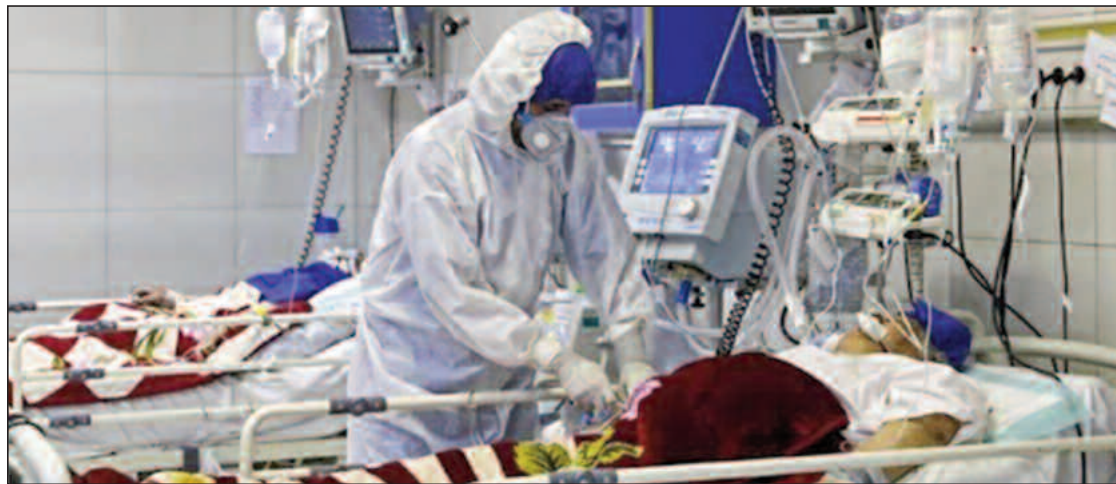
■ Mahyaoui : «Omicron est beaucoup moins mortel que Delta, un avantage malgré tout».

Le Professeur Kheloui a même fait état d'un débordement des