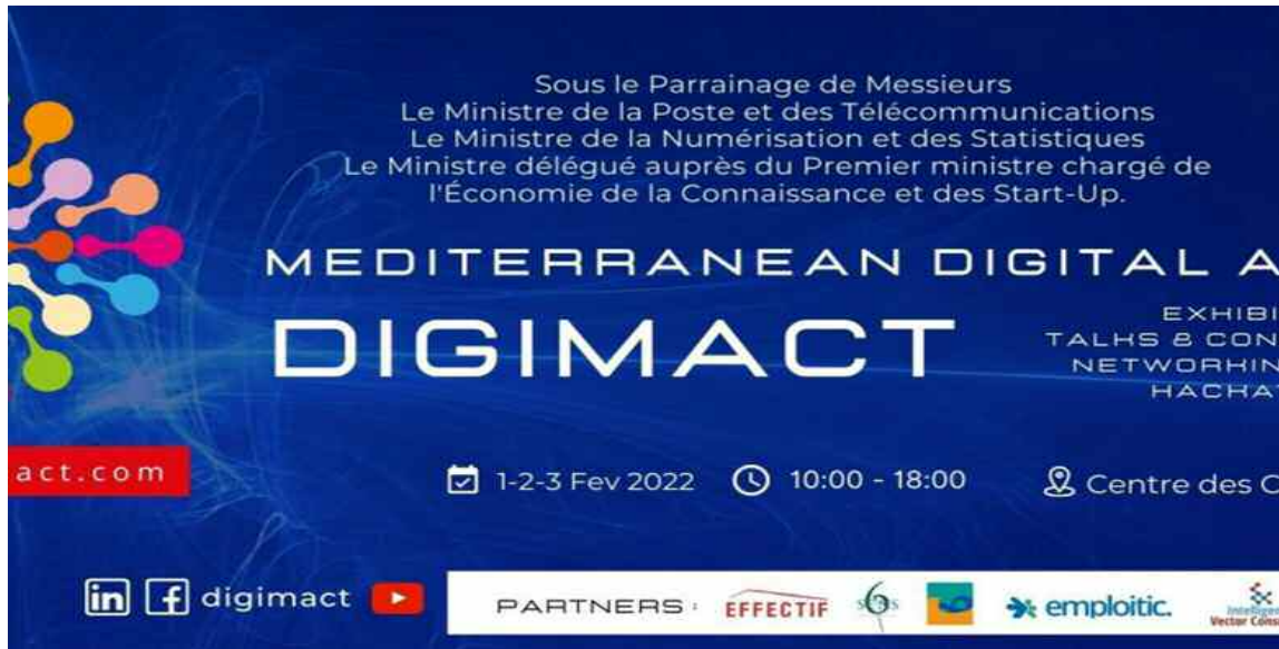
Le Salon «Mediterranean Digital Action» devra regrouper différents acteurs dans les métiers du numérique.

La première édition du Salon «Mediterranean Digital Action» (Digimact) dédié au digital pour les Jeux méditerranéens d'Oran 2022 se tiendra du 1 er au 3 février prochain au Centre des conventions d'Oran (CCO), a-t-on appris des organisateurs.