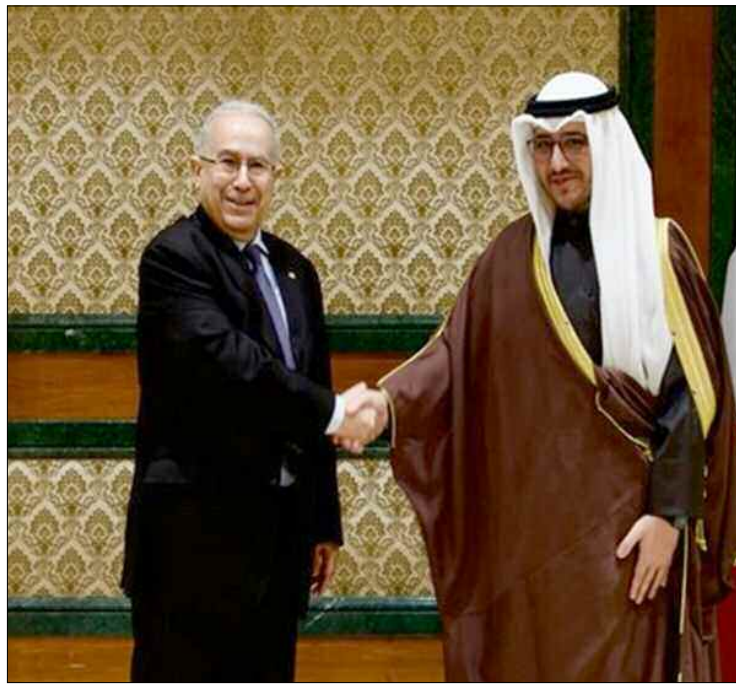
□ Lamamra a été reçu au deuxième jour de sa visite au Koweït par le vice-Emir de l'Etat du Koweït.

Une réunion au terme de laquelle le ministre des Affaires étrangères et de la Communauté nationale à l'étranger, Ramtane Lamamra, a été reçu au deuxième jour de sa visite au Koweït en sa qualité de représentant spécial du président de la République, Abdelmadjid Tebboune, par le vice-Emir de l'Etat du Koweït, le prince héritier Cheikh Mechaal Al-Ahmed Al-Djaber Al-Sabah, ainsi que par le Premier ministre, Cheikh Sabah Khaled Al-Hamad Al-Sabah.