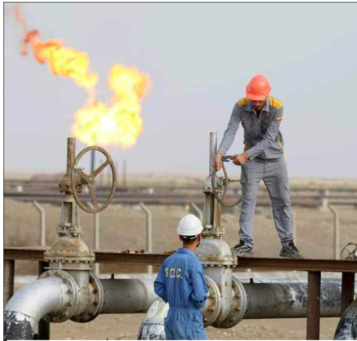
■ Ce train haussier pourrait durer encore plus, si l'Iran ne revient pas sur le marché au cours de cette année.

La décision des pays membres de l'Opep+ sera sans surprises pour les investisseurs qui estiment que l'offre des pays producteurs est très limitée pour des raisons techniques et financières. Recul des investissements et baisses des rendements qui empêchent même l'Arabie saoudite de compenser les pertes des autres pays. D'où le maintien depuis des mois de leur plan de production prudent et modeste, malgré les appels récurrents des Etats-Unis et d'autres pays consommateurs de revoir à la hausse les quotas d'extraction. Le ralentissement des investissements dans le secteur des éner-