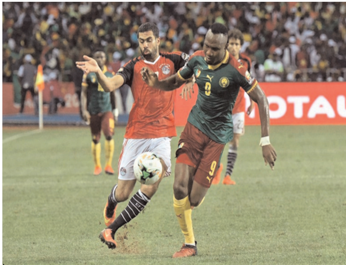
□ □ Egypte-Cameroun, de la revanche dans l'air.

Le Burkina Faso, quant à lui, ne fera pas le spectacle ce soir pour le plaisir de le faire, mais plutôt pour relever un défi lancé dès son arrivée au Cameroun, en l'occurrence celui de remporter la Coupe CAN-2021. « L'aventure ne s'arrêtera pas à ce niveau, celui de la demi-finale mais en finale. Décidée elle aussi à fran-