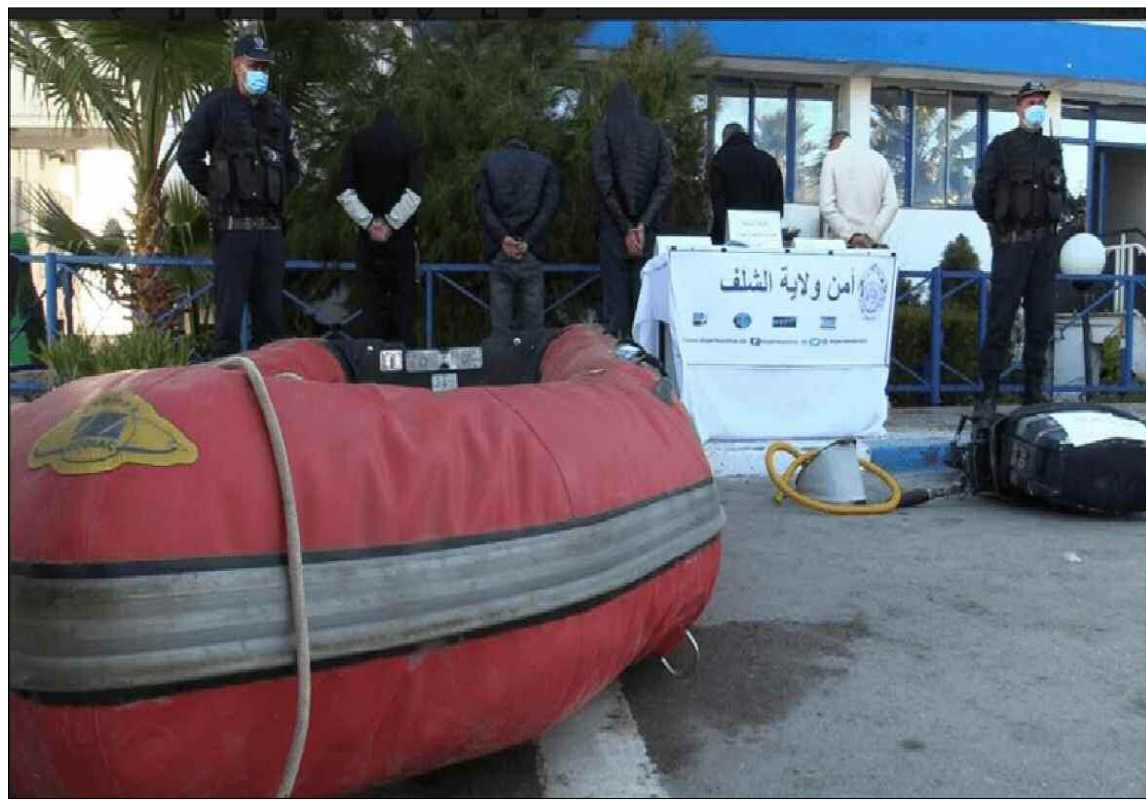
La brigade criminelle a arrêté cinq individus âgés de 30 à 65 ans issus de la wilaya de Chlef.

Le chargé de l'information, le commissaire de police Chérif Ankoud a précisé dans une déclaration à l'APS que les éléments de la brigade criminelle ont arrêté, dans le cadre de ses efforts de lutte contre le phénomène de l'émigration clandestine, cinq individus âgés de 30 à 65 ans issus de la wilaya de Chlef et de certaines wilayas de