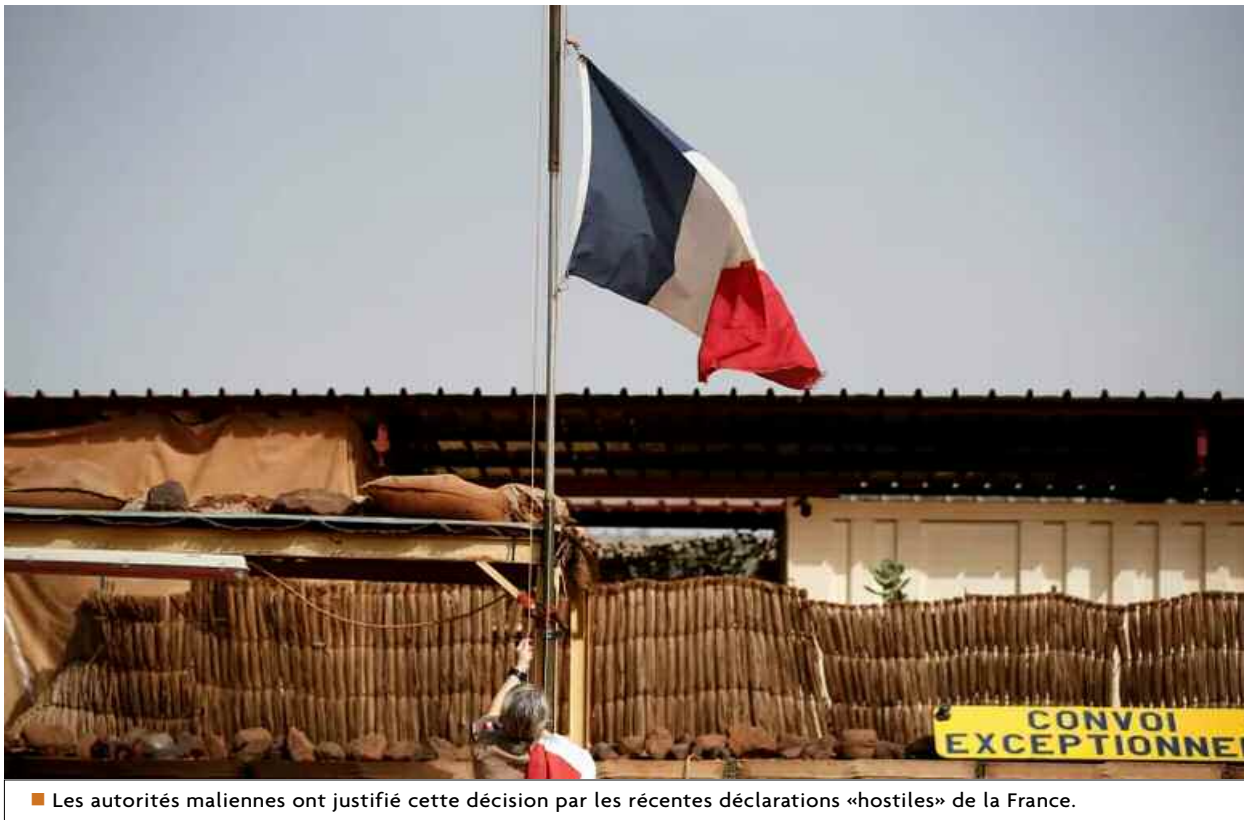
■ Les autorités maliennes ont justifié cette décision par les récentes déclarations «hostiles» de la France.

Les autorités maliennes ont invité l'ambassadeur de France de quitter le pays, dans une nouvelle escalade de la brouille entre Bamako et Paris, a annoncé lundi la télévision d'Etat.