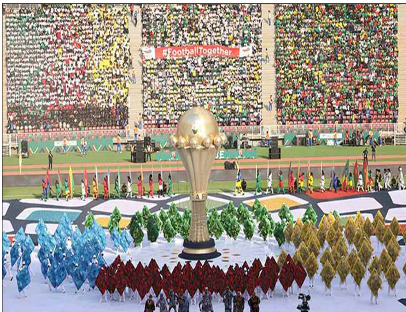
■ La CAN a eu lieu malgré tout...

Plus que quelques jours pour que le rideau tombe sur la CAN-21. La compétition qui avait fait couler beaucoup d'encre et surtout susciter le plus de commentaires et d'analyses. Une CAN, loin de ressembler aux précédentes. La tentative de l'éteindre a fait beaucoup de vacarme dans les clubs européens avec en arrière plan la FIFA marquée par la complicité de quelques présidents de Fédérations africaines. Le coup de ciseau est vite donné par l'Association européenne des clubs qui annonce la couleur en mettant en marche la menace de faire reporter, voire même annuler la CAN. Mais en face, en chef de file, nul autre que Samuel Eto'o, au moment où les Fédérations qui manifestent un soutien indéfectible au président de la FIFA, ne soufflent mot.