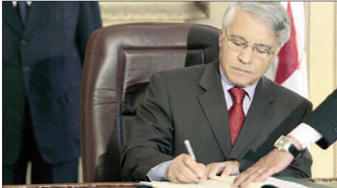
Le Trésor public a réclamé plus de 127 milliards de DA à titre de dédommagement par les sociétés poursuivies dans l'affaire de l'ancien ministre de l'Energie Chakib Khalil.