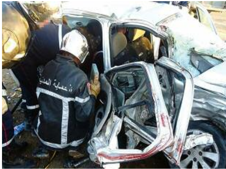
centre hospitalo-universitaire (CHU) Benbadis, au chef-lieu. Une enquête a été ouverte par les services de sécurité territoriale compétents afin de déterminer les circonstances exactes de l'accident.

Il s'agit d'une collision entre un camion poids lourd et un véhicule de tourisme causant le décès sur le coup de trois (3) personnes (deux hommes et une femme), a précisé à l'APS le responsable du service de prévention de ce corps constitué, le capitaine Abderrahmane Lagraâ, tandis que la quatrième victime, de sexe féminin, qui était gravement touchée, a succombé à ses blessures après son évacuation en urgence au