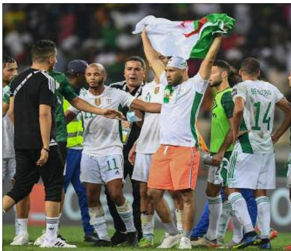
Les Verts pourront compter sur leurs supporters au Cameroun.

La partie ne sera pas un jeu de dés, loin s'en faut, puisqu'il s'agit de décrocher une qualification au Mondial. Mais attention, «deux nations majeures du continent, et avec elle ses joueurs phares». L'une comme l'autre, dans cette double confrontation, l'Algérie