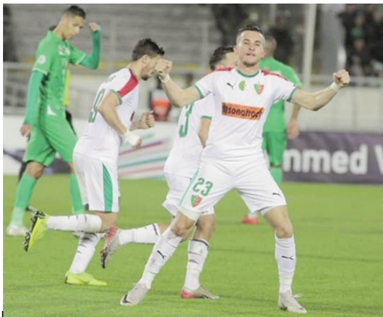
■ Frioui a signé à lui seul cinq des huit réalisations.

À Constantine, le CSC a mis un terme à sa période de disette. Les Sanafir ont profité de la réception de la lanterne rouge, le WA Tlemcen en l'occurrence, pour renouer avec la victoire (5-0), la première sous l'ère Madoui. À l'instar du MCA, les gars de l'Antique