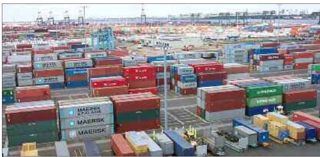
Le chef de l'Etat a interdit l'exportation des produits de large consommation qui commencent à manquer dans les rayons des commerces dans plusieurs pays du monde et chez nous.

Malgré les discours rassurants des ministres du Commerce et de l'Agriculture et du Développement rural, ces dernières semaines, en affirmant la disponibilité de réserves suffisantes de blé et d'autres produits alimentaires pour plusieurs mois encore, le consommateur, sous tension à chaque fin du mois, craint de ne plus pouvoir payer son plein de course même quotidien si l'envolée des prix se poursuit à ce rythme. En réponse à cette inquiétude et pour amortir le choc de l'inflation qui grignote chaque jour un peu plus du pouvoir d'achat des Algériens, le président de la République, Abdelmadjid Tebboune, a décidé de prendre de nouvelles mesures additionnelles, plus ciblées en faveur des ménages, mais aussi des agriculteurs et des investisseurs. Il s'agit de l'interdiction de l'exportation des produits importés par l'Algérie en vue de contrôler les prix au niveau intérieur, contre l'inflation et préserver sa population d'une crise alimentaire qui menace l'humanité depuis le début de la guerre en Ukraine et l'embargo sur le blé russe et les restrictions prises par certains