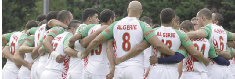
■ L'Algérie vise le titre africain.

«Le match amical face aux Ivoiriens, sera une excellente étape préparatoire, en raison de la bonne qualité de l'adversaire», a indiqué à l'APS le sélectionneur sénégalais des «Verts». Avant d'ajouter : «La Côte d'Ivoire est l'une des quatre meilleures sélections africaines, ce qui constitue un véritable test pour situer le niveau de l'Algérie parmi les ténors de l'Afrique. Le match sera très disputé entre deux sélections qui se connaissent parfaitement bien, car tous les joueurs ivoiriens évoluent dans le Championnat français».