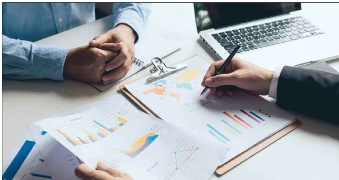
Les coûts de création de l'entreprise sont l'une des principales sources de difficultés auxquelles sont confrontés les jeunes porteurs de projets.

«Près de 370 porteurs de projets bénéficieront de fonds supplémentaires pour la création de leurs start-ups», a fait remarquer le ministre délégué auprès du Premier ministre chargé de l'économie de la connaissance et des start-ups. Evoquant la mise en