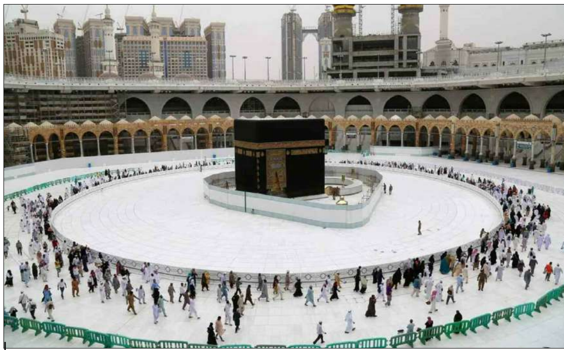
■ L'ouverture de la saison de la Omra va permettre aux agences algériennes de voyage qui se consacrent à ce créneau de reprendre leurs activités pratiquement à l'arrêt de puis de longs mois.

L'ouverture de la saison de la Omra pour les Algériens était envisagée par les pouvoirs publics depuis quelques jours. Le Premier ministre examinait cette question, en coordination avec le Comité scientifique chargé du suivi de l'évolution de la pandémie Covid-19. La question de l'accomplissement du rite de la Omra avait été évoquée également par le ministre du Tourisme et de l'Artisanat, Yacine Hammadi, à l'écoute des préoccupations des agences de tourisme de voyages notamment celles qui sont concernées par l'ouverture de l'activité du Hadj et la Omra. Il avait expliqué que cette question fait partie des prérogatives de l'Office national du pèlerinage et de la Omra (Onpo) relevant du ministère des Affaires religieuses et de Wakfs, sachant que près de 800 agences de tourisme et de voyage activent dans ce domaine. De son côté, Youcef Belmechdi avait adressé une correspondance, dans ce sens, au Premier ministre qui attendait l'avis des membres du Comité scientifique, avant de se prononcer sur la possibilité d'autoriser la programmation de vols pour l'accomplissement du rite de la Omra. Il y a un peu plus d'un mois, le ministre des Affaires reli-