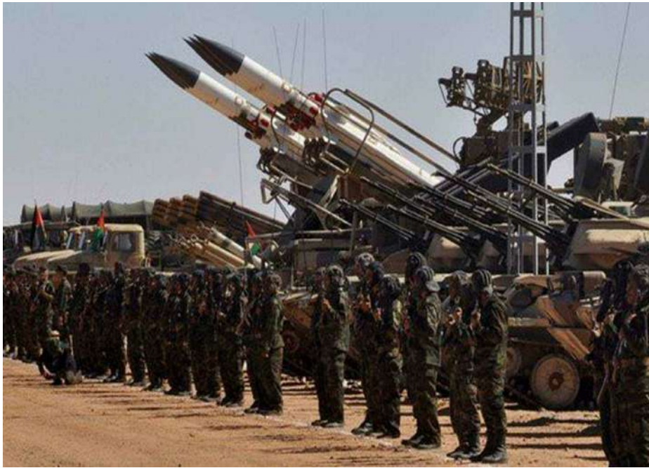
■ L'armée sahraouie continue d'attaquer les forces marocaines d'occupation.

Dans une déclaration officielle, le directeur national de la sécurité, de la documentation et de la protection des institutions sahraouies, Sidi Ougal, a indiqué qu'«une des mines de l'armée d'occupation marocaine qui polluent les terres de la République sahraouie, a explosé mercredi dans la région de Djirriya, à Smara occupée, tuant trois civils et en blessant un quatrième». Une personne a été tuée sur place, tandis que les autres ont été transportées à l'hôpital régional de Smara, avant que les deux Sahraouis ne succombent à leurs blessures, rapporte l'agence SPS. Les mines marocaines continuent de tuer exceptionnellement des citoyens sahraouis, alors que Rabat refuse de signer des accords internationaux pour éliminer cette arme destructrice. Au cours des dernières années, les mines enfouies le