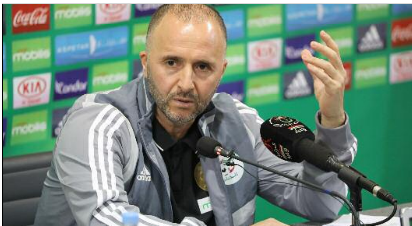
■ Belmadi est resté vague sur le choix des joueurs.