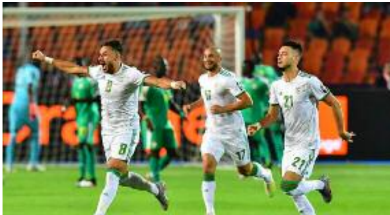
■ Les Verts veulent retrouver le sourire.