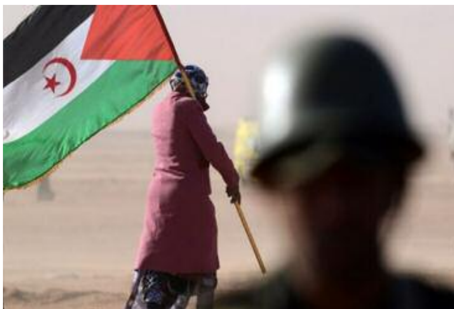
■ Virement de position de l'Espagne et du Maroc sur la question du Sahara occidental.

«Le gouvernement de la République sahraouie et le Front Populaire de libération de Saguia El-Hamra et du Rio de Oro (Front Polisario) ont été informés avec étonnement, vendredi passé, du contenu des deux déclarations émises par l'occupant marocain et le gouvernement de la puissance administrante espagnole», déclare la présidence sahraouie dans un communiqué publié par l'agence de presse SPS. «La position exprimée par le gouvernement espagnol est absolument en contradiction avec la légalité internationale. Les Nations unies, l'Union africaine, l'Union européenne, la Cour internationale de justice, la Cour européenne de justice et toutes les organisations régionales et continentales ne reconnaissent pas la (prétendue) souveraineté marocaine sur le Sahara Occidental», précise la déclaration. «L'Espagne, avec la France, a plus de responsabilités juridiques et politiques que d'autres dans la défense des frontières internationales reconnues et la lutte contre l'expansion marocaine. Cette responsabilité ne s'éteint pas tant que le peuple sahraoui n'aura pas pu exercer son droit inaliénable à l'autodétermination et à l'indépendance», souligne la même source. Et d'ajouter : «La position exprimée dans les deux déclarations manque de cré-