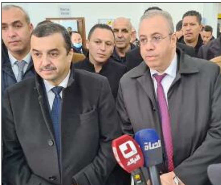
■ Mohamed Arkab : «La couverture électrique de la wilaya de Médéa est insuffisante».

Accompagné de Mohamed Arkab, le ministre de l'Énergie et des Mines, Ahmed Zeghdar a inspecté l'entreprise minière locale, Arab Metals SPA, spécialisée dans la transformation des métaux non ferreux. Une société qui emploie 155 travailleurs et qui ambitionne d'augmenter ses capacités de production. «Arab Metals SPA produit annuellement 12.000 tonnes de cuivre, 2.000 tonnes de zinc et 5.000 tonnes d'alliage avec un taux d'intégration de 88%», note le communiqué du ministère de l'Industrie.