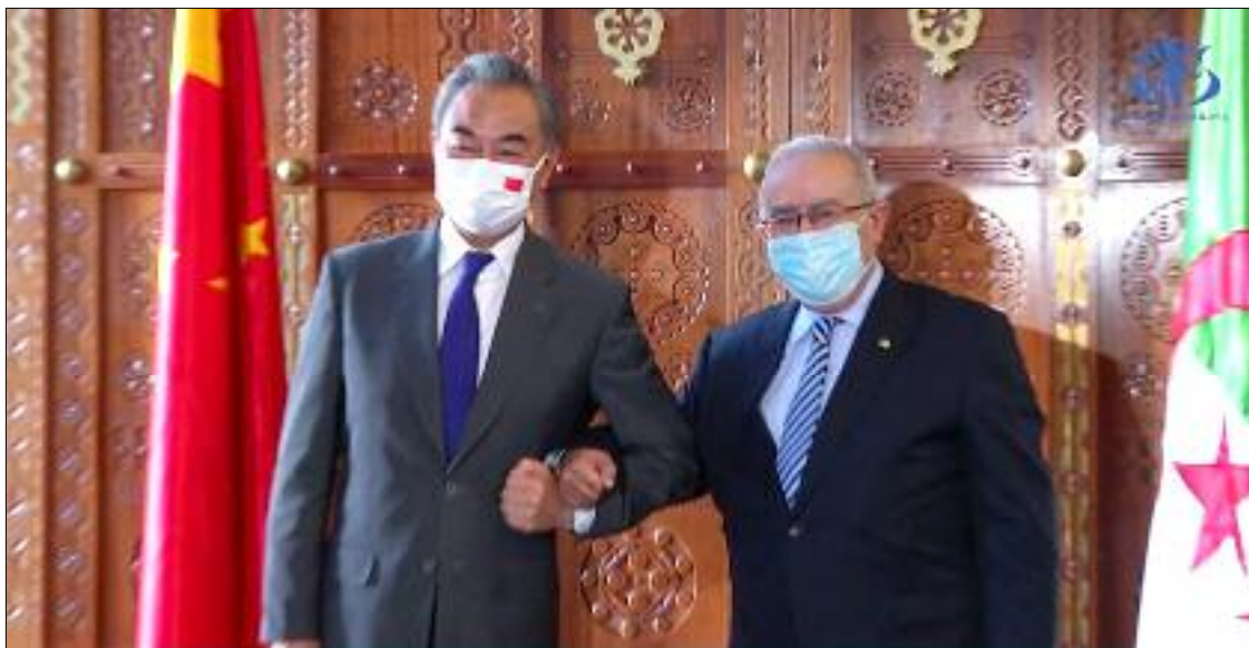
Les deux ministres vont procéder à un échange de vues approfondis sur les relations algéro-chinoises et les questions régionales et internationales d'intérêt commun, et de parvenir à un large consensus sur nombre de problèmes.

a félicité l'Algérie qui accueillera le prochain Sommet arabe le 1 er novembre 2022. La Chine a exprimé son soutien au rôle positif de l'Algérie pour promouvoir l'action arabe commune et faire face