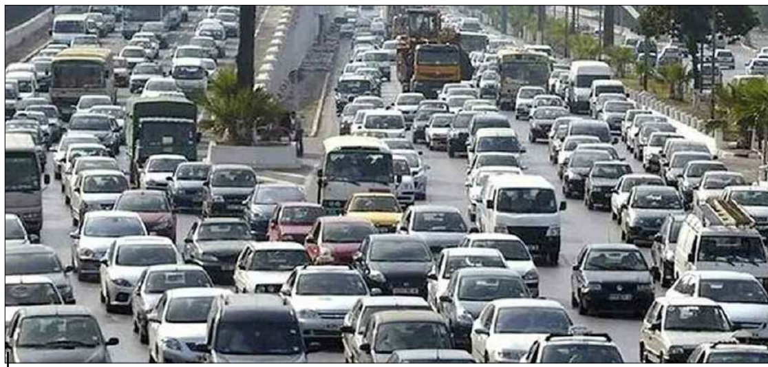
La réunion présidée par le chef du Gouvernement a vu la présentation d'un projet de Décret exécutif portant déclaration d'utilité publique l'opération relative à la réalisation de deux trémies à Chéraga.

Selon un communiqué des services du Premier ministre datant d'avant-hier, la réunion présidée par le chef du Gouvernement a vu la présentation d'un projet de Décret exécutif portant déclaration d'utilité publique l'opération relative à la réalisation de deux trémies à Chéraga, wilaya d'Alger. Ce projet vital pour le réseau routier de la capitale, qualifié de véritable remède face aux grands