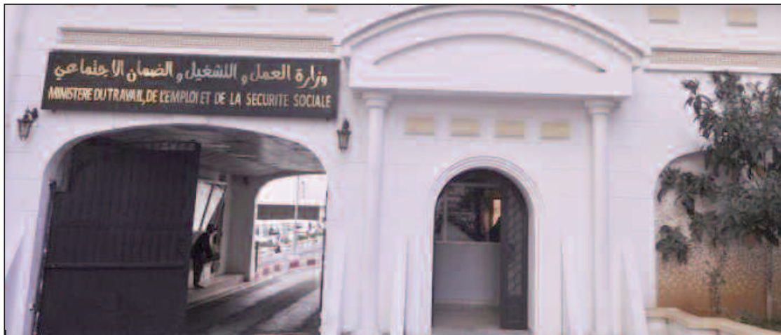
Les organisations syndicales qui se prononcent sur une grève doivent être enregistrées légalement et remplir les conditions de représentativité.

La Confédération des syndicats algériens (CSA), lit-on à travers ce communiqué, n'a pas reçu, à ce jour, le récépissé d'enregistrement de sa déclaration de constitution lui permettant d'activer lé-