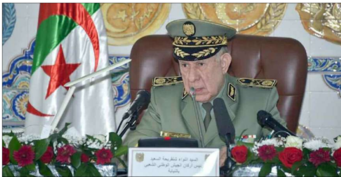
■ Chanegriha : L'ANP «poursuit l'exécution d'un large et ambitieux programme de modernisation et de renouvellement des capacités de son corps de bataille».

L'ANP «poursuit l'exécution d'un large et ambitieux programme de modernisation et de renouvellement des capacités de son corps de bataille», ajoutant que l'ANP «est totalement consciente que l'Algérie est bien plus qu'un simple territoire géographique, mais constitue une présence ci-