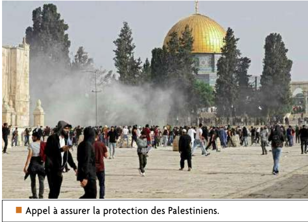
■ Appel à assurer la protection des Palestiniens.

De nouvelles violences de la police du régime sioniste ont visé vendredi matin des Palestiniens sur l'Esplanade des Mosquées à Al Qods occupée.