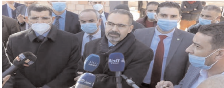
Le MJS a tenu à rassurer son monde.

Tous les moyens ont été mis en œuvre pour permettre aux sportifs d'élite de bénéficier de stages de préparation à l'étranger, a-t-il ajouté, faisant état de la mobilisation d'une enveloppe de 170 milliards cts pour la préparation des athlètes d'élite.