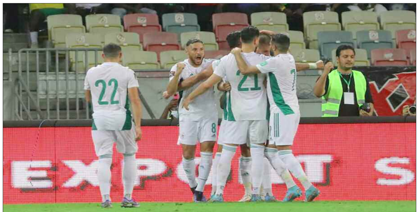
■ Les supporters voulaient accompagner les Verts à Doha.

Ce n'est certainement pas ce 21 ou l'autre 21 ou encore celui de 2026 qui feront taire les Algériens, ou faire porter atteinte à ce magnifique mariage entre la nation et son Equipe nationale pilotée depuis 2018 par un sélectionneur algérien, en l'occurrence Djamel Belmadi, qui promet de revenir plus que jamais, décidé à surprendre. Les informations qui tombent sur les réseaux sociaux sont vite disqualifiées, il est vrai que la vitesse de circulation pose aussi un problème nouveau face à un cas presque aussi nouveau, il se présente comme un test grandeur nature. C'est tout le monde qui cherche la meilleure place, celle de contredire l'autre celle qui s'infiltre dans le sillage des circuits de la concurrence. «On n'arrive plus à suivre. L'information qui affiche un optimisme est vite remise en cause, détruite. Elle devient inaudible, brouillée, mais personnellement, je me réfère à l'information qui est donnée par quelques médias étrangers ou par l'APS», déclarait amicalement un étudiant avant qu'une de ses collègues enchaîne «les journalistes devront, à mon avis, com-