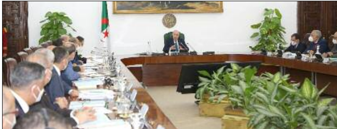
■ Fin septembre dernier, le Gouvernement a examiné un avant-projet de loi relatif à la liberté syndicale et à la protection du droit syndical, à la prévention et au règlement des conflits collectifs de travail.

Il s'agit également, lit-on à travers le communiqué du Conseil des ministres, de créer une plateforme logistique permettant la mise en œuvre du contenu de la loi qui apporte un véritable plus à l'action syndicale, telle que consacrée par la Constitution de 2020. « Les mutations en cours en Algérie exigeaient une nouvelle organisation du domaine syndical qui puisse garantir les droits et les obligations des personnels et protéger les intérêts de la société », a affirmé le chef de l'Etat. Relevant, l'impératif de définir, avec précision, dans cette loi, les attributions et limites de l'exercice syndical, en vue d'éviter tout chevauchement entre ce qui est professionnel et ce qui est purement pédagogique dans les secteurs, comme prouvé par les expériences passées. S'agissant de la révision des mesures relatives à l'allocation chômage, le chef de l'Etat a salué les