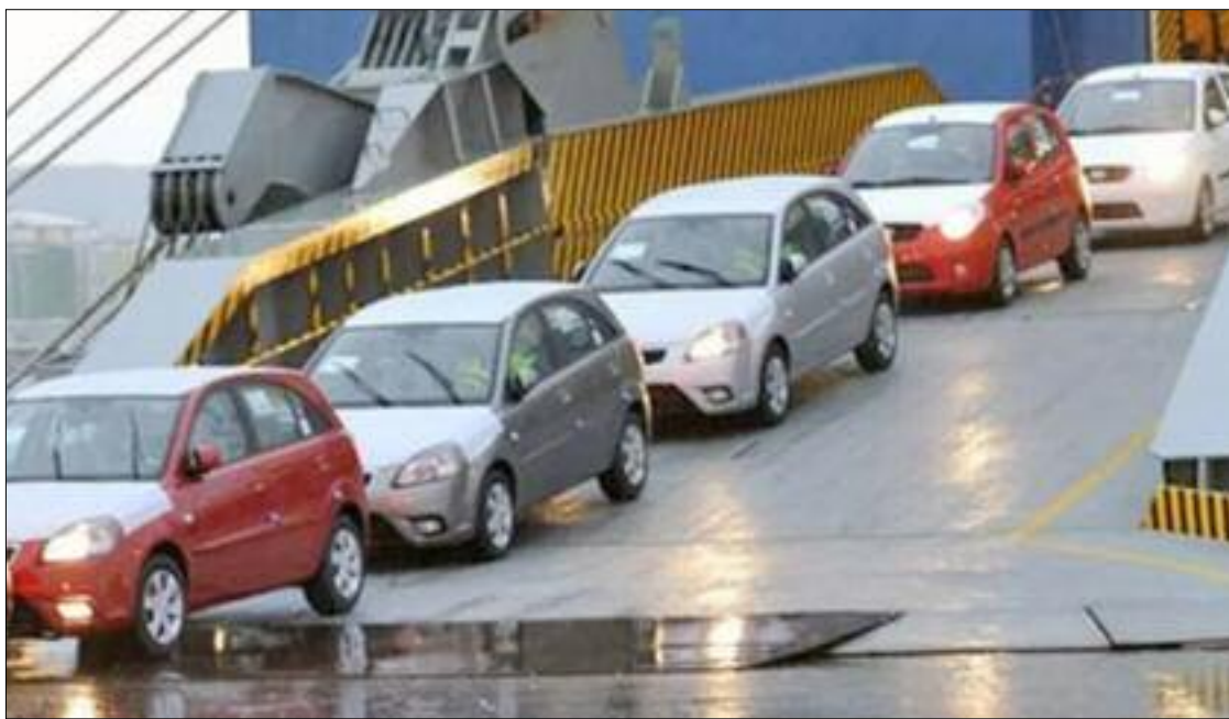
■ Tebboune a ordonné de veiller «à ce que l'exportation des voitures depuis l'Algérie après leur importation ne se fasse pas au détriment du marché national, des besoins des citoyens et avec les fonds du Trésor public».

Les conditions et modalités d'exercice de ces deux activités