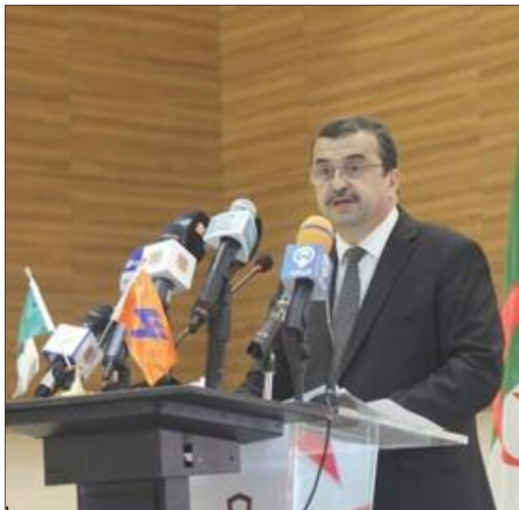
■ Arkab a assuré que «les préparatifs étaient en cours pour la mise en œuvre de la feuille de route relative au développement de l'hydrogène».

Concernant, dans ce cas, l'état d'avancement de la mise en œuvre de cette feuille de route, le