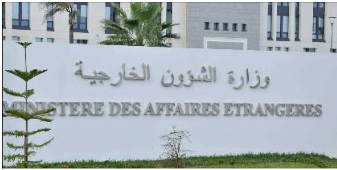
■ Tebboune : «L'Algérie n'intervient jamais dans une médiation si elle n'est pas sûre du résultat. Nous espérons que les deux parties au conflit acceptent la médiation».

S'exprimant dans une interview accordée à la chaîne d'information qatarie "Al Jazeera", le chef de l'Etat a évoqué les relations diplomatiques de l'Algérie au double plan régional et international. Faisant savoir que l'Algérie était un Etat "pacifiste" qui œuvre, a poursuivi Abdelmadjid Tebboune, à évoluer dans un contexte marqué de plusieurs défis sécuritaires le long de ses frontières, menacées, et dans son entourage géographique, notamment dans cette conjoncture internationale complexe. «L'Algérie était un Etat, pacifiste et neutre, adoptant le principe de