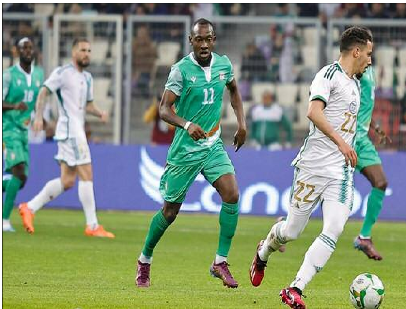
Petite balade pour les Verts avant la séance vidéo.

La CAN-2023 est déjà en piste, en attendant d'atteindre sa vitesse de croisière, les équipes embarquées dans les différents groupes, tentent de se maintenir pour éviter des chutes pré-