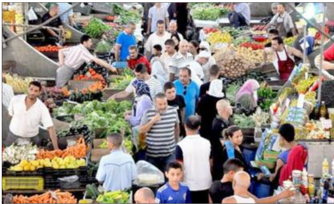
■ Le nombre de points de vente des viandes rouges importées à l'occasion du mois sacré devrait dépasser les 1.100 DA à l'échelle nationale, selon les indications données par les responsables de cet établissement.

Autre action en faveur des ménages : mercredi, des espaces ont été aménagés à Alger pour une opération de vente directe «du producteur au consommateur» de différents produits de pêche et d'aquaculture, à travers 23 points de vente permanents, en sus de ceux au niveau des ports et des marchés du Ramadhan. Il s'agit d'une opération nationale qui concerne globalement 388 points de vente répartis sur 32 wilayas, dont les wilayas du Sud, et qui sera élargie à 39 wilayas durant le mois sacré. Cette opération se poursuivra après le Ramadhan. De son côté, l'Algérienne des