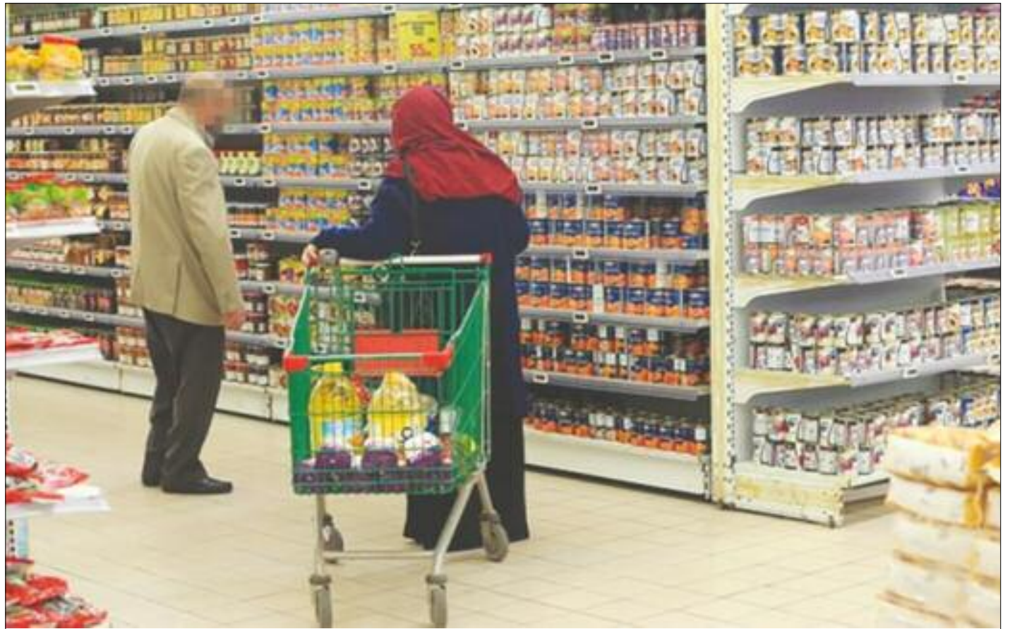
■ S'agissant des prix des biens alimentaires, ces derniers ont enregistré une hausse de 2,0% en février 2023 par rapport au mois précédent qui a inscrit un taux dans les mêmes proportions (+1,9%).

Depuis que le Gouvernement avait pris la décision d'importer de la viande bovine et ovine depuis le Brésil, le Soudan et de quelques pays du Sahel, dans le but de réguler les prix marché national et répondre à la forte demande de la viande rouge attendue durant ce mois sacré, les citoyens ont été surpris et déçus à la fois face à l'absence totale de la viande rouge dans les étals des boucheries. Et pour cause, la viande rouge importée depuis le Brésil censée répondre aux besoins des consommateurs algériens à un prix de 1.200 DA/kg proposé et fixé à l'avance, est tout simplement inexistante au niveau des boucheries du pays. Vendues que dans les points de vente appartenant à l'Onilev, les grandes quantités de vaches importées du Brésil avant d'être sacrifiées à travers des abattoirs du pays, n'ont pas