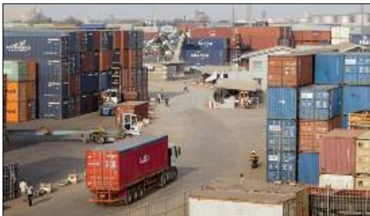
■ L'Etat a décidé, en 2022, de durcir davantage les conditions d'exercice de l'activité d'importation en vue de réorganiser le secteur des importations.

Pour rappel, l'Etat a décidé, en 2022, de durcir davantage les conditions d'exercice de l'activité d'importation en vue de réorganiser le secteur des importations n'autorisant que l'importation des produits non fabriqués localement ou qui ne couvrent pas les besoins du marché. En parallèle, encourager la production nationale et l'exportation. C'est ce qu'a affirmé, le 27 mars dernier, le ministre de tutelle, Tayeb Zitouni, lors de son passage au Forum de la Radio algérienne assurant, à