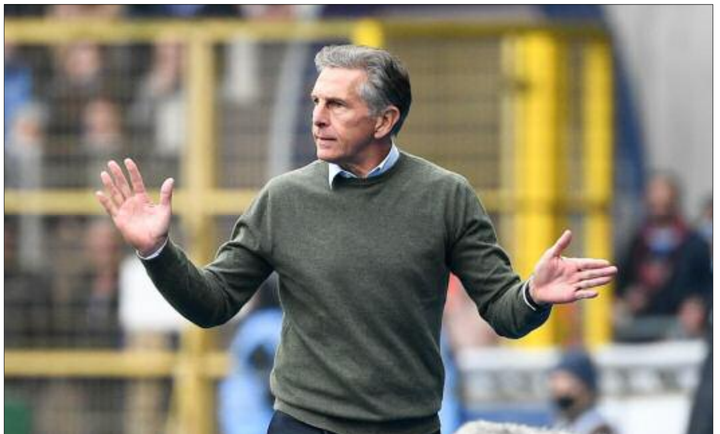
■ Claude Puel est devenu coach sans le vouloir.

Puis vint le moment où il découvre que «beaucoup d'entraîneurs de haut niveau n'ont pas vécu de carrière de joueur». Il estime alors que «ce n'est pas une obligation. Souvent, ce sont des gars qui n'ont pas fait carrière... Donc non, il n'y pas d'exclusivité aux anciens joueurs pour ce métier. Mais, dira-t-il, c'est positif, ça permet de voir différentes approches du football».