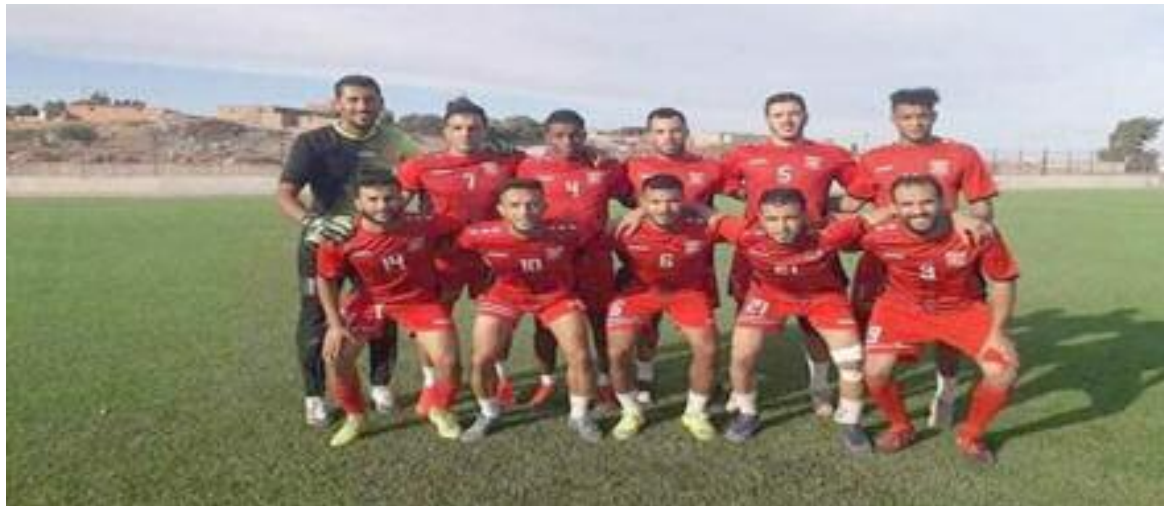
Le Croissant Club de Sig est exposé à la déperdition.

Du coup, les Sigois comptent désormais dans leur compteur six petits