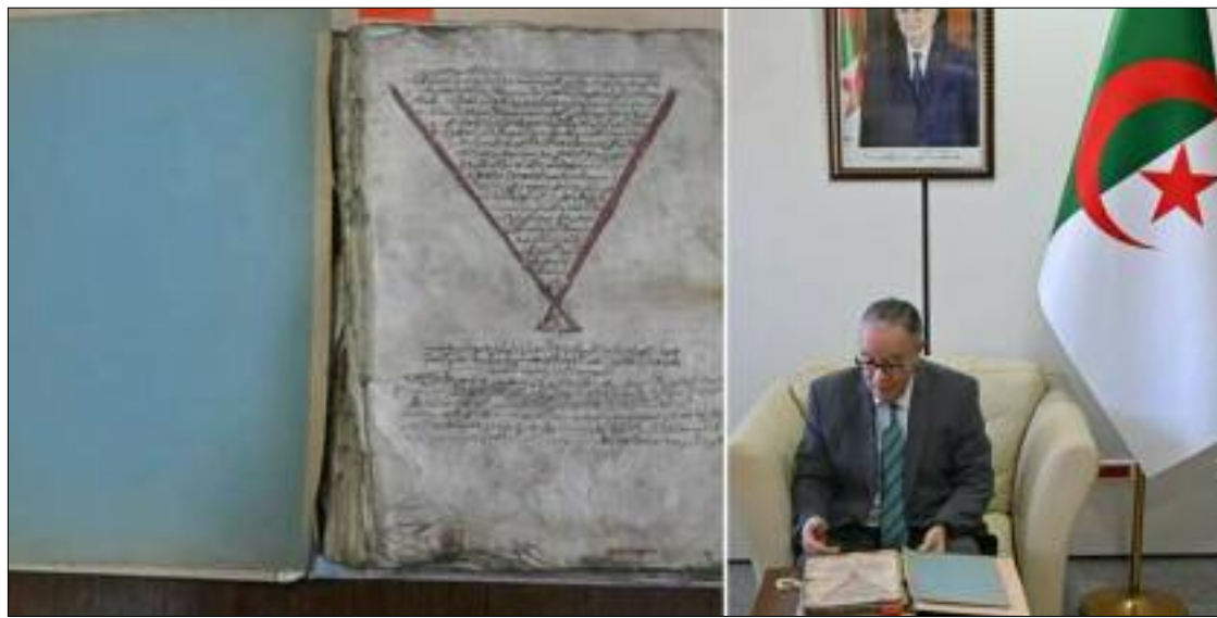
« Il s'agit d'un objectif suprême qui revêt une dimension souveraine et constitue une priorité absolue parmi les engagements du Président Abdelmadjid Tebboune, d'édifier une Algérie Nouvelle ».

Il ajoutait : « Une note rédigée en 1842 (dans le « français » de l'époque) dans une calligraphie médiévale et dans un style ampoulé, triomphal et prétentieux accompagne ce manuscrit et