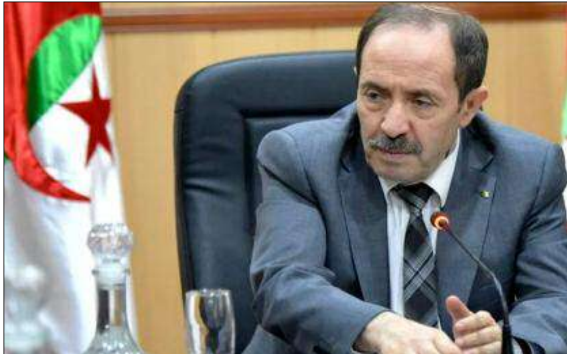
■ Belaabed a assuré que les affectations budgétaires allouées à tous les établissements éducatifs et directions sont suffisantes pour remédier aux lacunes et payer les honoraires des employés.

Ordonnant, à l'occasion, à l'inspecteur général d'arrêter le calendrier des visites d'inspection aux établissements éducatifs