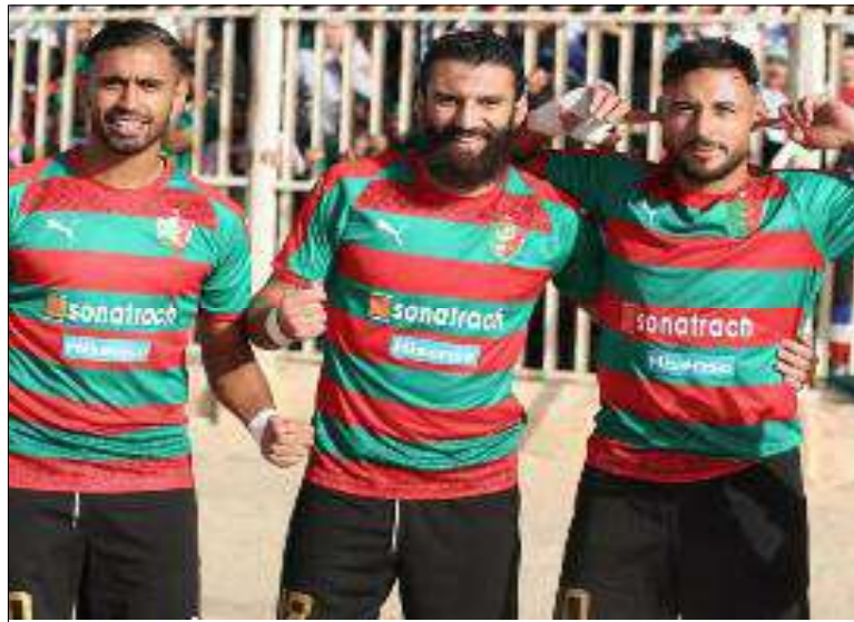
Le MC Alger a pris le large en tête de la Ligue 1 Mobilis.