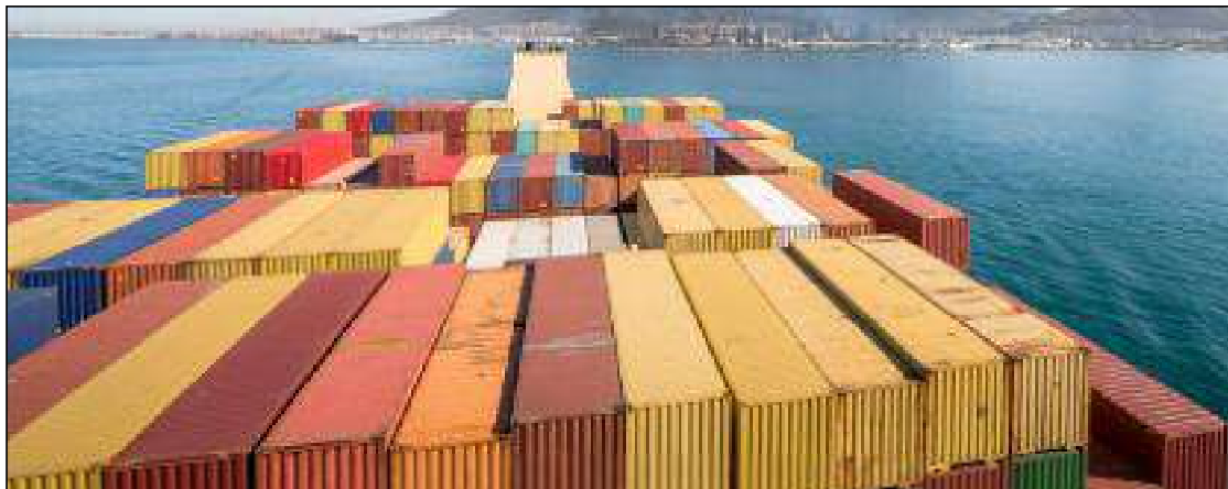
■ Zitouni: « Nous avons pu contenir et rétrécir même le volume des opérations du marché des importations et, en revanche, nous avons exporté davantage de produits nationaux hors-hydrocarbures... »

« Nous avons pu contenir et rétrécir même le volume des opérations du marché des importations et, en revanche, nous avons exporté davantage de produits nationaux hors-hydrocarbures, tout comme nous avons créé une banque de données et une plateforme numérique pour réguler le marché des importations. Nous avons, également, transformé de nombreux importateurs en fabricants nationaux et nous allons, également, lancer une car-