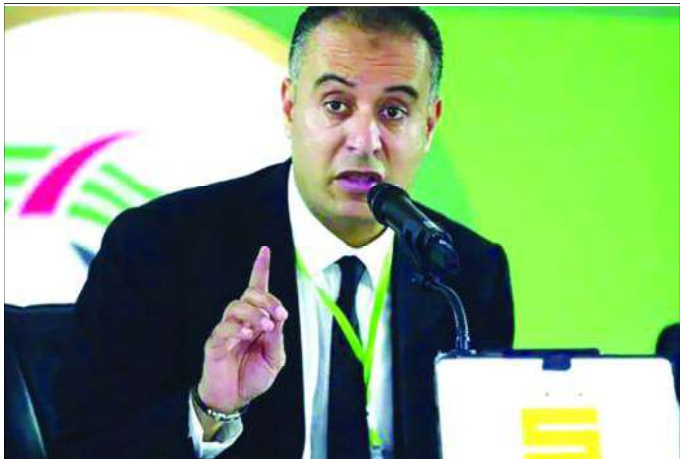
■ La FAF est déterminée à franchir le pas pour minimiser les erreurs d'arbitrage.

«Je ne pardonne plus les erreurs d'arbitrage, je suis prêt à renvoyer tout le monde à la maison. Le temps de l'impunité est révolu, il est temps de revoir ce corps», a affirmé le président de la FAF, à l'APS. La Commission fédérale d'arbitrage se fait aussi entendre à travers les premières sanctions, lesquelles ne devront pas se limiter à l'ar-