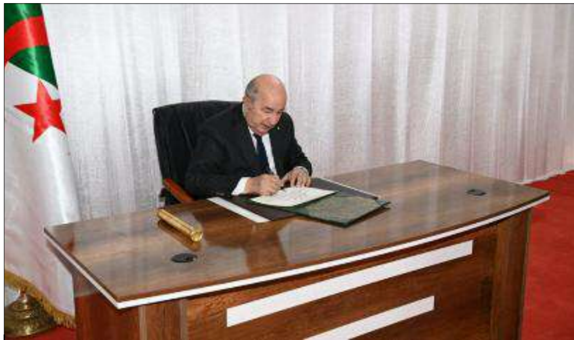
■ Dans le contexte actuel de menaces variées pesant sur notre pays, il est impératif d'avoir une presse responsable capable d'assumer son rôle, tout aussi crucial que celui des forces de sécurité veillant sur l'intégrité de notre territoire...

Le Prix du Président de la République du Journaliste professionnel qui est une résultante de cette reconnaissance, ne se soustrait pas à l'importance de sa dimension symbolique ; il porte simultanément des messages politiques puissants tant à l'intérieur qu'à l'extérieur. Il souligne la constance de la vision démocratique de l'État algérien, qui a toujours cherché à consacrer la liberté d'expression et des médias, ainsi que le pluralisme médiatique, concrétisant ainsi sa volonté.