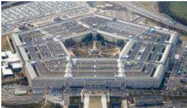
■ Pentagone, quartier général du ministère de la Défense US.

Le département américain de la Défense au Pentagone a averti, fin novembre 2023, que le manque de fonds et de restriction des dépenses en vertu de lois temporaires menacent les opérations des forces américaines et leur capacité à fournir un soutien à Israël et à l'Ukraine, ainsi que dans d'autres domaines de leur déploiement dans le monde.