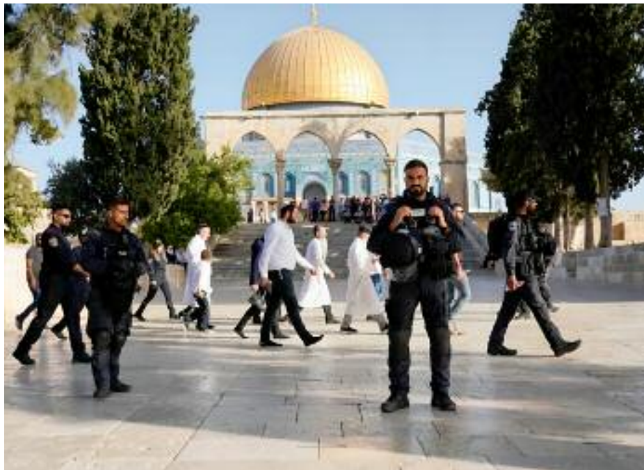
Le gouvernorat de Jérusalem a mis en garde contre les conséquences de l'incursion dans la mosquée Al-Aqsa par des associations coloniales fanatisées.

riode, les autorités d'occupation ont rendu 85 décisions d'assignation à résidence, 68 décisions d'expulsion de la ville de Jérusalem et d'autres décisions d'interdiction de voyager.