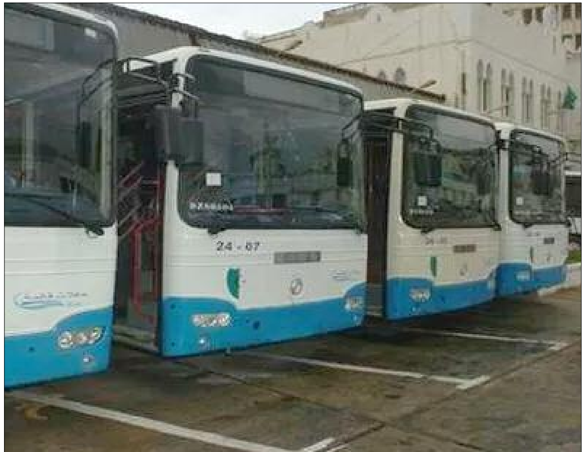
Le ministre des Transports, Mohamed El Habib Zahana annoncé, samedi depuis Adrar, la dotation de 35 nouveaux bus au profit de l'Entreprise de transport urbain et suburbain (ETUSA).

Lors de cette visite, le ministre s'est également enquis de la qualité des prestations produites au niveau de la Gare routière d'Adrar, où il a salué l'utilisation de la numérisation pour la réservation et le paiement électroniques, soulignant que le ministère avait consacré des enveloppes financières à la maintenance des gares routières afin de moderniser leurs services, leur permettre d'améliorer leurs performances et gérer leurs services de manière autonome. Après avoir suivi un exposé sur la situation et les défis auxquels fait face le secteur dans la wilaya, M. Zahana a affirmé que son département ministériel a mobilisé, dans le cadre de sa stratégie de promotion du secteur, toutes les ressources matérielles et humaines nécessaires pour garantir des services de qualité aux normes internationales, à travers la fourniture de divers équipements, la formation des personnels, l'entretien et la modernisa-