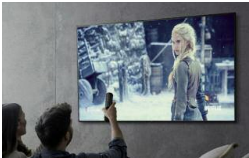
Le Smart TV LG UHD 4K avec sa combinaison de performances de pointe et de design élégant.

Plongez dans une nouvelle ère de divertissement à domicile avec le tout dernier bijou technologique de LG : le Smart TV LG UHD 4K. Avec sa combinaison de performances de pointe et de design élégant, ce téléviseur promet de redéfinir vos attentes en matière de qualité d'image et de fonctionnalités.