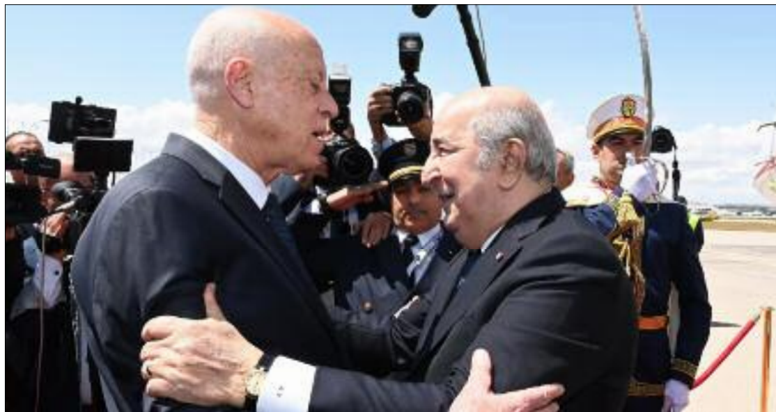
■ Il avait été décidé de la tenue d'une rencontre maghrébine tripartite, tous les trois mois, la première en Tunisie après le mois du Ramadhan. C'est dans cette continuité que s'inscrit la réunion tripartite d'hier à Tunis.

Il s'agit d'une démarche qui repose sur les efforts soutenus que mène l'Algérie, sous la conduite du Président Tebboune, pour relancer l'action commune dans le cadre du Maghreb arabe, renfor-