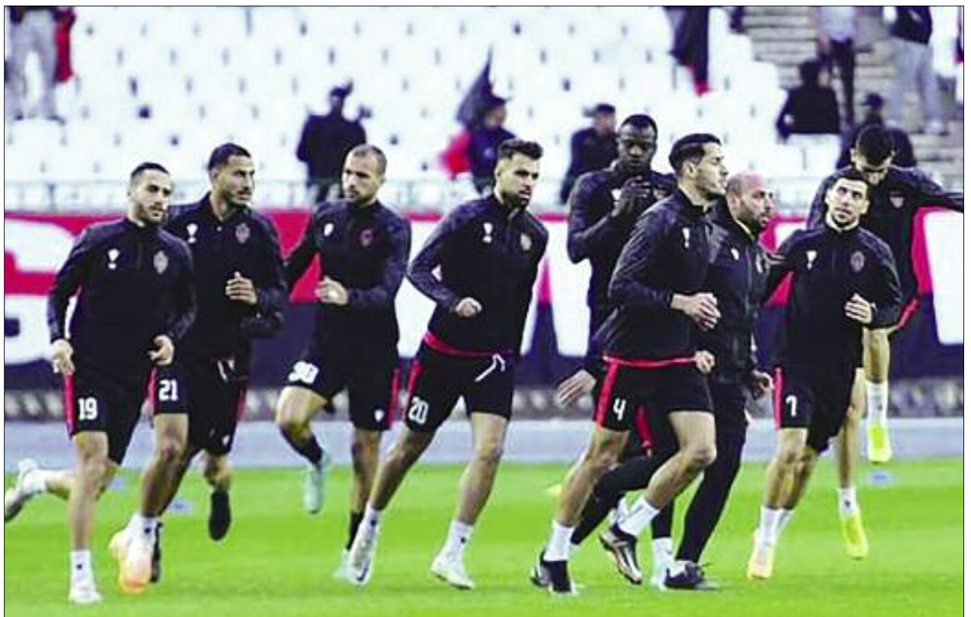
L'USMA s'est contentée d'un galop d'entraînement devant ses supporters.

Ce dimanche, c'est une histoire qui déshabille Lakdjaa et ses compères, qui ordonne à ses joueurs, en dépit de la réglementation, de quitter le pays, tant pis pour la demi-finale aller de la Coupe de la