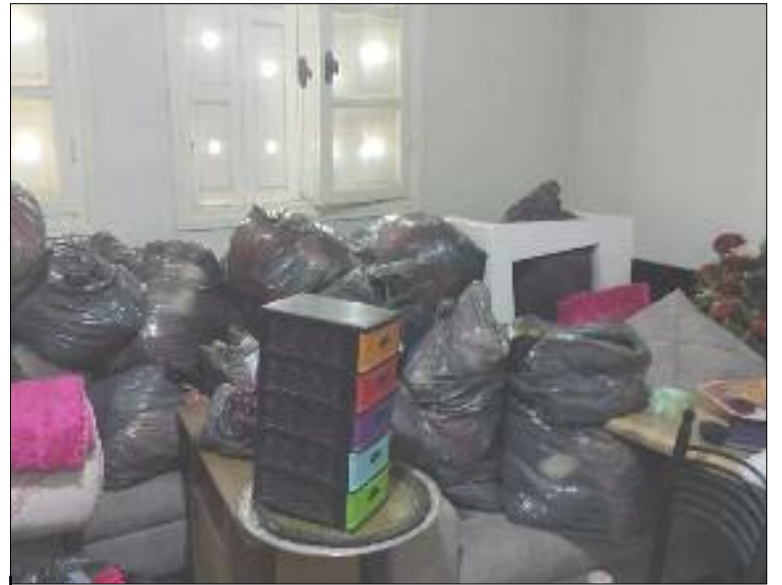
■ Six mois après avoir été pris en charge par les autorités, la famille de l'ex-gendarme risquent de se retrouver le mois prochain à la rue.

« C'est vraiment choquant d'entendre de tels propos d'un responsable censé en principe d'aider les membres d'un ex-gendarme qui a consacré toute sa vie au service de la nation et de l'Etat », a indiqué un représentant de la société civile. Grâce à l'intervention du directeur du Cabinet du wali de Batna, la famille de l'ex-gendarme a reçu la visite des membres de la commission de distribution de logement, il y a quelques mois mais depuis, rien n'a été fait, selon nos sources. Pour rappel, la famille en question traverse une situation désastreuse quelques mois seulement après le décès du chef de la famille. Selon un représentant de la société civile qui a pris attache avec la rédaction du journal, les membres de la famille de l'ex-gendarme risquent de se retrouver le mois prochain