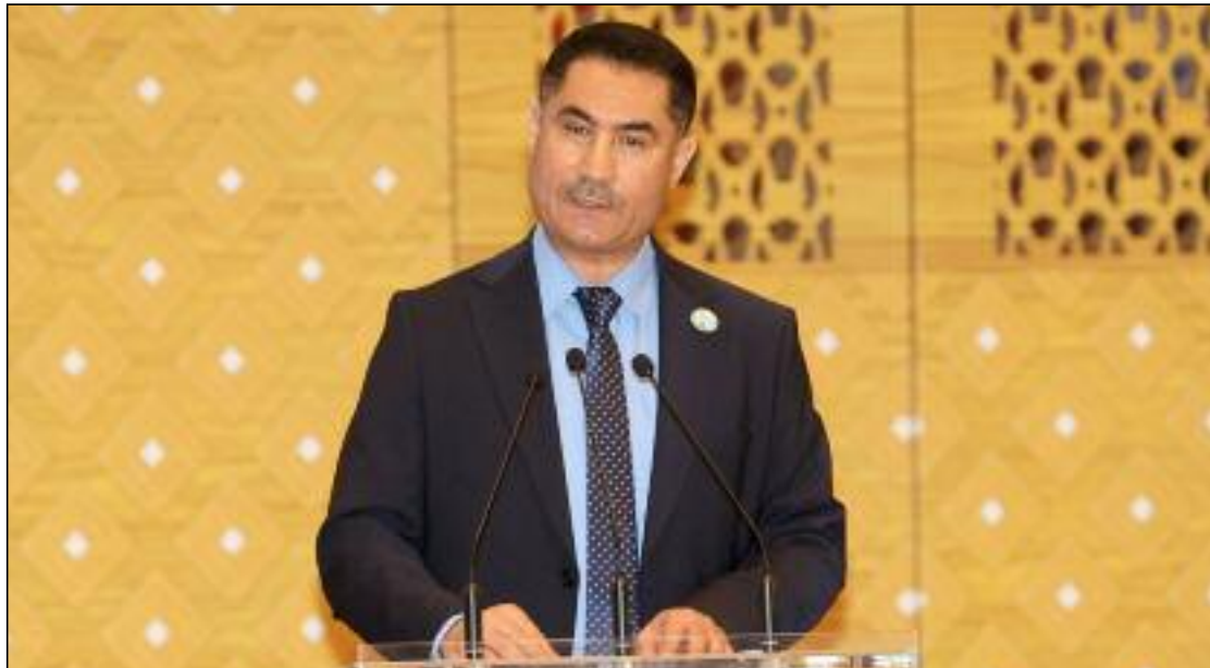
■ Laâgab a mis en avant l'engagement de l'Etat à accompagner la presse notamment l'actualisation des lois et les différentes mesures prises par le Président Tebboune au profit des médias nationaux, sous forme d'aide indirecte.

dicats qui représentent les journalistes dans l'amélioration des conditions de travail de la corporation et la promotion de ce métier, le ministre de la Communication a mis en avant l'engagement de l'Etat à accompagner la presse notamment l'actualisation des lois et les différentes mesures prises par le président de la République, Abdelmadjid Tebboune au profit des médias nationaux, sous forme d'aide indirecte. Faisant remarquer que la presse privée demeure indissociable de la presse nationale.