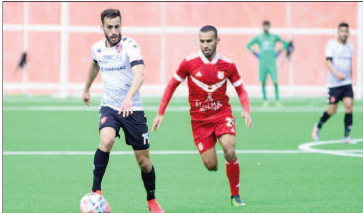
■ Le CRB et l'USMA vont se rencontrer pour la 12e fois en Coupe.

→ La deuxième demi-finale de la Coupe d'Algérie de football 2023-2024, prévue aujourd'hui mercredi, offrira une belle affiche entre pensionnaires de la Ligue 1 Mobilis : CR Belouizdad-USM Alger, avec l'enjeu pour chaque formation de composer son ticket pour la grande finale.