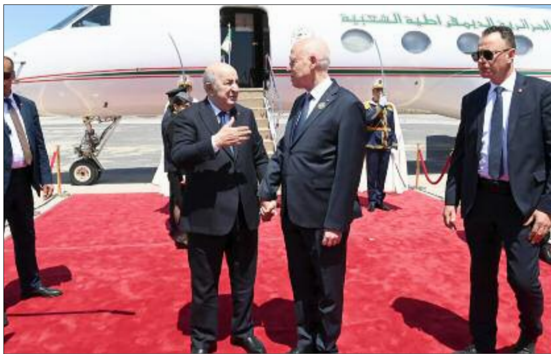
■ Un Communiqué final a «condamné avec force les violations quotidiennes flagrantes, les crimes de guerre et le génocide commis contre le peuple palestinien frère».

Les dirigeants des trois pays ont «exprimé leur rejet total des ingérences étrangères dans les affaires libyennes et leur soutien aux efforts visant à parvenir à l'organisation des élections à même de préserver l'unité et l'intégrité territoriale de la Libye et de garantir sa sécurité, sa stabilité et sa prospérité, tout en soulignant le rôle pivot des pays voisins de la Libye en soutien aux autorités libyennes dans le processus de restauration de la stabilité et de la sécurité et dans les efforts de reconstruction». Ils ont également «mis en garde contre le danger des interventions étrangères dans la région sahélo-saharienne et leurs répercussions sur la paix dans les pays de la région et dans le monde», soulignant la nécessité «de soutenir la sécurité et la stabilité des pays de cette région, de protéger leur souveraineté na-