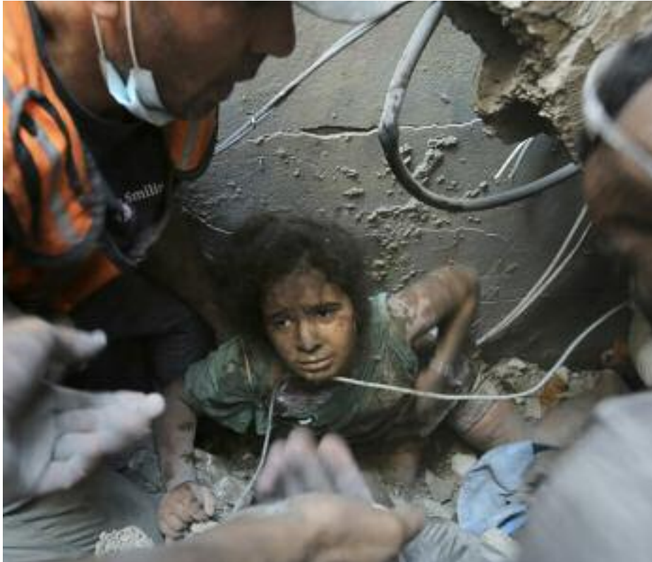
■ Destructons massives et famine à Ghaza.