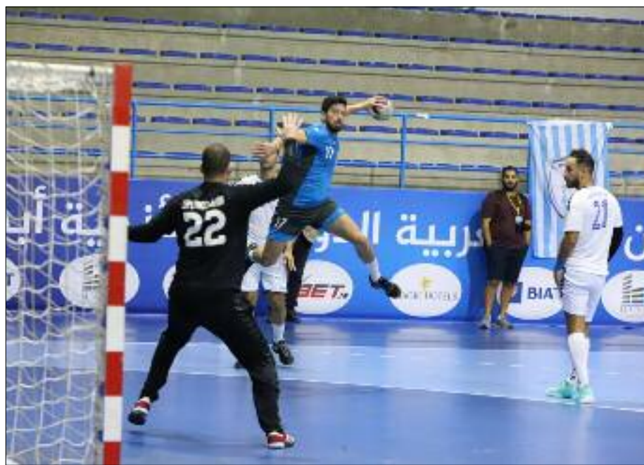
Ce succès permet aux Skikdis de rejoindre l'OMA à la deuxième place.

Par ailleurs, la JSE Skikda a pris le meilleur sur l'OM Annaba sur le score de 26-23 (mi-temps 12-10), lundi à la salle omnisports du complexe sportif «Miloud Hadeffi» d'Oran au titre de la 1ère journée du groupe A du tour principal. La première mi-temps fut très équilibrée, même si les Skikdis sont bien entrés dans le match en menant dès les premières minutes, mais sans pour autant prendre leur envol. Les Annabis, de leur côté, ont