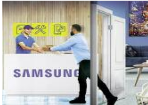
■ Samsung, leader mondial de la technologie.

Dans une démarche de simplification et d'accessibilité, Samsung a repensé son numéro vert en Algérie, qui est désormais le 0800 100 001. Ce changement vise à faciliter la communication avec ses clients et à simplifier le processus de contact pour une assistance rapide et efficace. Samsung consolide son engagement envers l'excellence du service client à travers un partenariat stratégique avec Webhelp, leader mondial des services d'externalisation et de gestion de l'expérience client. L'entreprise est l'un des acteurs majeurs qui se spécialise dans la fourniture de solutions innovantes pour améliorer la relation client, la gestion des processus métier et la transformation digitale. Samsung offre un service