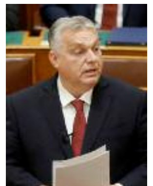
■ Le Premier ministre hongrois, Viktor Orbán.

par la chaîne de télévision M1. Auparavant, le gouvernement hongrois a déclaré à plusieurs reprises qu'il n'accepterait pas d'utiliser la prochaine tranche de 500 millions d'euros de la Facilité européenne pour la paix pour fournir une aide militaire à l'Ukraine. Budapest continue de bloquer ces fonds parce que Kiev n'a toujours pas garanti qu'il n'inclurait pas déraisonnablement des entreprises hongroises dans sa liste de «sponsors de guerre internationaux» établie par l'Agence nationale pour la prévention de la corruption. ■