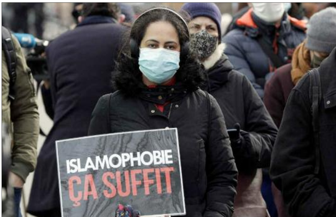
■ En France, la stigmatisation des Français musulmans et la haine de l'islam sont corrélées à l'implantation du sionisme conquérant et dominateur imprégné de suprémacisme et d'islamophobie.

En France, la stigmatisation des Français musulmans et la haine de l'islam sont corrélées à l'implantation du sionisme conquérant et dominateur. Au reste, c'est à cette époque que la laïcité a été érigée en arme de guerre contre les Fran-