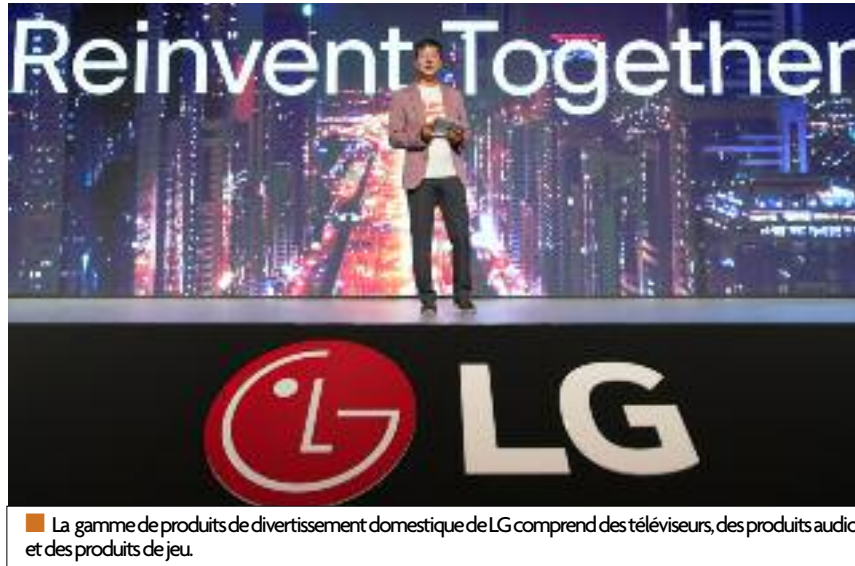
La gamme de produits de divertissement domestique de LG comprend des téléviseurs, des produits audio et des produits de jeu.