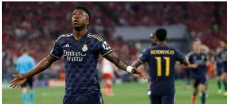
■ Vinicius Júnior, auteur d'un doublé.

→Après quatre années d'absence, le Bayern Munich a retrouvé à l'Allianz Arena, ce mardi 30 avril, le dernier carré de la Ligue des champions lors de la demi-finale aller contre le Real Madrid. Les Allemands ont fait match nul face au Real (2-2).