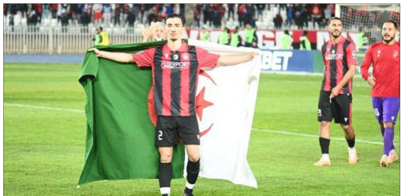
Une question de principe pour l'USMA.

Pour lui, il est plus que convaincu, le dossier pilule de virus qui veulent