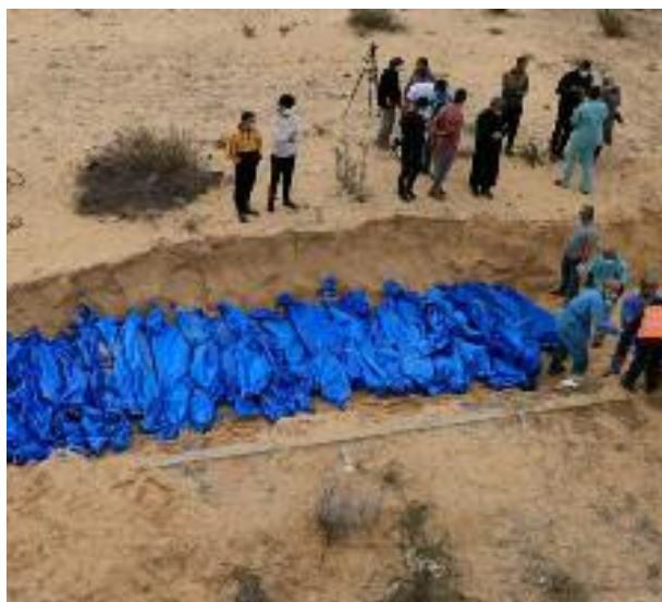
■ L'ONU, l'Union européenne, les États-Unis et la France ont appelé à une enquête indépendante sur les charniers de Gaza.

Les équipes d'ambulance et de secours qui ont participé à la récupération des corps des martyrs dans les fosses communes découvertes dans le complexe médical Nasser à Khan Yunes, dans le sud de la bande de Gaza, ont rapporté qu'il y avait des soupçons clairs de vol d'organes sur des cadavres.