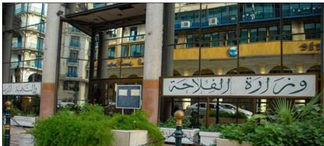
Siège du ministère de l'Agriculture et du Développement rural.