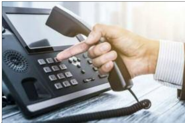
■ Si les vols de câbles causent des pertes financières énormes à Algérie Télécoms, ils paralysent également les usagers du téléphone et de l'internet.

Ce phénomène n'est pas nouveau dans la wilaya de Khenchela, nous avons déjà relatés des faits similaires dans le passé. Selon des responsables d'Algérie Télécom de cet époque, 17 actes de sabotage ont été relevés en dix mois indiquant qu'une quantité de 5462 mètres de câbles a été volée, estimées à plus de 10.585.000,00 DA. Ces actes n'ont pas touchés uniquement le chef-lieu de wilaya khenchela mais plusieurs communes, à savoir El Hamma, Ouled Rechache, Chechar, Aïn Touila, El Mahmel et N'sigha. En réplique à ces opérations malveillantes, les mêmes responsables d'Algérie télécoms ont indiqué avoir porté plainte auprès des services de sécurité et auraient installé des systèmes d'alarme. Lors de notre entretien avec les responsables d'Algérie Télécom de Khenchela, des travaux de soudure et de bétonnage