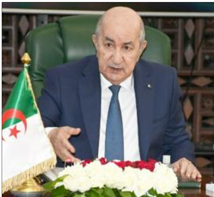
Le président Abdelmadjid Tebboune, dans une allocution, préside la cérémonie de célébration de la Journée à la Maison du peuple à la Place du 1 er Mai.

C'est le sens donné par le président Abdelmadjid Tebboune au 1 er Mai, dans une allocution, en présidant la cérémonie de célébration de cette Journée à la Maison du peuple à la Place du 1 er Mai, cet édifice imposant, symbole de l'histoire contemporaine de l'Algérie avec toute la symbolique, la lutte et la longue histoire qu'il porte, dirigée par des hommes honorables depuis le Mouvement national qui ont mis l'intérêt de la nation avant tout, citant des hommes honorables «de la trempe d'Aïssat Idir, qui ont placé l'intérêt national au-dessus de toute autre considération», a souligné le président Tebboune. Le président de la République a également rendu hommage, avec fierté, au sens élevé du patriotisme et à la grandeur d'âme du défunt Abdelhak Benhamouda,