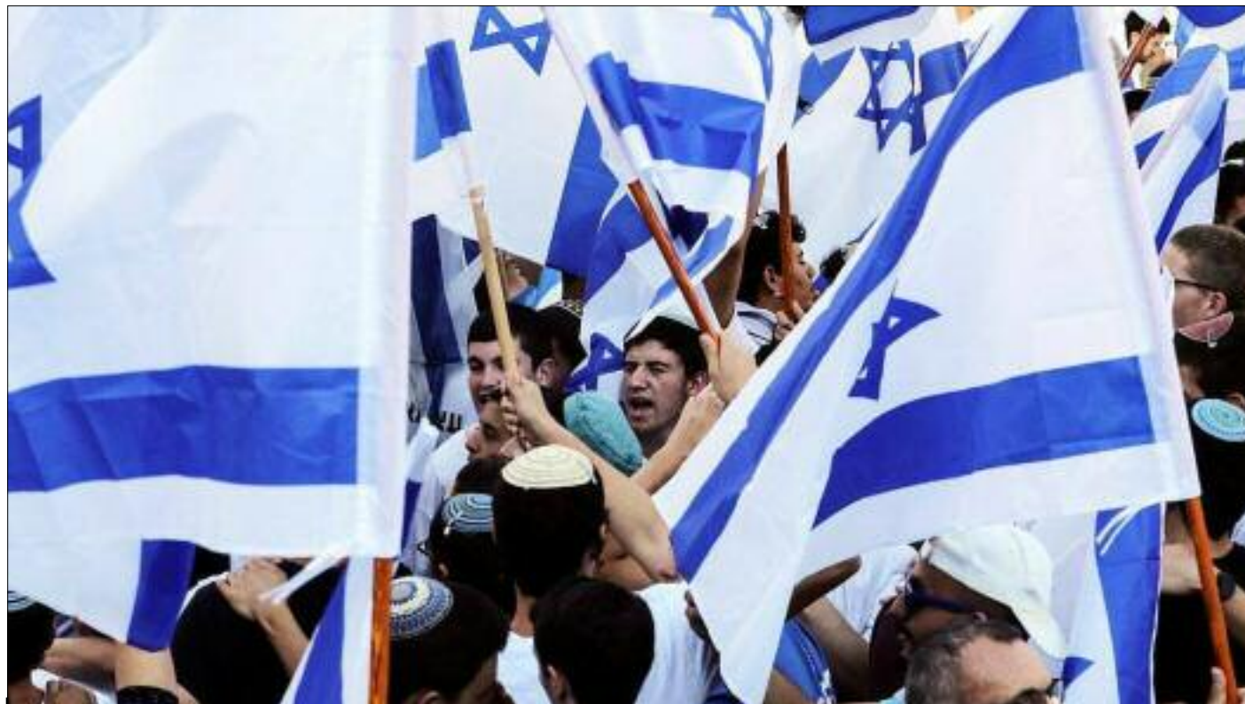
■ Une grande partie des reins récoltés au marché noir par les réseaux criminels sont destinés à des personnes vivant en Israël qui connaît une grave pénurie d'organes. Des réseaux criminels dirigés par des colons israéliens et des Européens de l'Est trafiquent sur les cinq continents.

Tout récemment, les soldats russes qui ont libéré la ville de Sviatogorsk près de Donetsk ont trouvé dans l'orphelinat des documents concernant la vente d'enfants. L'un des acheteurs était la société Coca-Cola. Raison de plus pour boycotter cette boisson. Des spetsnaz russes, qui pourtant ne sont pas des pieds-tendres, ont témoigné avec émotion qu'ils avaient découvert près d'Izioum, dans l'est de l'Ukraine, une « ferme d'élevage » pour enfants russophones âgés de trois à six ans et qui servait de centre de prélèvement d'organes dans les territoires qu'ils avaient libérés. Les enfants étaient découpés comme des lapins ou des gorettes. Des fosses ont été découvertes contenant les dépouilles. Des habitants de Bakhmout (Artiomovsk), près de Donetsk, ont témoigné eux aussi que les unités « Anges blancs » et « Phénix » de l'armée ukrainienne enlevaient les enfants russophones à leur famille, soi-disant pour les emmener dans un sanatorium ou en lieu sûr à l'étranger. Ces enfants n'ont jamais été revus. Les familles qui refusaient de livrer leurs enfants étaient menacées d'être abattues et beaucoup d'entre elles ont caché leurs enfants pour