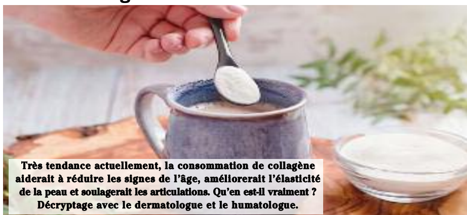
Très tendance actuellement, la consommation de collagène aiderait à réduire les signes de l'âge, améliorerait l'élasticité de la peau et soulagerait les articulations. Qu'en est-il vraiment ? Décryptage avec le dermatologue et le rhumatologue.

Prendre du collagène pour la peau et les articulations : miracle anti-âge ou effet de mode ?