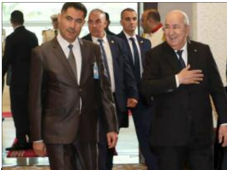
Le ministre a tenu à préciser, concernant l'alimentation du fonds d'aide destiné à la presse, qu'il n'était plus question qu'il ait pour source unique les fonds publics