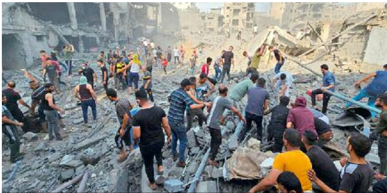
Le Pnud indique que le montant des dommages causés aux infrastructures dans la bande de Ghaza équivaut à 97% du PIB annuel

La Présidence palestinienne a salué jeudi la décision de la Colombie de rompre ses relations diplomatiques avec l'entité sioniste, après l'agression génocidaire menée par les forces d'occupation sioniste dans la bande de Ghaza et qui perdure depuis 7 mois.