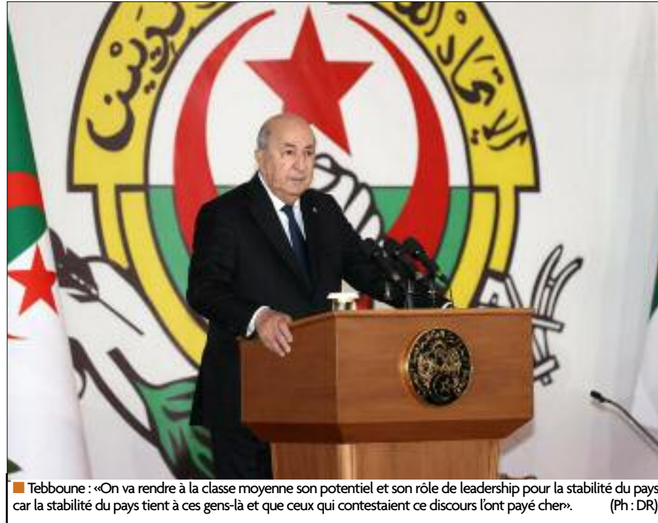
■ Tebboune : «On va rendre à la classe moyenne son potentiel et son rôle de leadership pour la stabilité du pays, car la stabilité du pays tient à ces gens-là et que ceux qui contestaient ce discours l'ont payé cher».

Oui, l'Algérie revient de loin et a bien failli disparaître en 2019, car le plan des membres de la Issaba visait «la vente des biens de l'État à leurs propres enfants, et recourant à l'importation et à la surfacturation», a continué le chef de l'État en donnant des exemples : «Nous avons trouvé des vieux pneus, des pierres et des décharges dans des conteneurs. L'identification des sociétés fictives est toujours en cours par les services des Douanes. Elles sont fictives mais bénéficiaient d'autorisations d'importation avec des registres du commerce fictifs ; nous sommes arrivés à un volume d'importation de 60 milliards de dollars annuellement», avant de conclure que le Hirak Béni, ce grand