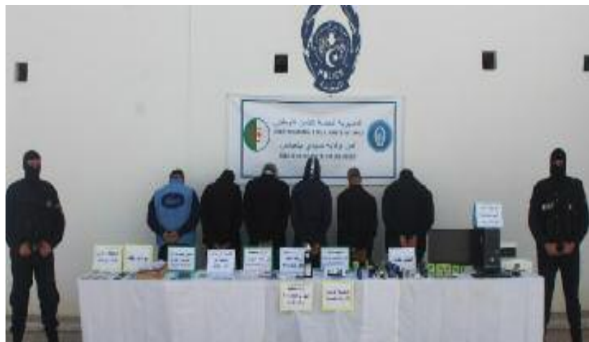
■ L'enquête policière a permis l'identification des suspects, leur arrestation et la saisie du matériel utilisé dans la contrefaçon.

Selon une information, un groupe de personnes falsifiaient des documents administratifs de différentes administrations officielles, après avoir imité leurs cachets administratifs et leurs documents officiels, pour des clients demandeurs de visa à inclure dans le dossier, tels que les contrats de location, registres commerciaux, documents fiscaux et documents bancaires, en échange de sommes d'argent, explique la source. L'enquête a permis l'identification des suspects, leur arrestation et la saisie du matériel et des outils utilisés dans la contrefaçon : un micro-