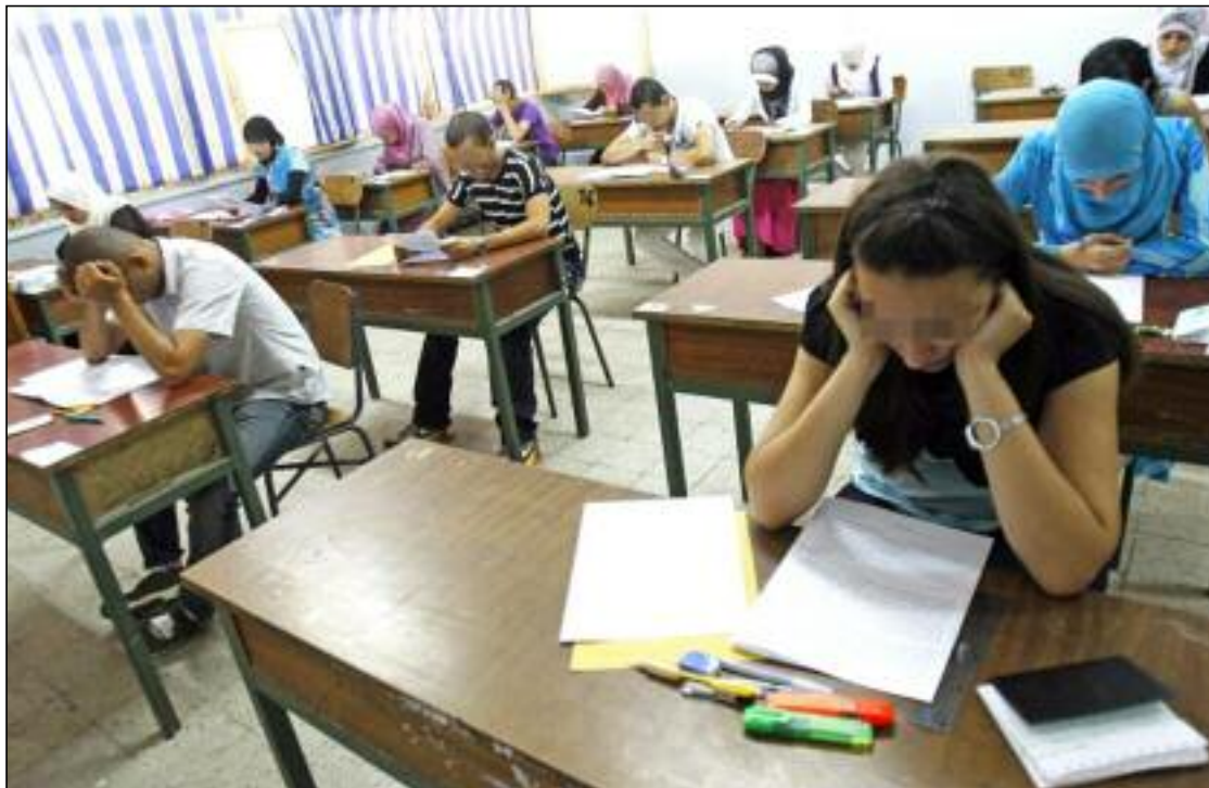
«Toutes les mesures organisationnelles, humaines et matérielles ont été prises pour assurer le bon déroulement des épreuves, y compris la mise en place d'un dispositif de suivi à plusieurs niveaux afin de garantir le maximum de rigueur».

S'exprimant lors d'une rencontre nationale sur les préparatifs des examens scolaires nationaux (session juin 2024),