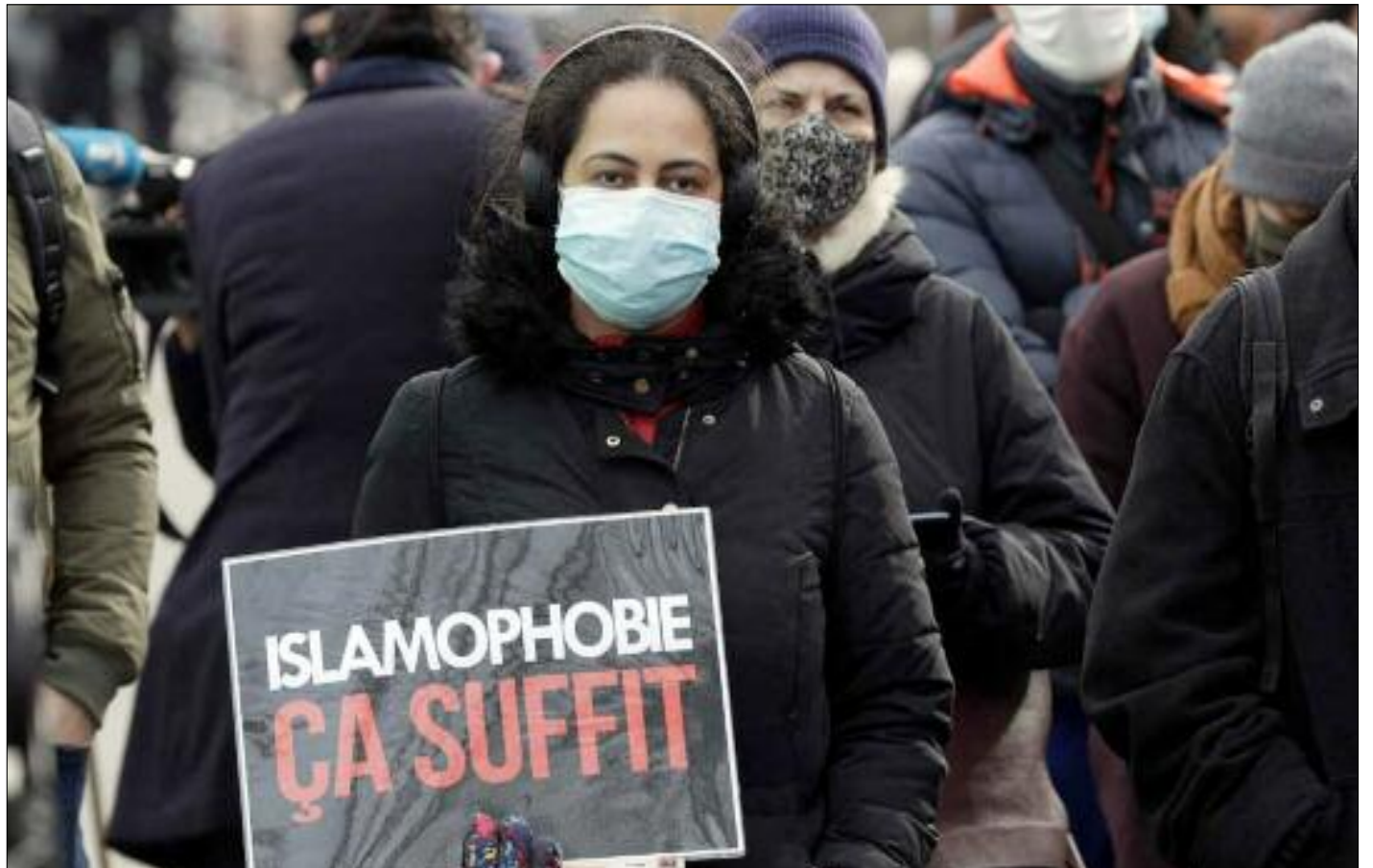
■ En France la stigmatisation des Français-musulmans et la haine de l'islam sont corrélées à l'implantation du sionisme conquérant et dominateur.

En France, la stigmatisation des Français musulmans et la haine de l'islam sont cor-