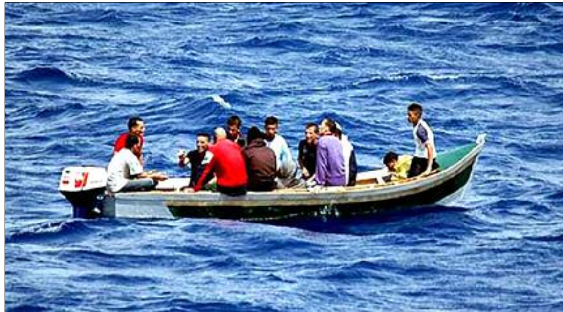
Traversée maritime clandestine.

Selon un communiqué rendu public par la Sûreté de wilaya de Mostaganem, à la suite d'une plainte déposée par une personne, victime d'escroquerie par un membre du réseau en lui piquant une somme d'argent estimée à 30 millions de centimes contre une traversée clandestine, les services de police de la localité balnéaire avaient été alertés sur les activités suspectes d'un groupe de trois personnes. La collecte d'informations et la surveillance exercée sur les suspects a permis aux policiers d'acquiescer la conviction qu'ils étaient face à un réseau de passeurs spécialisés dans l'organisation de traversées clandestines depuis les plages de Sidi Lakhdar. Les investigations diligentées par les enquê-