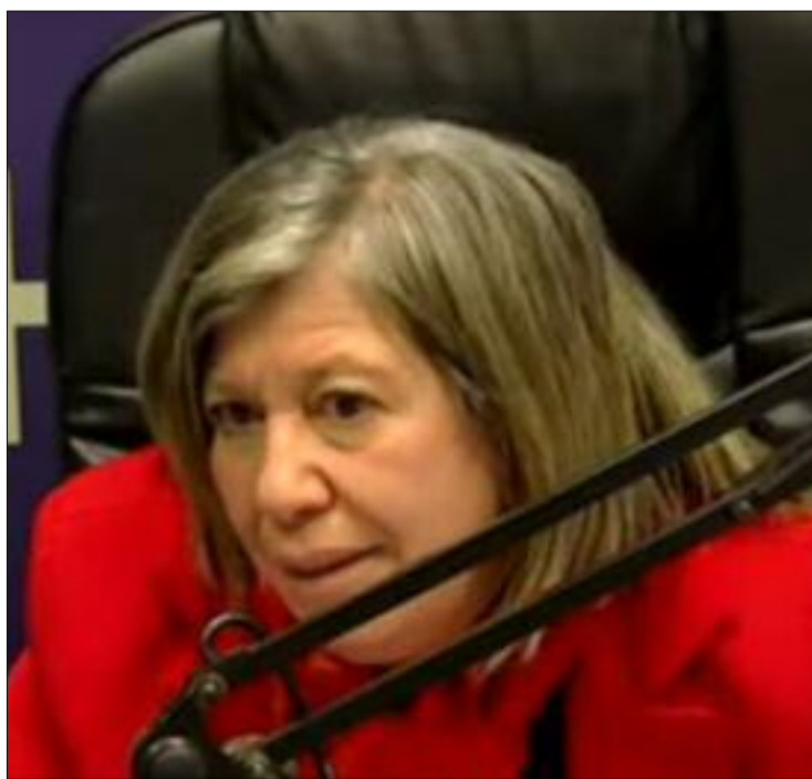
■ L'UGTA a initié une enquête nationale sur le stress au travail qui concerne tous les travailleurs sur le territoire national, tous les secteurs d'activités...

Cette demande concerne le prolongement du congé de maternité au profit des mamans