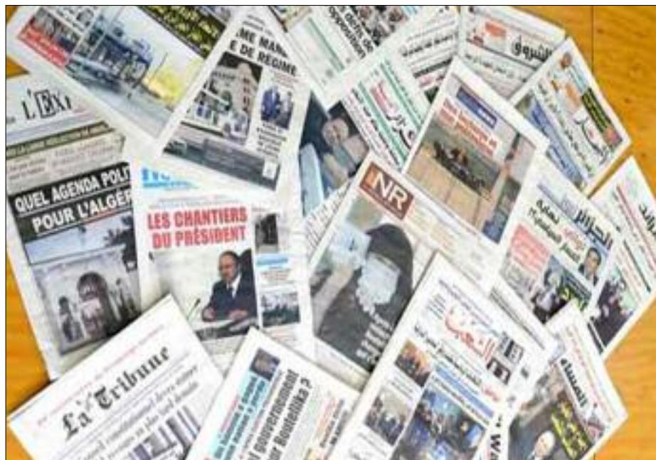
■ L'Algérie souhaite sécuriser son réseau internet qui est faiblement sécurisé et menacé par des attaques extérieures.

Cette même étude nous démontre aussi que Facebook, un des réseaux socio-numériques les plus populaires, propose des caractéristiques uniques qui pourraient être mises à disposition de la gestion de crise. Crowe qui a étudié Facebook a mis en lumière la portée du réseau socio-numérique. Or, l'information disponible n'a pas la même fonction selon le moment de la crise. Avant la réalisation de l'événement inattendu, il s'agit avant tout de devancer une catastrophe et de diminuer la probabilité d'occurrence du risque en informant et en responsabilisant les citoyens sur leur sécurité. L'information sert avant tout à prévenir des dangers auxquels font face les citoyens. Il s'agit d'une communication des risques où l'échange d'idées et d'informations prévaut, explique-t-on. Nous citons certains exemples d'événe-