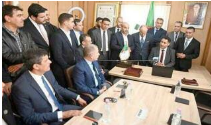
Le ministre de la Communication, M. Mohamed Laâgab, commémore la Journée de la liberté d'expression et de la presse.

A la maison de la presse «Tahar Djaout», à la place du 1 er mai, le ministre de la Communication a procédé à l'inauguration officielle du siège de l'Organisation nationale des journalistes algériens, affirmant qu'il était normal que la famille médiatique s'organise via de pareils syndicats professionnels», souhaitant que