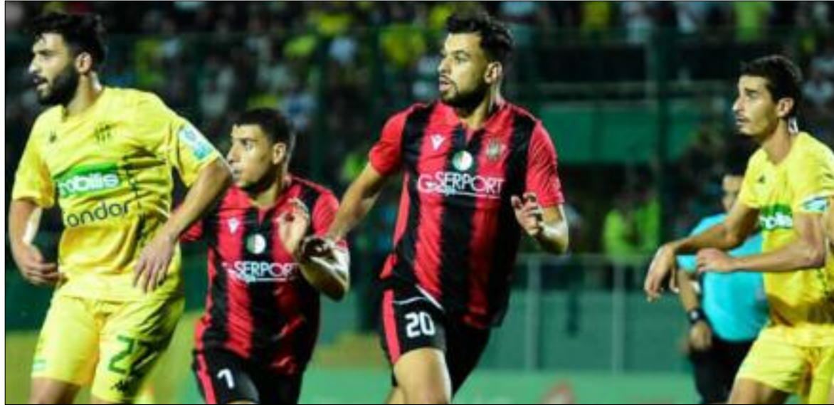
■ USMA-JSK, un match qui ne passera pas sous silence.

Les équipes ne sont jamais certaines. Elles se préparent sans être sûr de la rencontre, ni du stade, ni de l'heure. «On est habitué, ce n'est pas nouveau, faut tout simplement s'y faire...C'est dommage, parce que psychologiquement les joueurs mettent toute l'énergie pour affronter l'adversaire, mais, on vous annonce que la rencontre est reportée. On se sait plus, on se sait quoi dire», déclarait un membre du staff dont l'équipe affrontera l'USM Alger le lundi 6 mai à 19h au stade Nelson Mandela. Bon, notre interlocuteur n'est pas très déçu, puisque la JS Kabylie jouera son premier match à Baraki. Les autres rencontres ont été aussi bousculées, en l'occurrence USM Khenchela - CR Belouizdad, qui devait se jouer hier samedi, et qui a été reprogrammée, pour demain dimanche 5 mai à 16h à indiqué ce jeudi la Ligue de football professionnel. Concerné directement par la lutte pour le maintien, l'USMK a pour mission ce dimanche de s'éloigner de la trappe au risque de faire appel à la calculatrice puisque au classement,