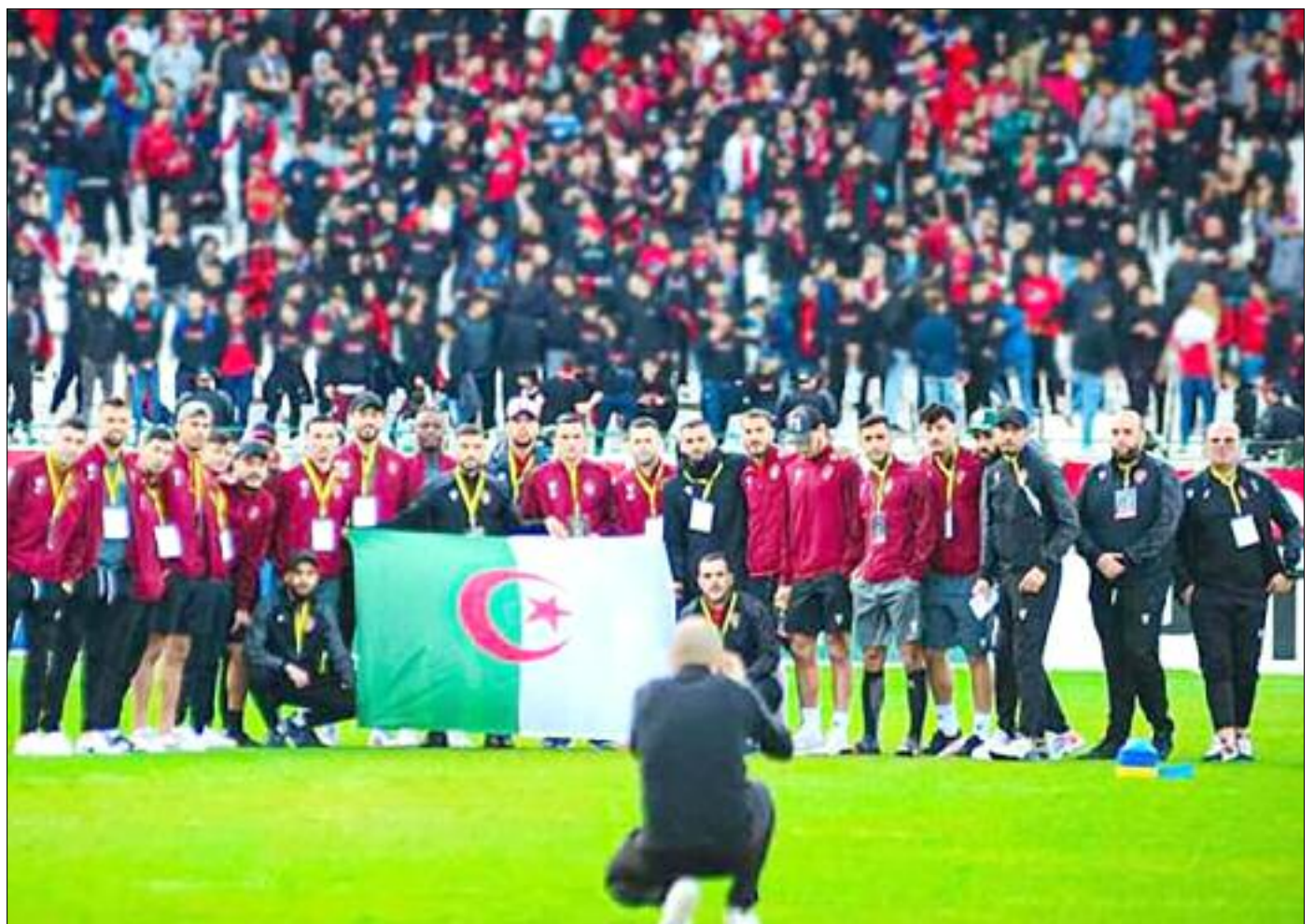
L'USMA lors du match aller.

Ils chantent et annoncent que leur équipe jouera la finale, mais de quelle finale s'agit-il, puisque la CAF n'a toujours rien communiqué pour officialiser la rencontre, encore moins le TAS faire annuler la décision de la commission inter-clubs de la Confédération africaine de football d'autoriser le club de Berkane de porter des maillots floqués d'un message politique. Comment, et de quelle manière, feront-ils trafiquer les textes, puisque champions dans ce domaine. Les statuts, règlements, directives et autres chapitres des textes qui interdisent tout produit avec un message politique. Clair et précis. «La CAF, sollicitée par Berkane, club marocain, a marqué son accord à la demande de Berkane de porter un maillot avec un message politique». Loin de rester les bras croisés ou être le simple spectateur de ce qui se passe sur terrain qui serait conquis par le Makhzen. Ce n'est un secret pour personne, jeudi dernier, la Fédéra-