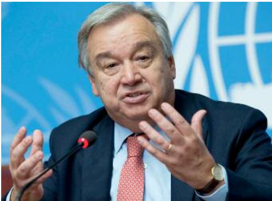
Antonio Guterres, Secrétaire général des Nations unies.

Le Secrétaire général des Nations unies, Antonio Guterres, a déclaré que les journalistes mettaient leur vie en danger pour exercer leur métier et a exprimé son indignation face au nombre de journalistes tombés en martyrs dans l'agression sioniste contre Ghaza. Guterres a diffusé, vendredi, un message vidéo à l'occasion de la Journée mondiale de la liberté de la presse.