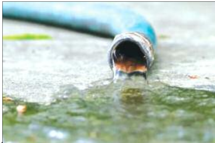
L'Algérienne Des Eaux a mobilisé 25 brigades en provenance de 17 wilayas du pays pour mettre fin au gaspillage de l'eau.

Il suffit dans un laps de temps de réaliser trois forages et la mise en service avec un débit de 60 litres/seconde afin d'alimenter Tiaret avec 5.000 m 3 /jour de Tounnina et 3.000 de Sidi Ouaddah et autres récupéra-