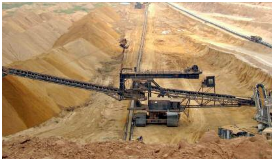
■ L'équipe de travail algéro-chinoise a présenté un exposé détaillé sur les résultats positifs de l'exploration préliminaire, qui ont permis de découvrir des indices de présence de plusieurs ressources minérales et de terres rares.

L'annonce a été faite, jeudi, par le ministère de l'Energie et des Mines via un communiqué. Les résultats positifs de l'exploration préliminaire, a fait savoir le département de Mohamed Arkab, ont permis de découvrir des indices de présence de plusieurs ressources minérales et de terres rares (wolfram, tungstène, niobium, tantale et autres...), à l'instar du minerai de lithium. Dans le but, a poursuivi la même source, de mettre en place un plan d'exploration et de développement à moyen et long termes, en tenant compte des aspects écono-