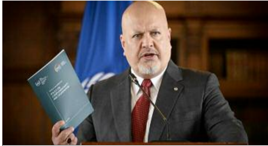
■ «Crime contre l'humanité et crimes de guerre des responsables palestiniens sur les israéliens» ? Est-ce sérieux ? On aurait cru que ce sont les Palestiniens qui ont colonisé les Israéliens pendant 76 ans !

En écoutant l'annonce du procureur [1] de la CPI, on a constaté que c'est le procès du Hamas qui est mis en avant, reléguant ainsi celui de Netanyahu et de Gallant au second plan. Il semble avoir réussi à trouver une manière de mélanger les genres pour brouiller les vues et les avis. Ce procureur, Karim Khan, a révélé [2], probablement pour prouver l'impartialité de la Cour, qu'il a été menacé de ne pas s'en prendre à Israël. Selon ses dires : «Un haut dirigeant américain élu» lui aurait signifié, un jour, au sujet des crimes commis par les États-Unis en Afghanistan que la CPI «est conçue pour l'Afrique et pour des voyous comme Poutine et non pour l'Occident et ses alliés.» On le savait, mais lorsqu'elle visait des Africains, ce Karim n'avait rien révélé. Actuellement, cette Cour se réveille parce qu'elle se sent obligée de prendre une décision en raison des pressions, des preuves des crimes israéliens multiples et publiques, ainsi que des réactions de la CIJ. Cependant, il a manœuvré de manière rusée en utilisant une astuce minable qui consiste à accuser les deux parties, pour faire bonne mesure, en les mettant au même plan ! Mal lui en a pris, il a commis une grave erreur en assimilant la victime colonisée et le colonisateur bourreau dans le même procès tout en favorisant ce dernier ! Il a commencé par accuser trois hauts responsables palestiniens de «péna-