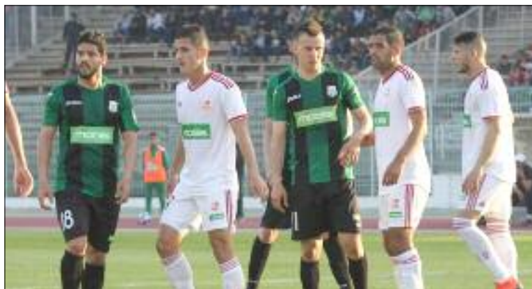
Le CRB et le CSC livreront un duel à distance pour la place de dauphin.

→ Le CR Belouizdad et le CS Constantine, livreront un duel à distance pour la place de dauphin, en affrontant respectivement le MC El-Bayadh et l'US Biskra, alors que la course pour le maintien amorcera un virage important avec au menu le choc des malclassés entre le MC Oran et l'ES Ben Aknoun, à l'occasion de la 27 e journée du championnat de Ligue 1 Mobilis de football, prévue dimanche.