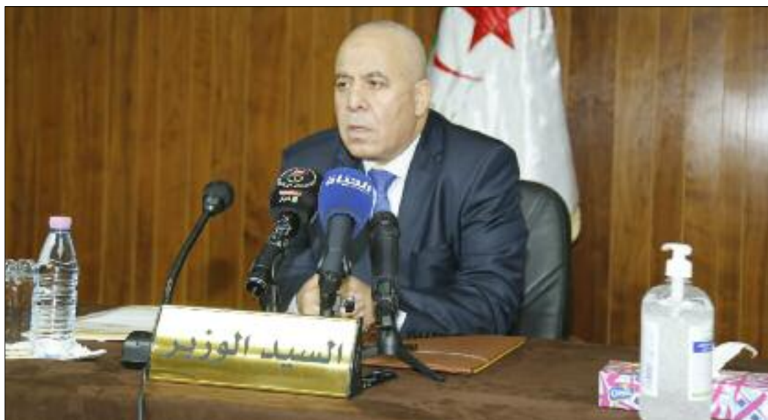
■ Cherfa: «Le secteur est en passe d'élaborer un plan d'investissement comprenant la mobilisation des ressources hydriques, l'acquisition de matériel agricole, d'intrants et de plants d'arbres résistants, afin de concrétiser la nouvelle vision en matière d'agriculture».

Les quatre filières sont prises en charge par quatre sociétés: EPE-SPA Sodelsec (plus de 38.500 hectares pour la culture de légumineuses telles que les lentilles et les pois chiches); EPE-SPA Sodeol (filière des graines oléagineuses, superficie de plus de 33.300 hectares, culture de plantes oléifères, y compris la production de graines de tournesol); EPE-SPA Sodear, filière des arbres résistants avec une superficie de 2.925 hectares pour la plantation d'arganiers et 1.400 hectares aux pistachiers); EPE-SPA Sodesem (intensification des semences sur une superficie de