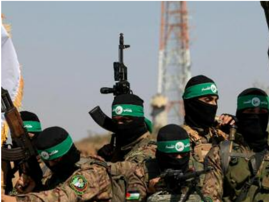
■ Au début de la guerre, Israël a déclaré que son objectif était d'éliminer le Hamas.

des Brigades Qassam du Hamas et d'autres groupes. Une affirmation totalement mensongère d'Israël. La résistance reste retranchée dans plusieurs autres zones de Gaza, en particulier dans la ville de Rafah, à l'extrême sud, qu'Israël avait qualifiée de dernier bastion du Hamas et où les troupes sont également confrontées à une forte résistance depuis que Tel-Aviv avait lancé une opération dans la ville assiégée, informe-t-on. Les combattants plus efficaces continuent de sortir des tunnels pour tendre des embuscades aux soldats à l'aide de lance-roquettes et d'engins explosifs. Ils ont récemment intensifié leur tactique consistant à placer des bombes dans les bâtiments et à les faire exploser alors que les troupes israéliennes y ont installé leurs quartiers. Au début de la guerre, Israël a déclaré que son objectif était d'éliminer le Hamas. Près de huit mois après le début des combats, le Hamas reste plus perspicace. Des experts, y compris des analystes israéliens et occidentaux, ont déclaré qu'« Israël n'a pas atteint ses objectifs dans la bande de Gaza, notamment l'élimination de la résistance et la libération des prisonniers détenus par le Hamas »