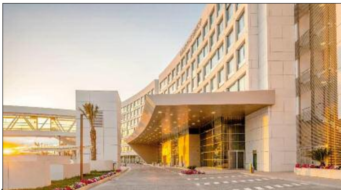
■ Cet établissement qui a connu un parcours remarquable, marqué par des réalisations significatives et un engagement constant envers l'excellence, s'apprête à lancer une promotion destinée aux familles.

De même, nous reconnaissons et apprécions la fidélité de nos employés, dont beaucoup sont avec nous depuis 5 années et dont le dévouement et le professionnalisme ont joué un rôle crucial dans notre parcours. Nous sommes profondément reconnaissants envers nos partenaires