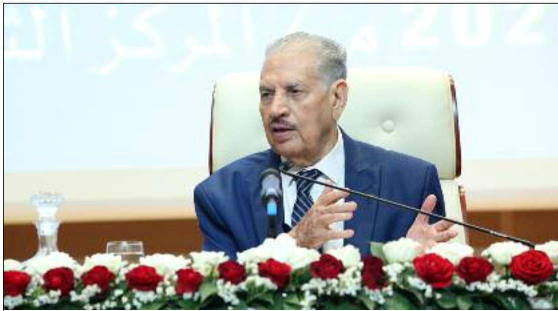
Le ministre de l'Agriculture a annoncé la restructuration du Groupe de valorisation des produits agricoles (Gvapro) en Entreprise publique économique par actions pour développer les cultures agricoles stratégiques.