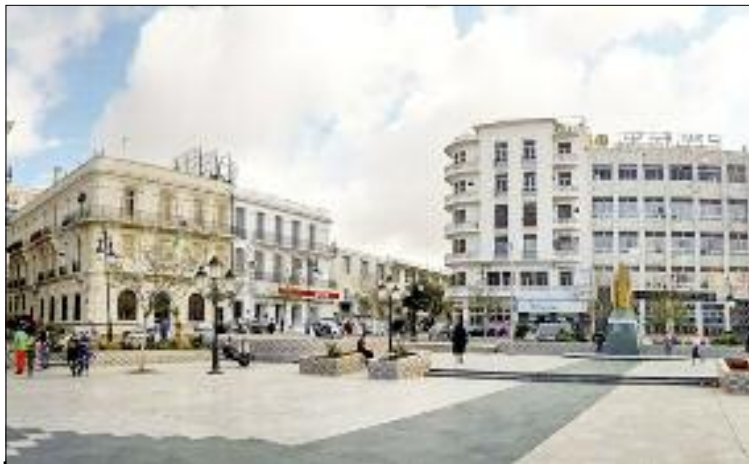
■ Wilaya de Tiaret.