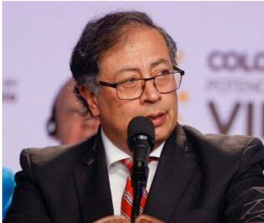
■ Gustavo Francisco Petro Urrego, né le 19 avril 1960 à Ciénaga de Oro, est un homme d'État colombien, président de la République de Colombie depuis le 7 août 2022.